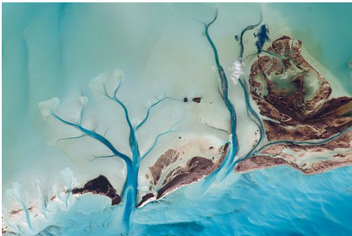
Ποτάμια συνδέονται με τη θάλασσα στις Μπαχάμες