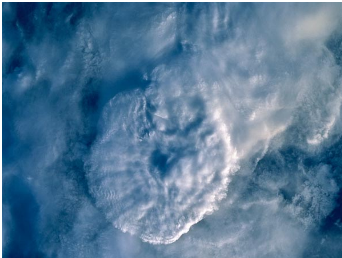
Καταιγίδα με κεραυνούς πάνω από την Ασία