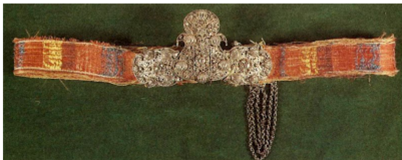
«Ζώνη («κολάνα») με πούκλες». Ανήκει στη γυναικεία φορεσιά των πόλεων της Κύπρου, τέλος 19ου αιώνα. Εθνικό Ιστορικό Μουσείο, Αθήνα. αρ. 2284.