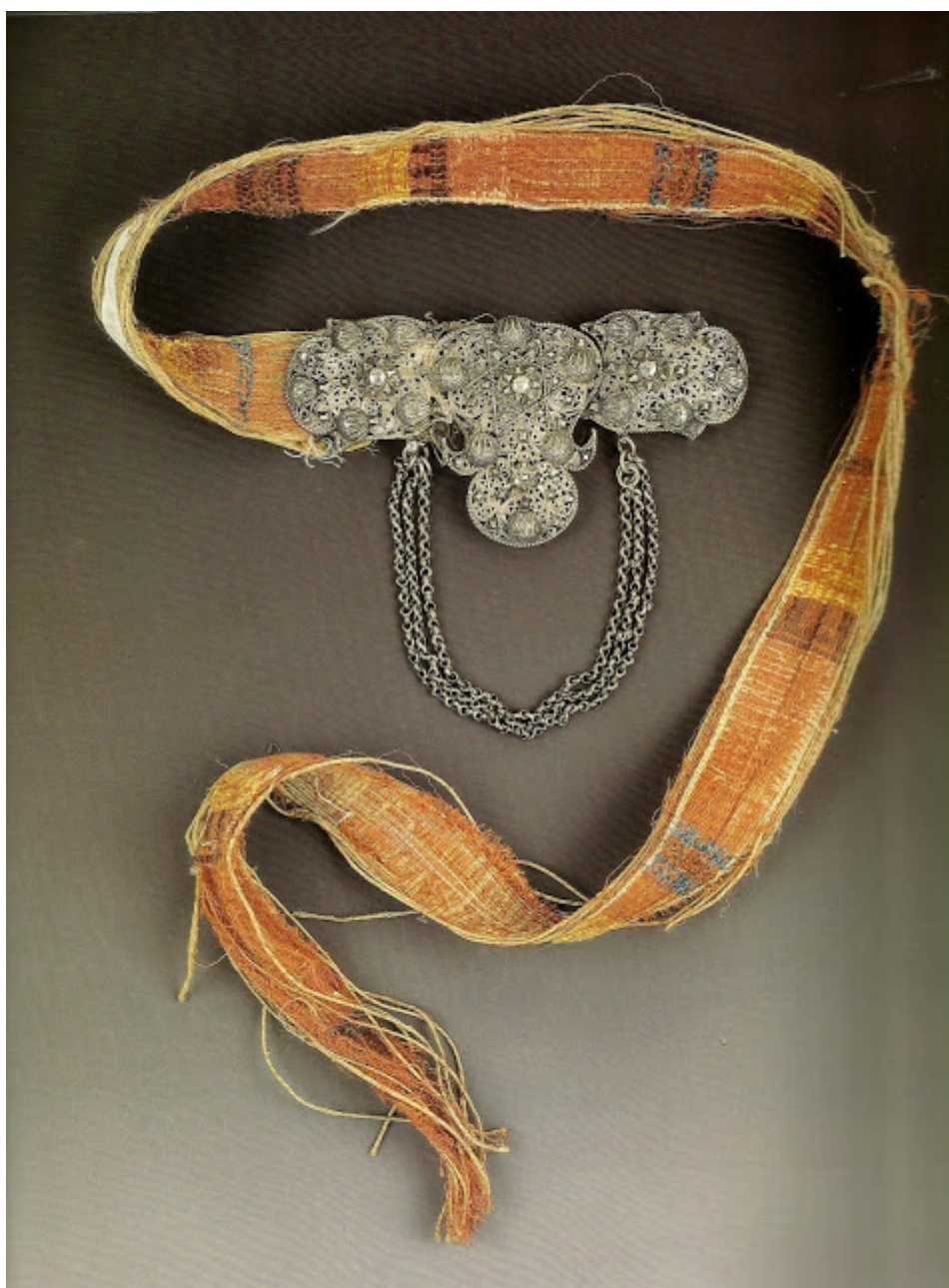
«Ζώνη («κολάνα») με πούκλες». Ανήκει στη γυναικεία φορεσιά των πόλεων