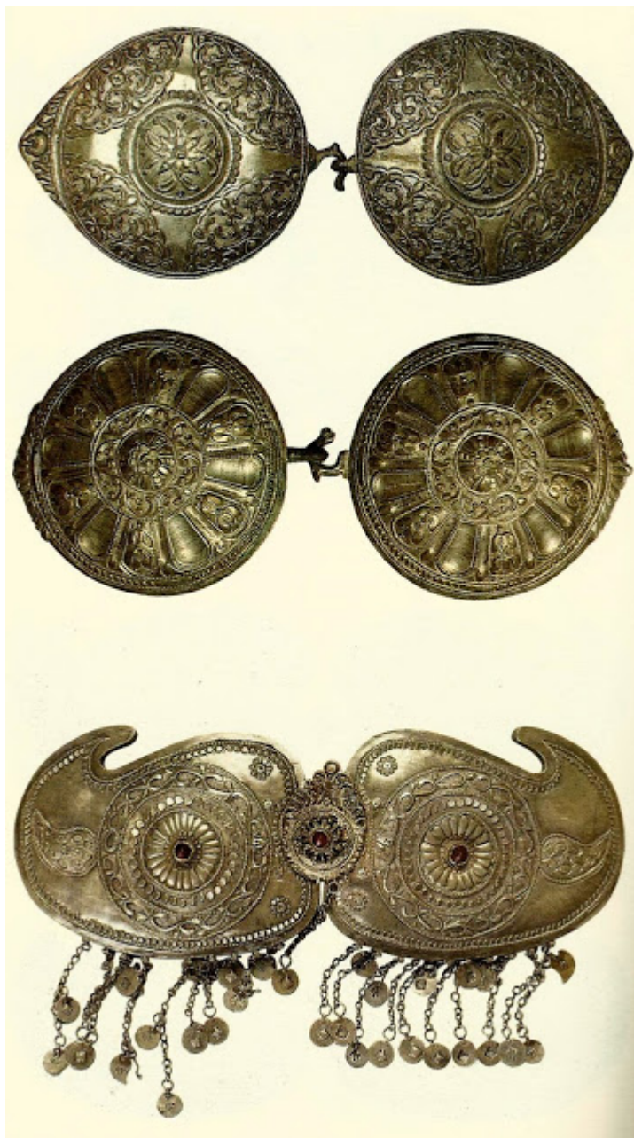
α, β). Πόρπες με ανάγλυφο έκτυπο και εγχάρακτο διάκοσμο φυτικών μοτίβων. Συλλογή Πάυλου Νεοφύτου, Λευκωσία. γ). «πούκλα αθασοτή» με έκτυπο διάκοσμο κα ένθετες πέτρες. Συλλογή Κυπρακού Μουσείου, Λευκωσία.