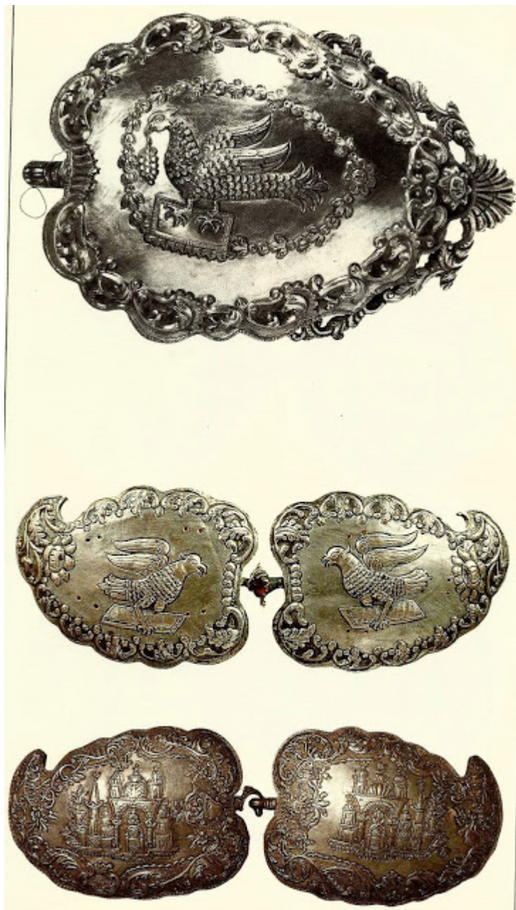
α). Ασημένια «πούκλα» με αετό. Συλλογή Κυπριακού Μουσείου, Λευκωσία.