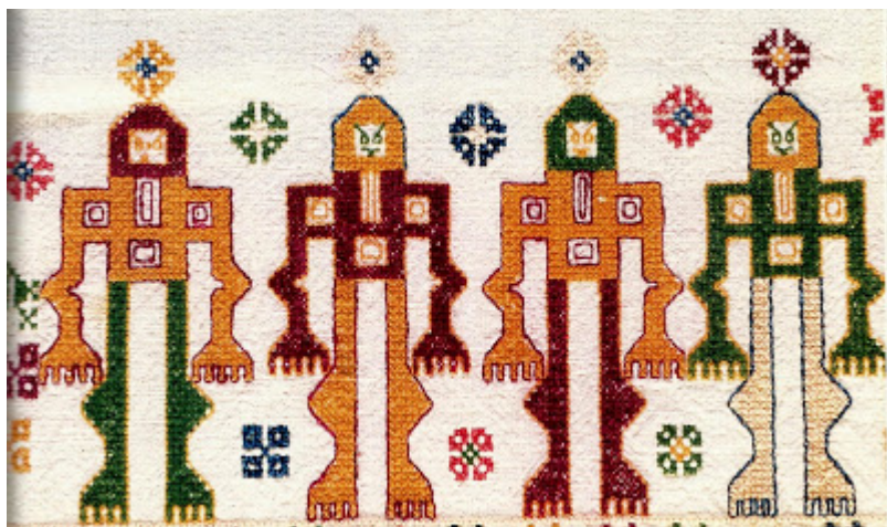
Οι "σταυροφόροι" σε κοντινό πλάνο