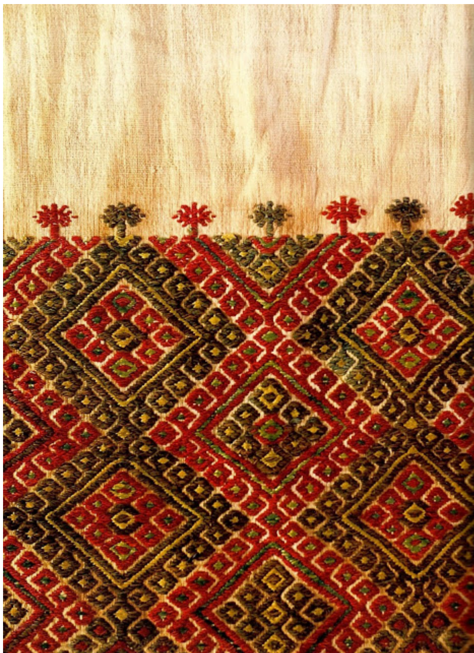
Υφαντό κέντημα σε βαμβακερό γυναικείο ποβράτζι. Πάφος 19ος αι.