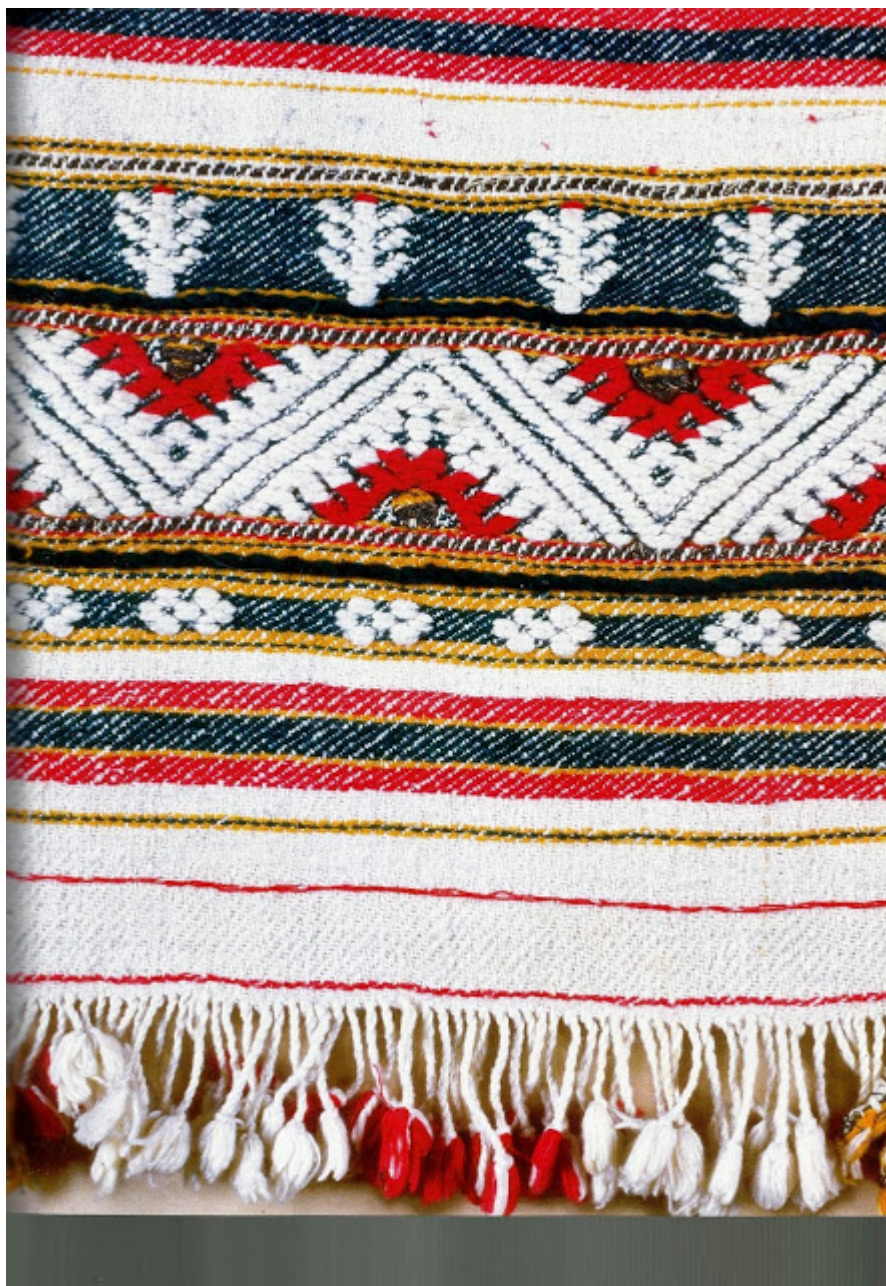
Υφαντό φυδκιώτικο κέντημα σε δίμιτη βαμβακερή μαντιλιά. Φύτη, 19ος αιώνας.