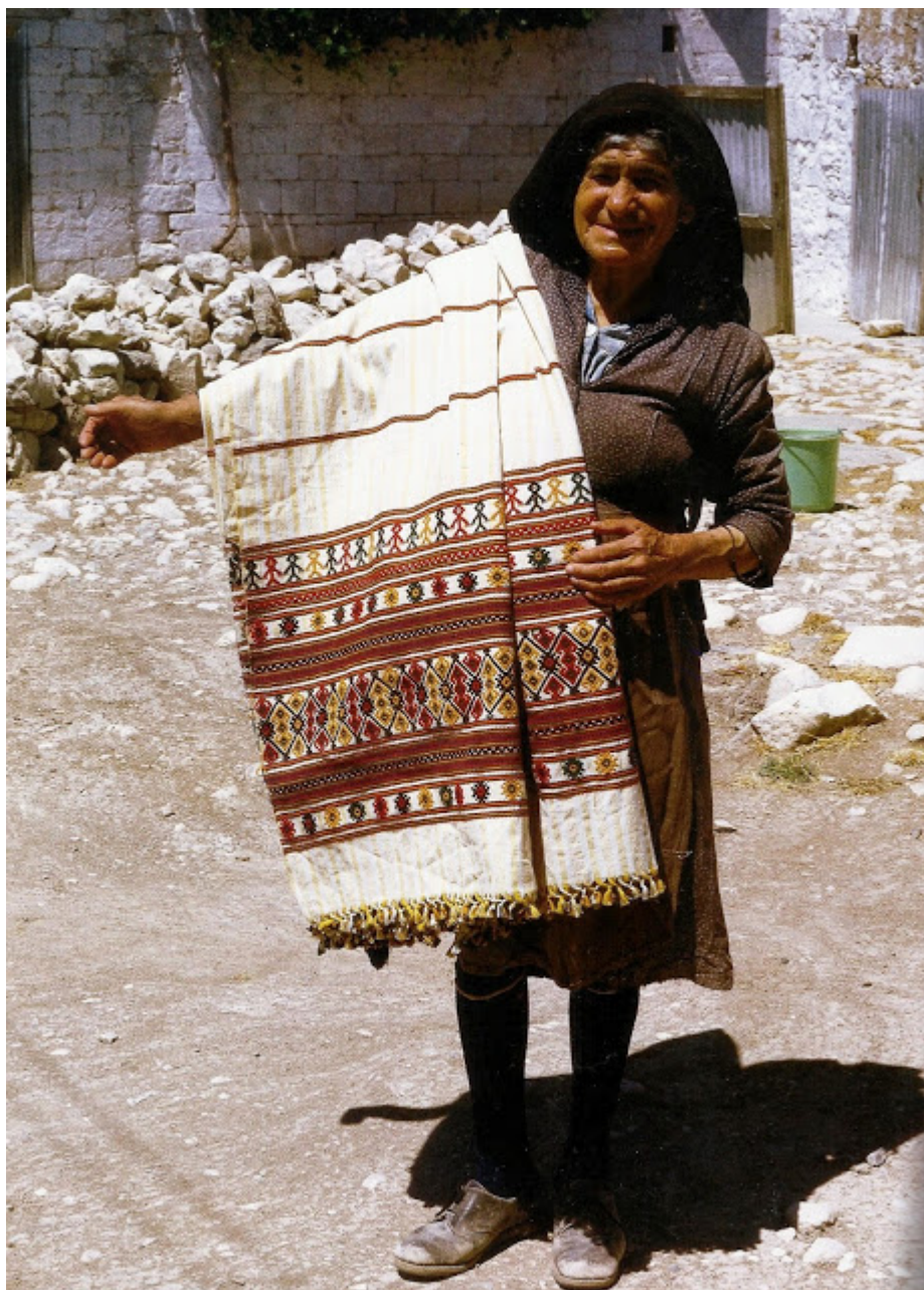
Υφάντρα με βαμβακερό φυδκιώτικο πλουμιστό σεντόνι. Φύτη. 1969.