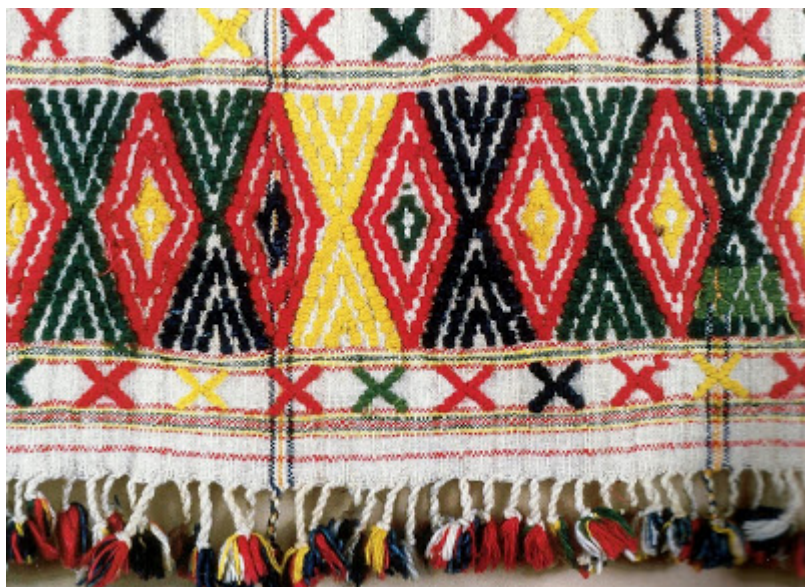
Υφαντό κέντημα σε βαμβακερή μαντιλιά. Πάφος, αρχές 2ού αι.