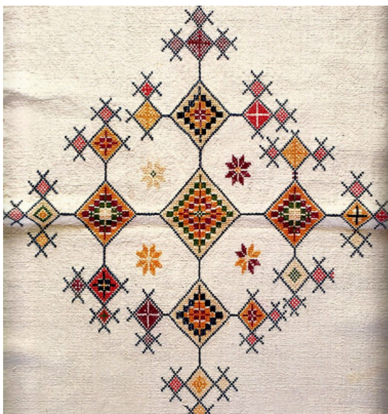
Κεντρικό μοτίβο σταυρός σε σταυροβελονιά από βαμβακερή μαντιλιά. Πάφος, 19ος αι.