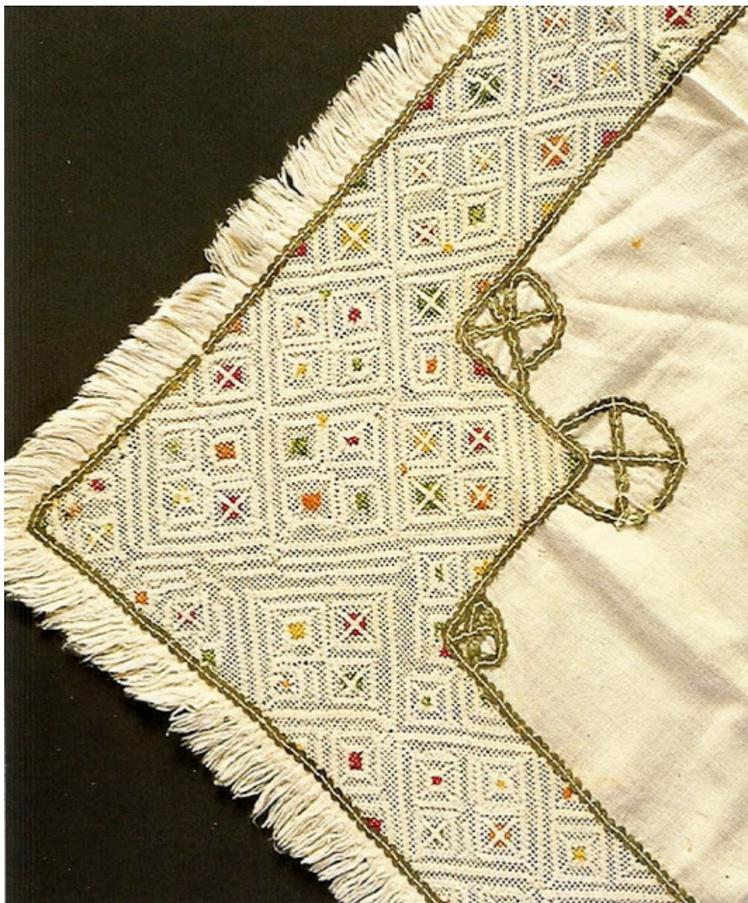
Λαυκοκέντημα ασπροπλούμι σε βαμβακερό μαντίλι. Πάφος, 19ος αι.