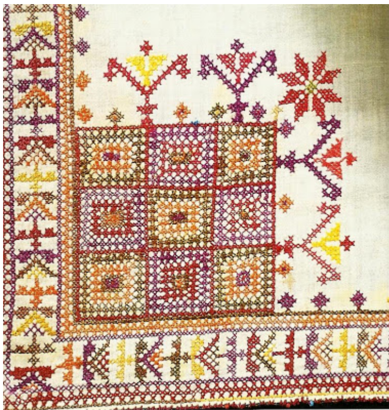
Σταυροβελονιά σε βαμβακερό μαντίλι. Πάφος, αρχές 20ού αι.