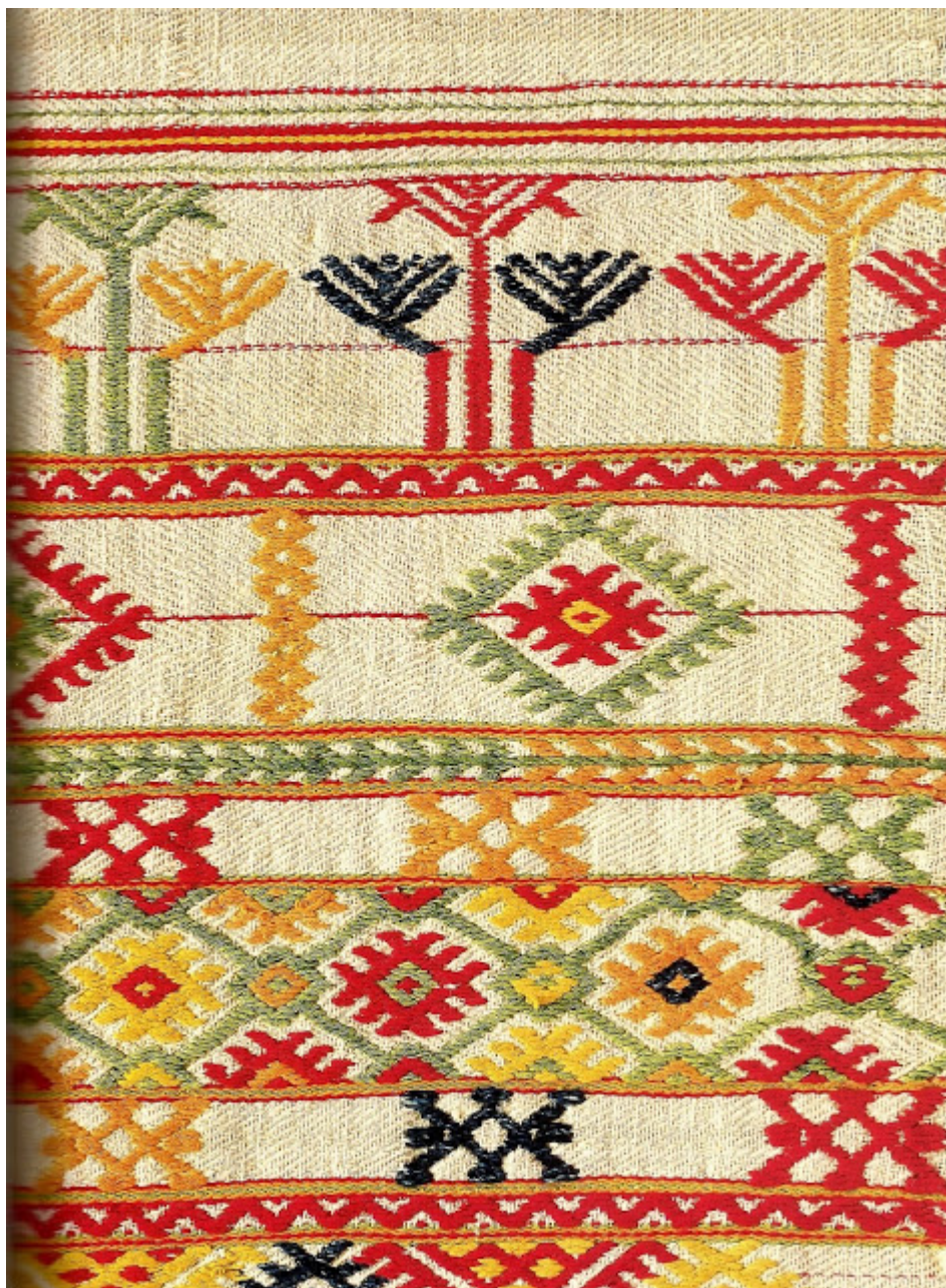
Υφαντά φυδκιώτικα πλουριά σε μαλλινοβάμβακο δίμιτο ιγραμοσέντο. Πάφος, 19ος αι.