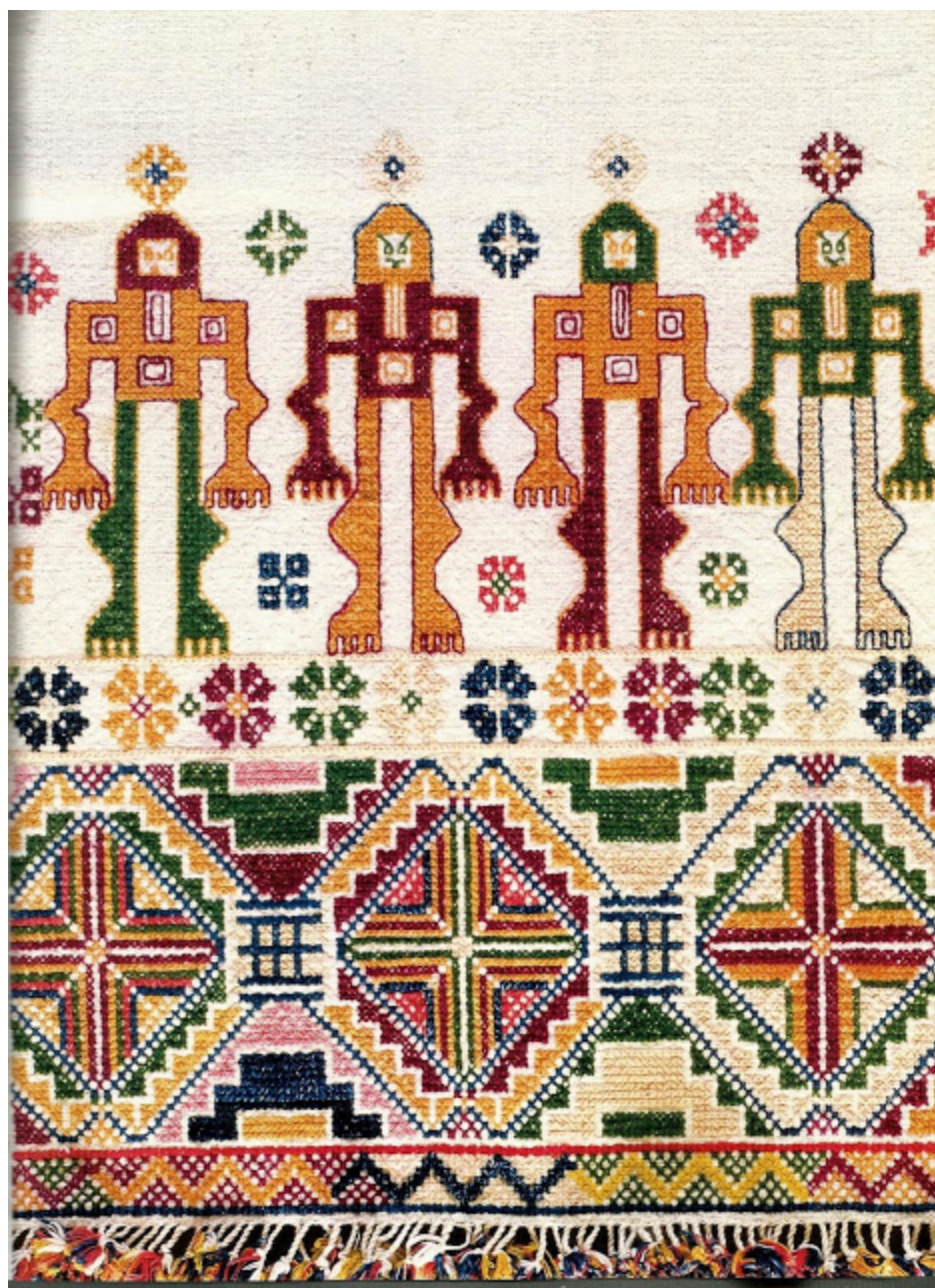
Κέντημα σταυροβελονιά με "σταυροφόρους" σε άκρη βαμβακερής μαντιλιάς. Πάφος, 19ος αι.