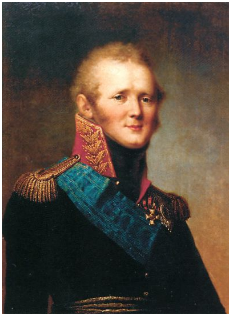
Τσάρος Αλέξανδρος Α΄

Τέλος, ο Αλέξανδρος Α΄ θα επεδίωκε, όπως φάνηκε αργότερα από το ρωσικό σχέδιο του 1815 και το υπόμνημα της 8 ης Οκτωβρίου 1818 στο συνέδριο της Αιξ-λα-Σαπέλ (Aix-La-Chapelle), αν και οι δύο προτάσεις του απερρίφθησαν, επικαλούμενος τις αρχές της ιεράς Συμμαχίας θα επεδίωκε λοιπόν να επεμβαίνει στα εσωτερικά άλλων κρατών για την καταστολή επαναστατικών κινημάτων και την στήριξη των νομίμων ηγεμόνων. Από αυτό το τελευταίο φαίνεται ότι ο τσάρος επιθυμούσε να χρησιμοποιήσει την Ιερά Συμμαχία στην εφαρμογή μιας συντηρητικής πολιτικής «που θα διασφάλιζε την διατήρηση του εδαφικού καθεστώτος, αντιτιθέμενη σε κάθε συνοριακή μεταβολή και θα προστάτευε το υφιστάμενο πολιτικό καθεστώς, αποτρέποντας δυναμικά οποιαδήποτε συνταγματική παραχώρηση».[11]