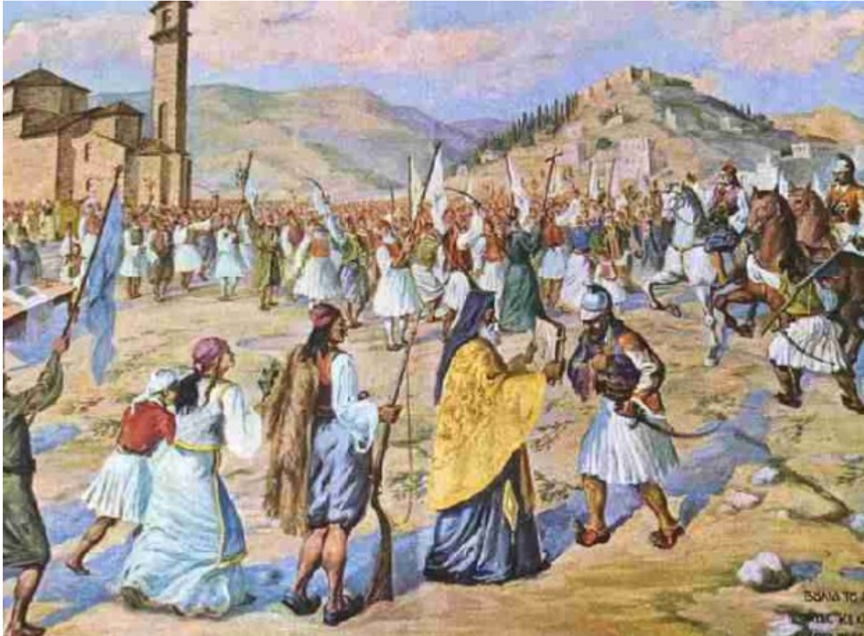
Το συνέδριο της Ιεράς Συμμαχίας στην Βερόνα (1822)

Θέμα της παρούσης εργασίας αποτελεί, όπως δηλώνει και ο τίτλος της, η Ιερά Συμμαχία (Sainte Alliance, Holy Alliance), που συνήψαν οι ηγεμόνες της Αυστρίας, Πρωσίας και Ρωσίας το 1815, και στην οποία συμμαχία προσχώρησαν κατόπιν όλα σχεδόν τα ευρωπαϊκά κράτη. Τα ζητήματα που θα μας απασχολήσουν είναι το περιεχόμενο και ο χαρακτήρας της συνθήκης της Ιεράς Συμμαχίας, τα ιστορικά πρόσωπα που συνέβαλαν στην διαμόρφωσή της, οι βαθύτεροι λόγοι που υπαγόρευσαν την σύναψή της, καθώς και τα αίτια που οδήγησαν τις κυριότερες ευρωπαϊκές χώρες να συνυπογράψουν ή όχι το κείμενο της συνθήκης. Τέλος, θα εξετασθούν οι συνέπειές της για την Ευρώπη αλλά και την επαναστατημένη Ελλάδα. Η Ιερά Συμμαχία αποτελεί ένα έξοχο παράδειγμα του πως η επίκληση στις χριστιανικές αρχές χρησιμοποιείται προσχηματικά για διπλωματικές επιδιώξεις στις διεθνείς σχέσεις.