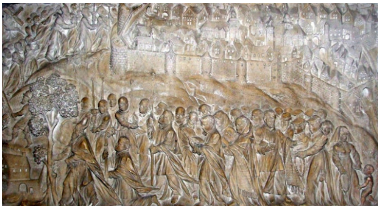
Λεπτομέρεια του ανάλυφου της μετακομιδής της Τιμίας Κάρας του Αγίου Μάμαντος.