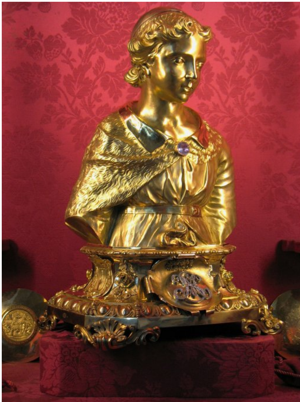
Η λειψανοθήκη της Τιμίας Κάρας του Αγίου Μάμαντος. Γαλλικό έργο του 1855.

Η κάρα του Αγίου Μάμαντος περιέχονταν σε μία πολύτιμη λειψανοθήκη σε σχήμα μπούστου που όμως δηώθηκε κατά την περίοδο της Γαλλικής Επανάστασης. Σήμερα βρίσκεται σε παρόμοια λειψανοθήκη του 1855, δώρο του Καρδινάλιου Césaire Mathieu, πρώην επισκόπου της Langres. Η λειψανοθήκη είναι από επίχρυσο ασήμι και έχει διαστάσεις 63X41X33 εκ. Το πάνω μέρος της λειψανοθήκης ανοίγει και αποκαλύπτει την Τιμία Κάρα του Αγίου Παιδομάρτυρος Μάμαντος.