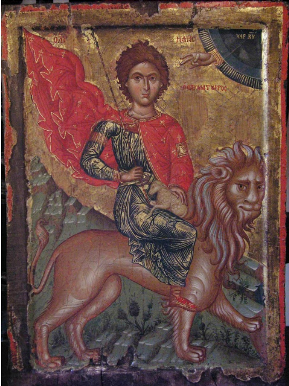
Εικόνα του Αγίου Μάρκου από την Κύπρο.

Δείτε φωτογραφίες και διαβάστε περισσότερα παρακάτω: