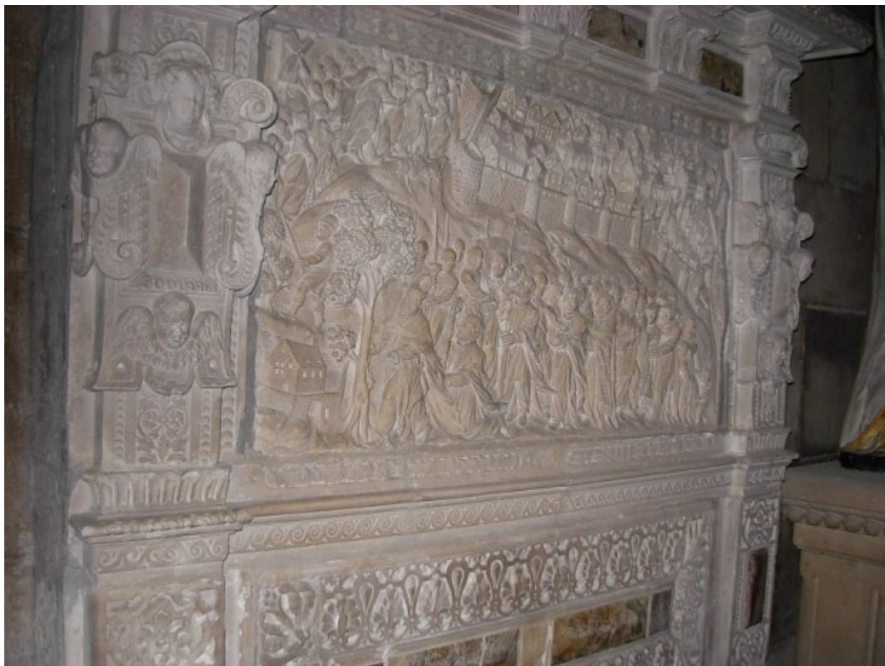
Ανάγλυφο στον Καθεδρικό Ναό της Langres που απεικονίζει την μετακομιδή της Τιμίας Κάρας του Αγίου Μάμαντος στη Langres της Γαλλίας.