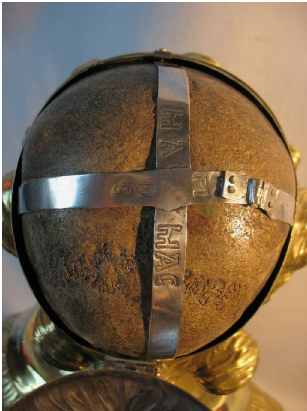
Η θήκη της λειψανοθήκης ανοιχτή. Στο εσωτερικό η Τιμία Κάρα του Αγίου Παιδομάρτυρος Μάμαντος με το ασημένιο βυζαντινό στεφάνι και το όνομα του Αγίου γραμμένο στα ελληνικά.