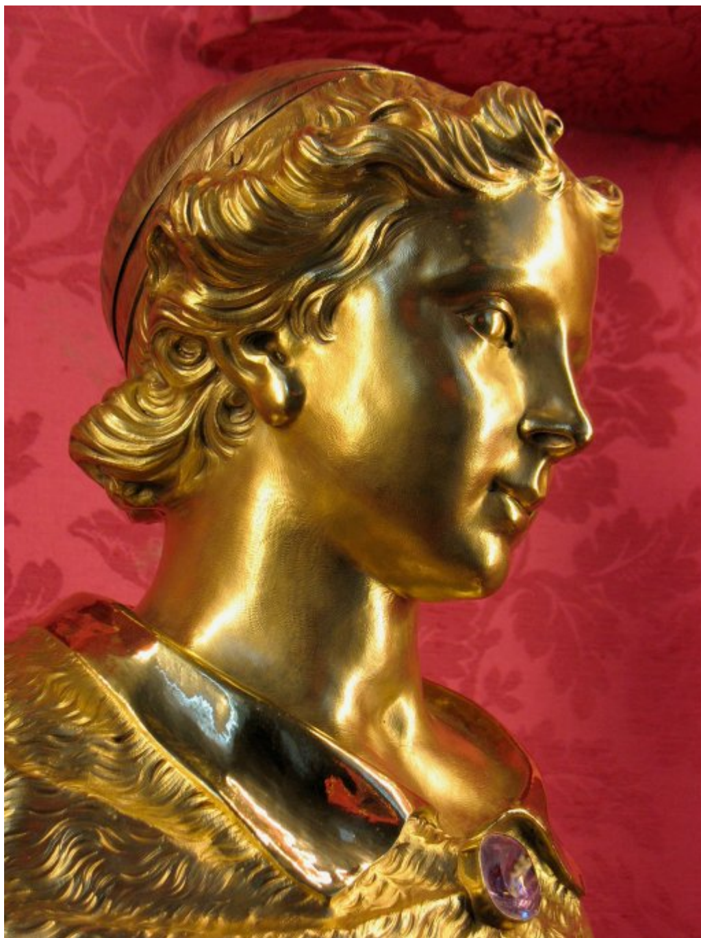
Η λειψανοθήκη της Τιμίας Κάρας του Αγίου Μάμαντος (λεπτομέρεια). Διακρίνεται η θήκη στο πίσω μέρος της κεφαλής.