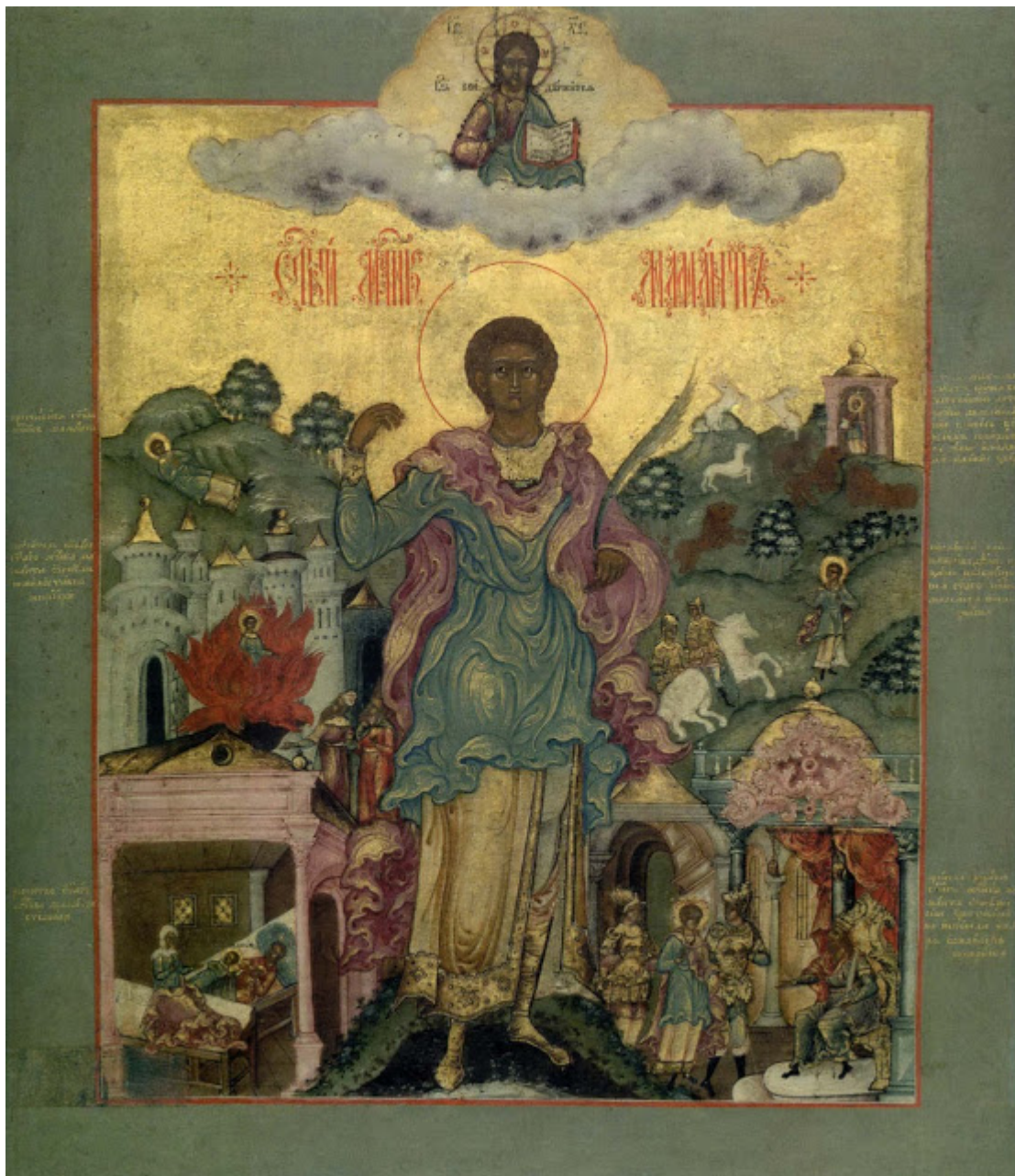
Ρωσική εικόνα του 19ου αιώνα που εικονίζει τον Άγιο Μάμα με σκηνές από το βίο του.

Κατά την εφηβική του ηλικία ο Μάμας συνελήφθη από ειδωλολάτρες, που τον υπέβαλαν σε βασανιστήρια. Τελικά του κρέμασαν στο λαιμό ένα σιδερένιο ραβδί και τον έριξαν στο νερό για να πνιγεί. Κατά θαυματουργό τρόπο ο Άγιος επέζησε αλλά πιάστηκε ξανά από τους βασανιστές του και ρίχτηκε σε αναμμένη κάμινο. Και αυτήν τη φορά κατάφερε να βγει σώος. Όταν έριξαν επάνω του άγρια ζώα, τα τελευταία όχι μόνο δεν τον κατασπάραξαν αλλά ούτε και τον πείραξαν. Σύμφωνα με την παράδοση ένα λιοντάρι τον δέχθηκε στη ράχη του και τον μετέφερε μακριά των άλλων θηρίων, εξ ου και η θεματογραφία της αγιογράφησης του. Τελικά, οι εχθροί του αποφάσισαν να τον εκτελέσουν με τρίαινα. Το φονικό όργανο διαπέρασε