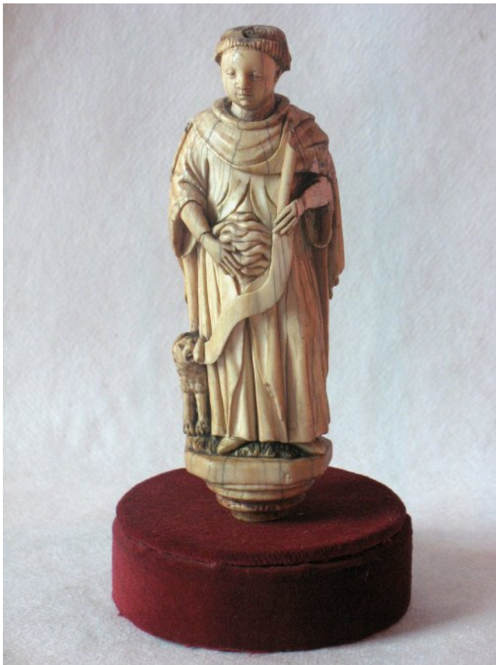
Αγαματίδιο μικρών διαστάσεων του Αγίου Μάμαντος από ελεφαντόδοντο. Ο Άγιος Μάμας κρατάει τα σπλάχνα του, ενώ στο δεξί του πόδι βρίσκεται το λιοντάρι. Μέρος του Θησαυρού του Καθεδρικού Ναού του Αγίου Μάμαντος στη πόλη Langres.