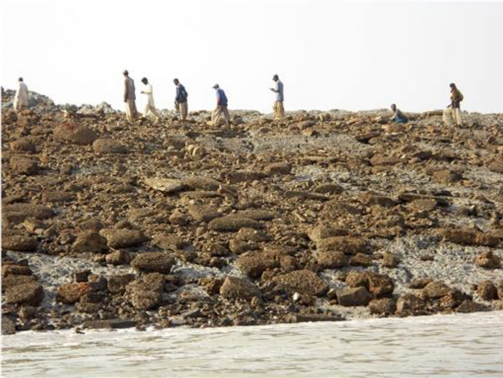
Ένα μικρό νησί

φαίνεται ότι αναδύθηκε από τον ωκεανό έξω από τις ακτές της πόλης Γκουαντάρ του Πακιστάν μετά το σεισμό των 7,7 βαθμών που σκότωσε τουλάχιστον 245 άτομα την Τρίτη. Το περίεργο είναι ότι το νησάκι εμφανίστηκε εκατοντάδες χιλιόμετρα από το επίκεντρο και οι γεωλόγοι δεν έχουν καταλήξει ακόμα για το αν πρόκειται για «ηφαίστειο λάσπης», αποτέλεσμα κατολίσθησης, ή ακόμα και φάρσα.