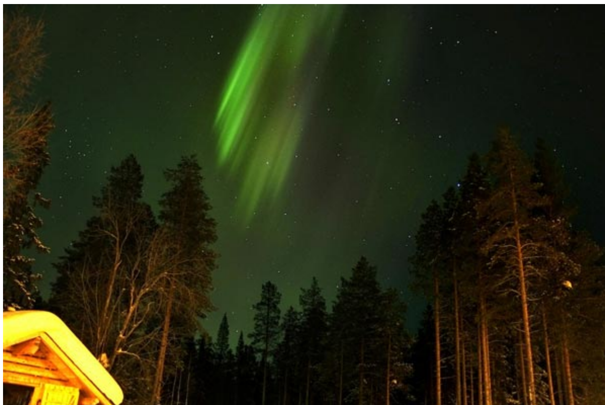
Πράσινο της Φινλανδίας