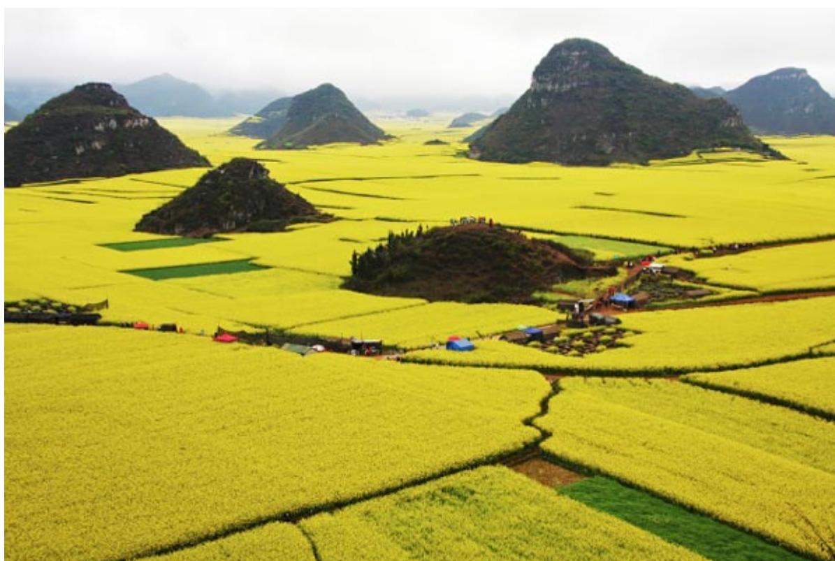
Κίτρινο της Κίνας