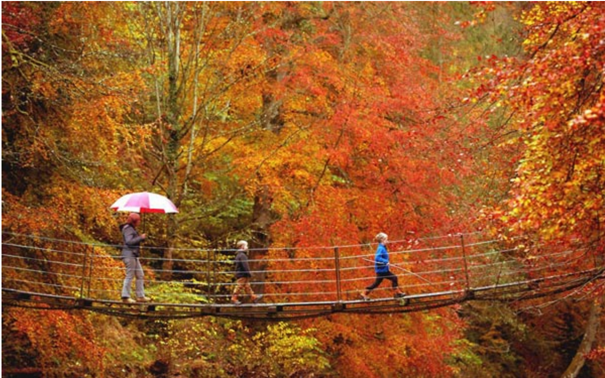
Πορτοκαλί της Βρετανίας

Θέλεις έναν μπλε προορισμό, μια χώρα ή μια πόλη βουτηγμένη στο πορτοκαλί, στο κόκκινο ή μήπως στο λευκό. Χώρες στον κόσμο, αγαπημένοι ταξιδιωτικού προορισμοί συνδυάζονται επιτυχημένα με ένα από τα βασικά χρώματα του ουράνιου τόξου, καθώς δεν είναι λίγες οι φορές που ο ταξιδιώτης ταυτίζει στο μυαλό του μια απόχρωση με έναν τόπο.