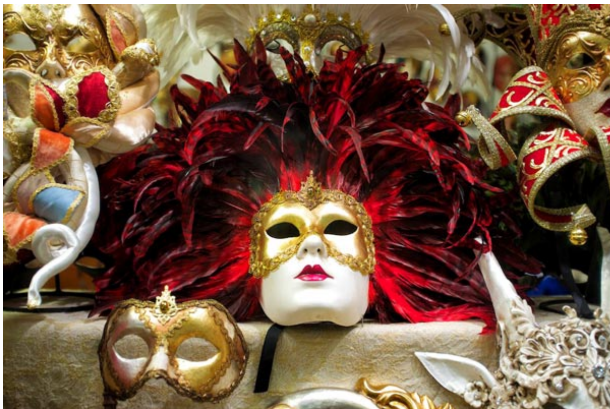
Κόκκινο της Βενετίας