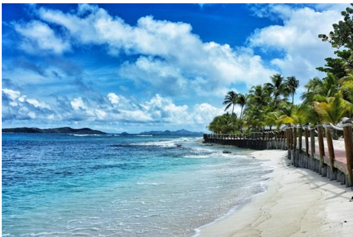
Μπλε των Μαλδίβων