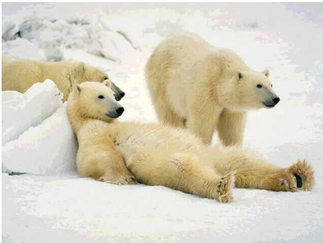
Άσπρο της Αλάσκας