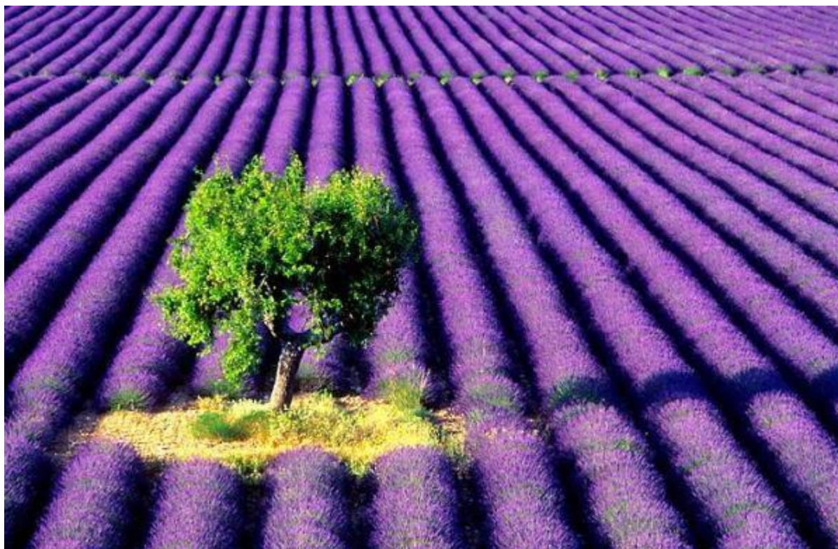
Μοβ της Γαλλίας