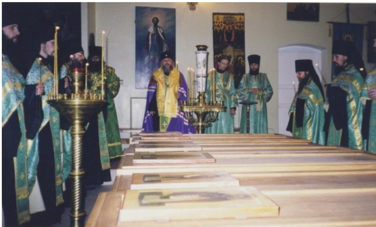
Τα λείψανα των Αγίων σάρετς της Όπτινα

Μετά την απελευθέρωση της Ρωσίας από τον άθεϊστικό ζυγό το 1989 έγινε ή έκταφή του καί ανακηρύχτηκε άγιος. Σήμερα τον εύλαβούνται πολύ καί τον προσκυνούν παντού. Το ιερό λείψανο του αναπαύεται στο καθολικό της “Όπτινα πού λειτουργεί ξανά κι έχει περίπου εκατό μοναχούς.