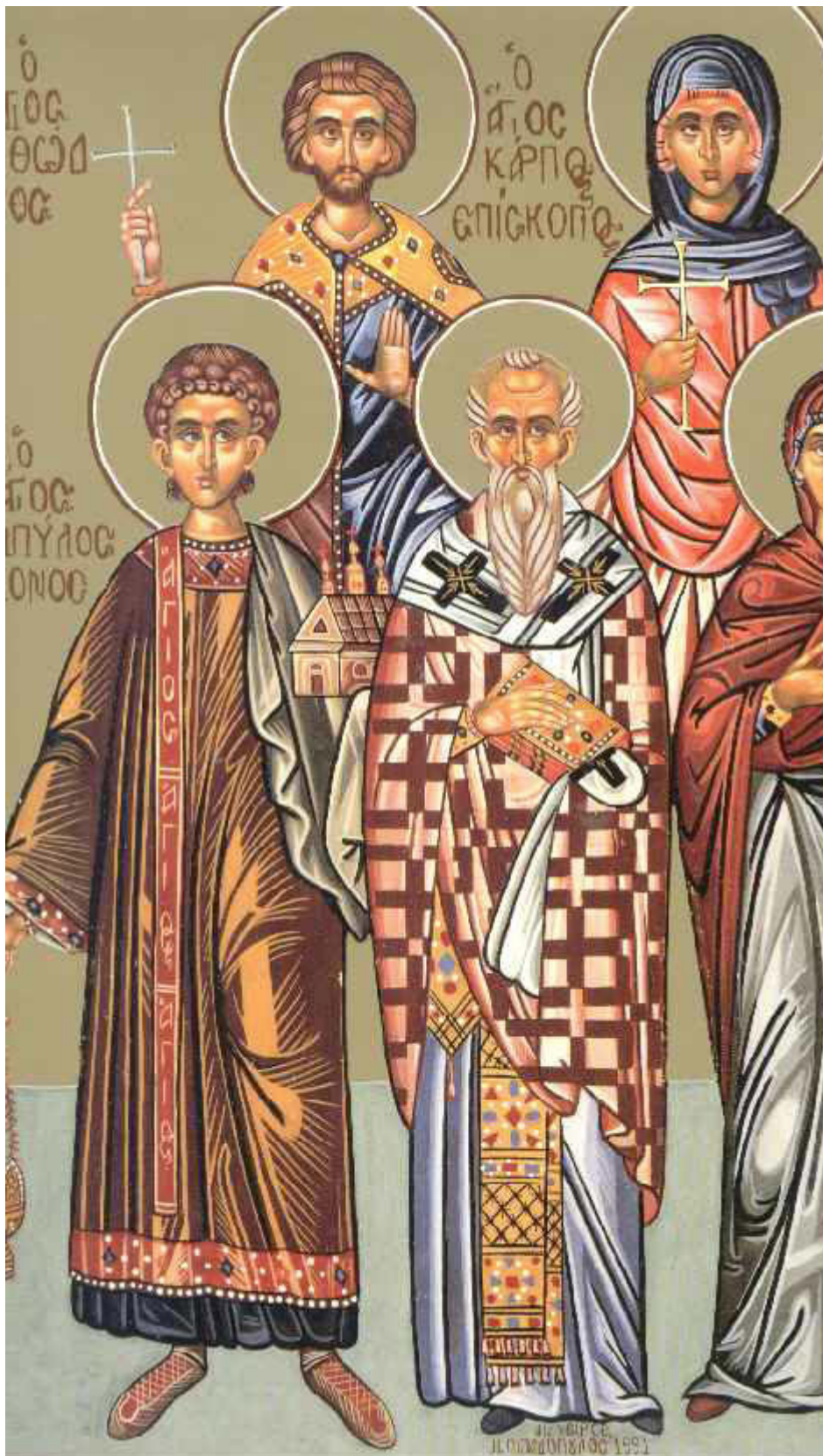
Άγιοι Κάρπος, Πάπυλος, Αγαθόδωρος και Αγαθονίκη

Εορτάζει στις 13 Οκτωβρίου εκάστου έτους.