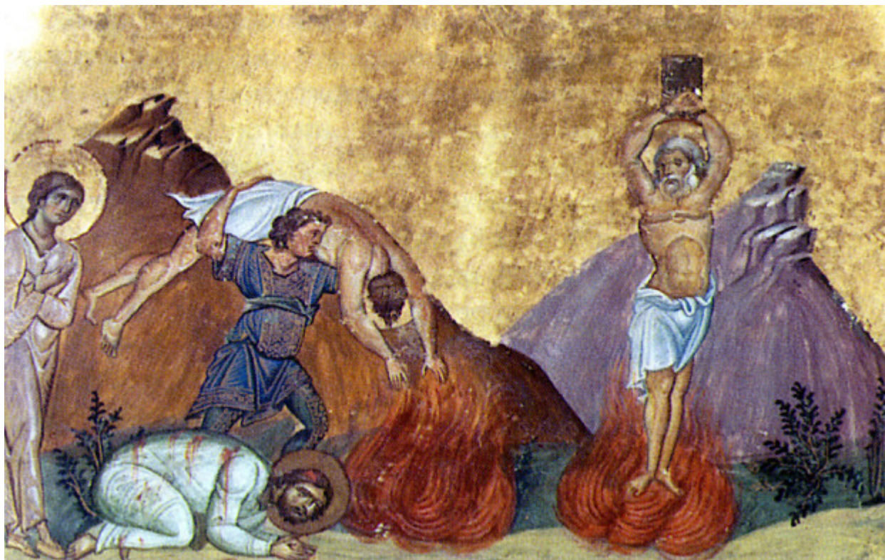
Άγιοι Κάρπος, Πάπυλος, Αγαθόδωρος και Αγαθονίκη