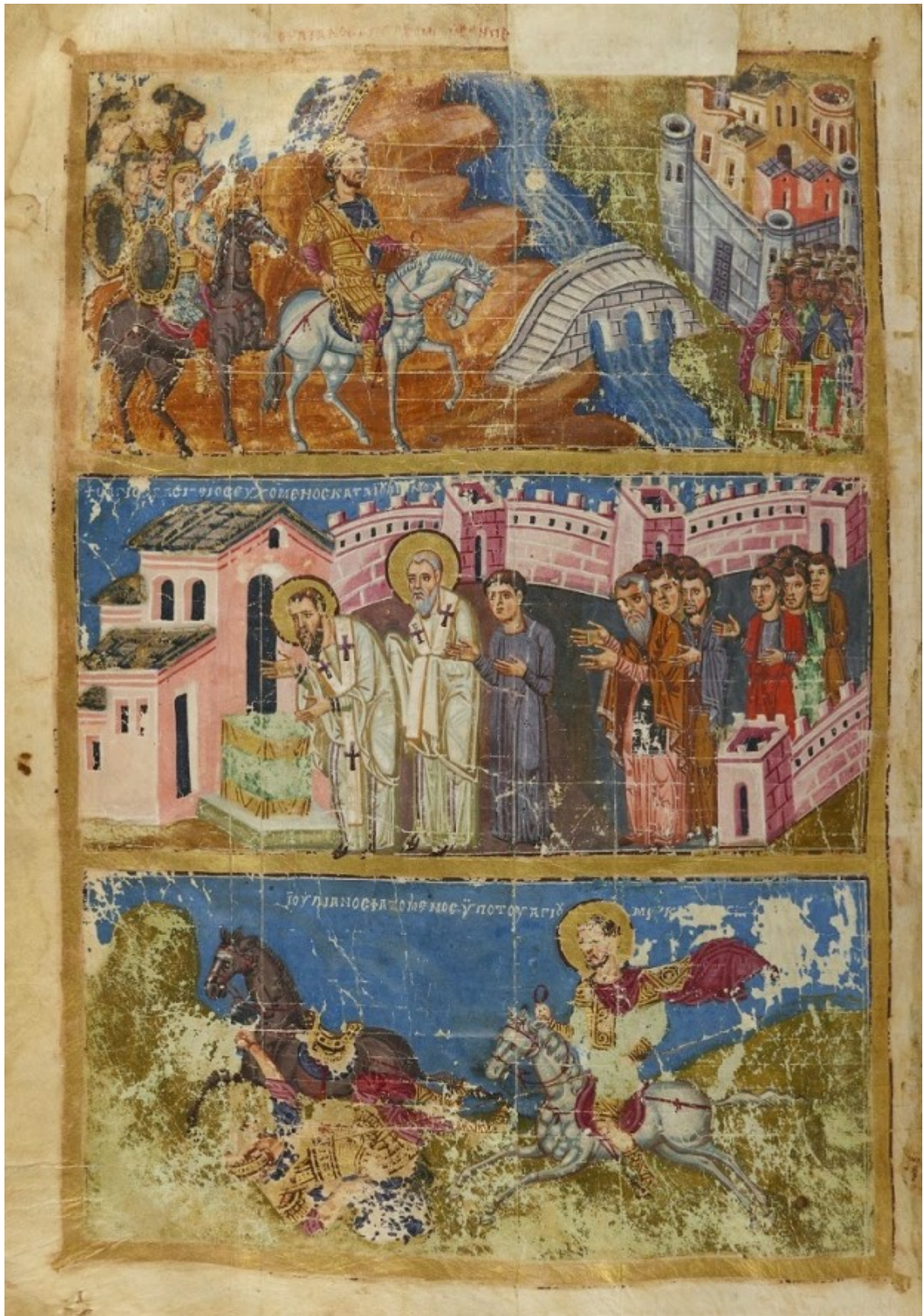
Μικρογραφίες. Διακρίνονται οι επιγραφές: Ο Άγιος Βασίλειος ευχόμενος κατά Ιουλιανού (μέση). Ιουλιανός σφαζόμενος υπό του Αγίου Μερκουρίου (κάτω).