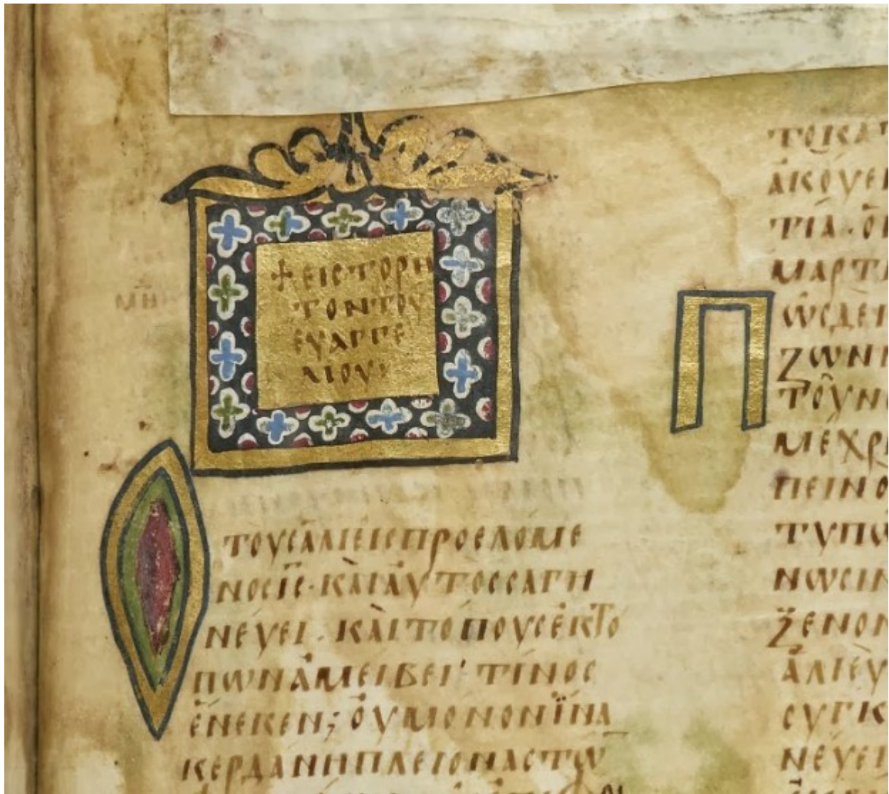
Επίχρσο τετράγωνο διακοσμητικό κόσμημα με την επιγραφή: + Εις το ρητόν του Ευαγγελίου. Διακοσμητικά αρχικά γράμματα (Ο και Π).