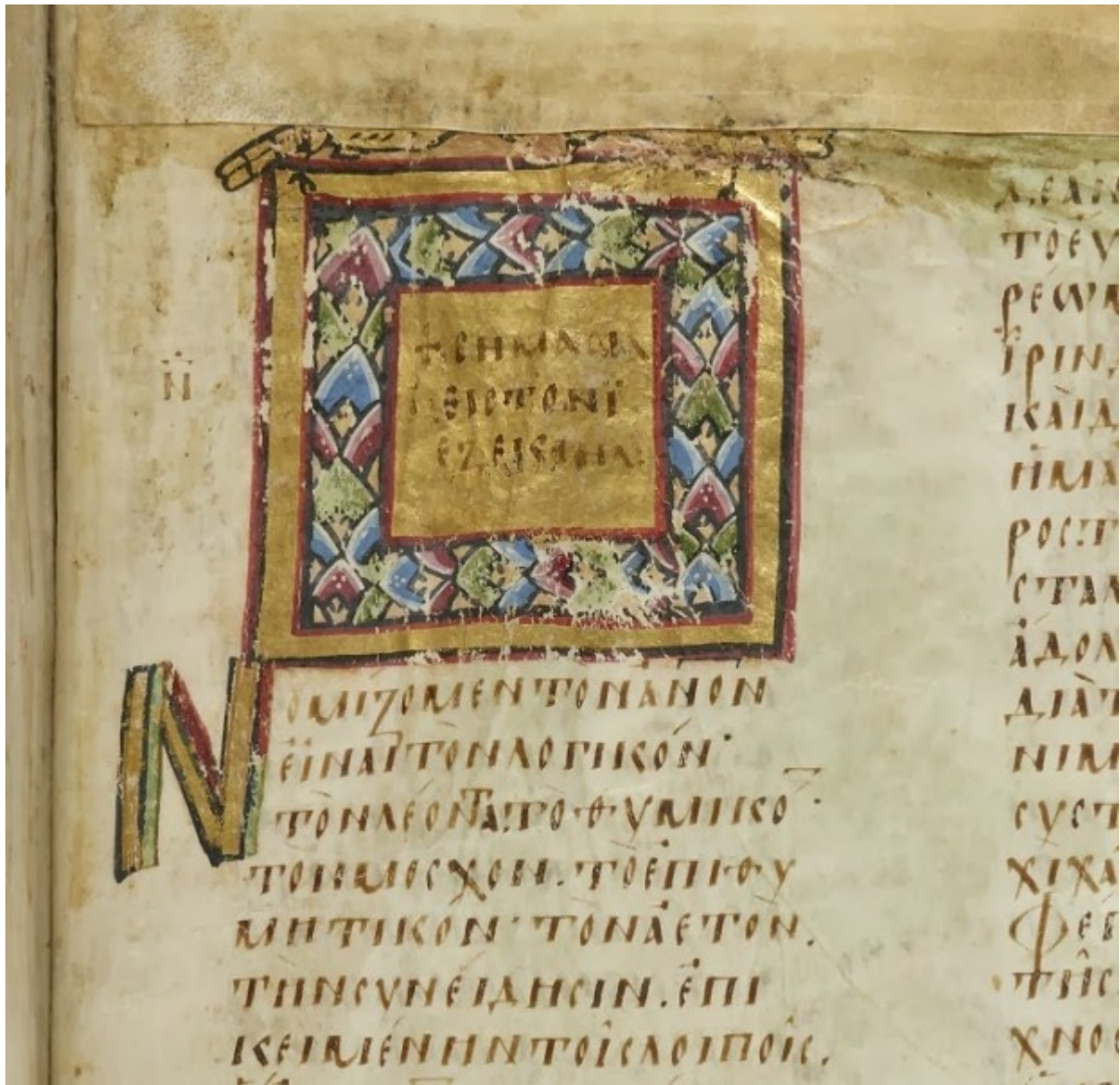
Επίχρυσο τετράγωνο διακοσμητικό κόσμημα κατά το πλάτος μιας στήλης που φέρει στο κέντρο του τον τίτλο της ομιλίας: + Κατά Ιουλιανού στηλιτευτικός α'. Επίχρυσα διακοσμητικά αρχικά γράμματα (στη φωτογραφία φαίνονται δύο Α). Κεφαλαιογράμματα γραφή σε δύο στήλες.