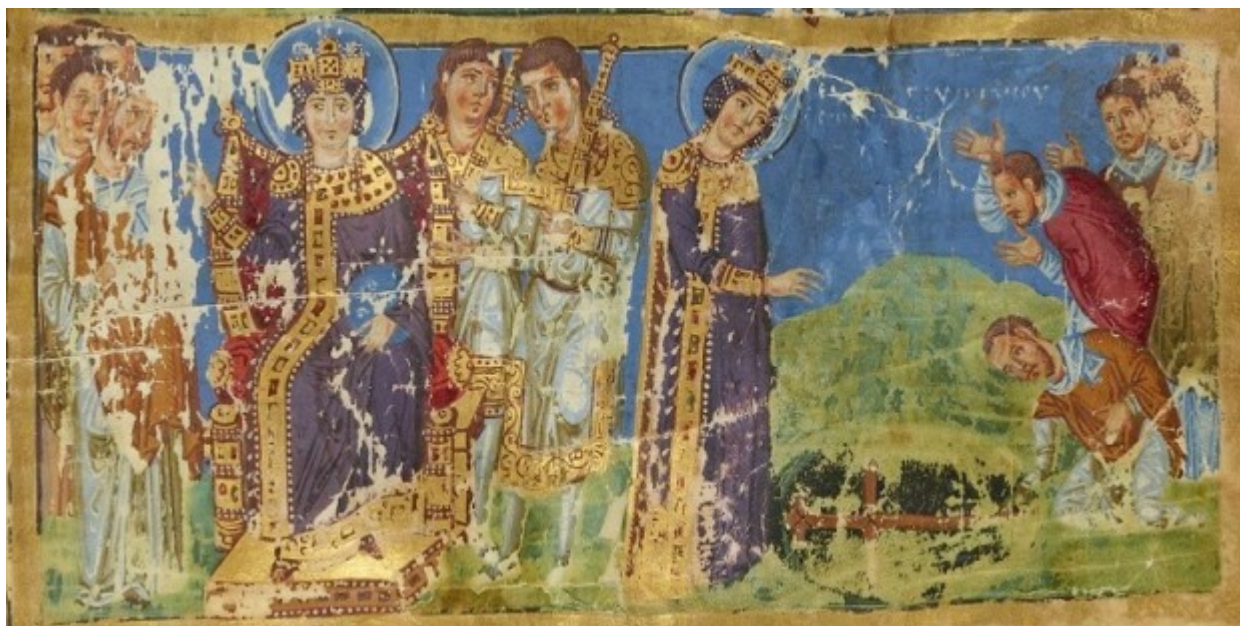
Η εύρεση του Τιμίου Σταυρού από την Αγία Ελένη.

Το πέρασμα του χρόνου έχει φέρει σημαντική φθορά στο χειρόγραφο BNF MS gr. 510. Περιέχει 46 ολοσέλιδες μικρογραφίες, καθώς και ωραιότατα επίτιτλα και πολλά διακοσμητικά αρχικά γράμματα, πολλά εκ των οποίων επίχρυσα. Περιέχει επίσης περισσότερες από 200 εικόνες από την ζωή της αυτοκρατορικής οικογένειας, του Γρηγορίου Ναζιανζηνού, πολλών Αγίων και Μαρτύρων.