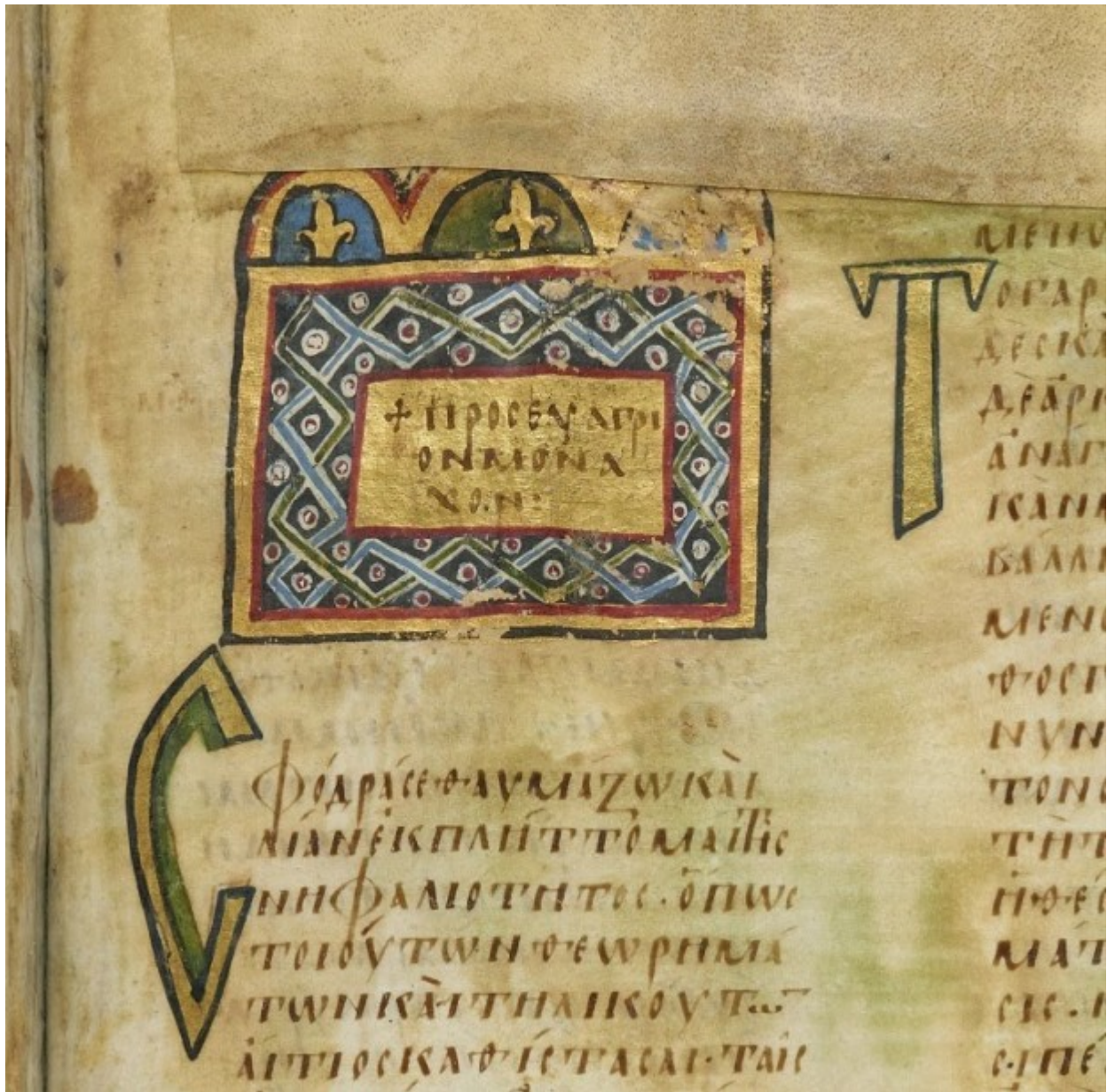
χρυσό τετράγωνο διακοσμητικό κόσμημα με την επιγραφή: + Προς Ευάγγριον μοναχόν. Διακοσμητικά αρχικά γράμματα (Σ και Τ).