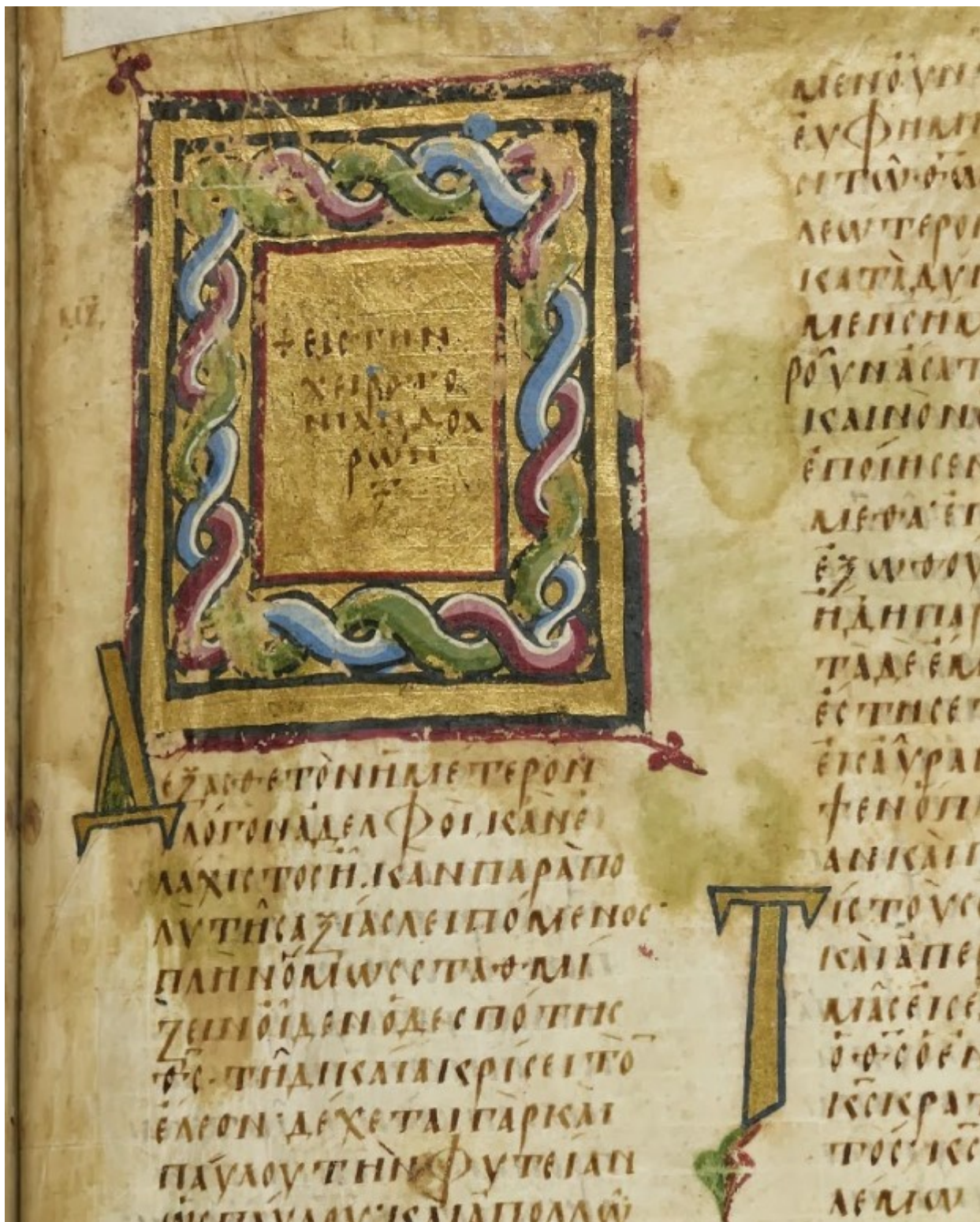
Επίχρσο τετράγωνο διακοσμητικό κόσμημα κατά το πλάτος μιας στήλης που φέρει στο κέντρο του τον τίτλο της ομιλίας: + Εις την χειροτονίαν Δοαρών. Διακοσμητικά αρχικά γράμματα (Δ και Τ).