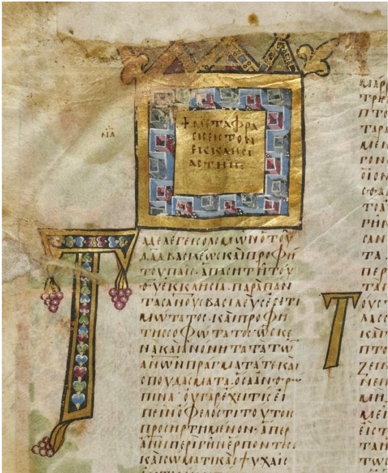
Επίχρυσο τετράγωνο διακοσμητικό κόσμημα με την επιγραφή: + Μετάφρασις εις τον Εκκλησιαστην. Διακοσμητικά αρχικά γράμματα (δύο T).