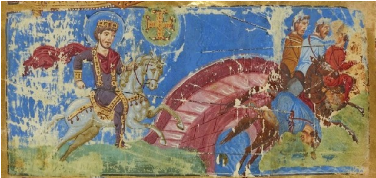
Ο Μέγας Κωνσταντίνος και η μάχη της Μιλβίας γέφυρας.

/ Επιστήμες, Τέχνες & Πολιτισμός / Ορθόδοξη πίστη