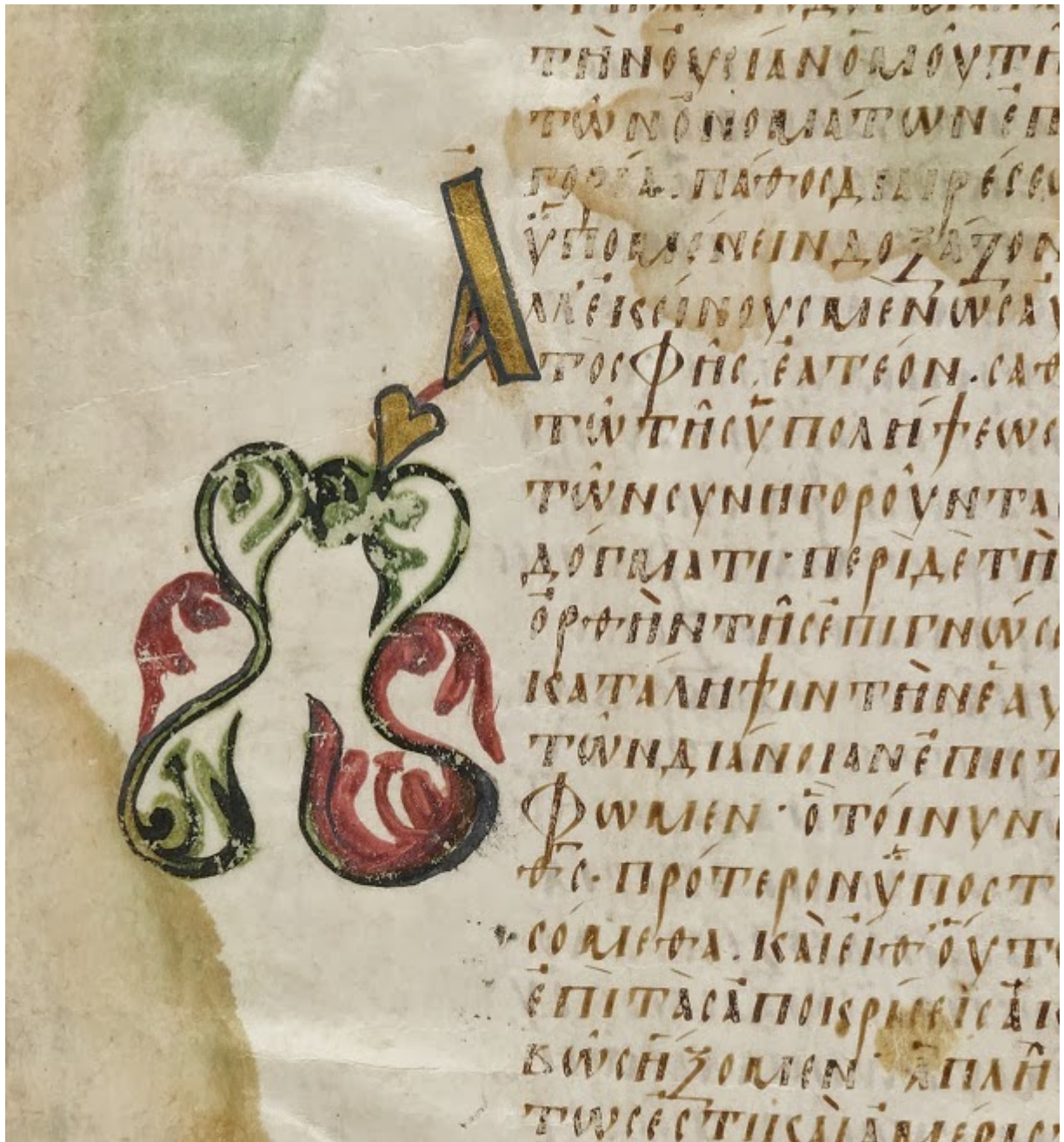
Διακοσμητικό αρχικό γράμμα με φυτική διακοσμητική απόληξη (Α).