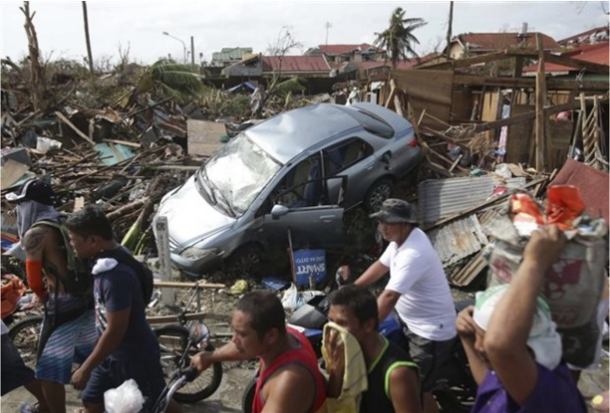
Οι Αρχές των Φιλιππίνων κάνουν πλέον λόγο για τουλάχιστον 10.000 νεκρούς και χαρακτηρίζουν τον τυφώνα Χαϊγιάν ως τη φονικότερη φυσική καταστροφή στην πρόσφατη ιστορία της χώρας. ( Πηγή: AP Photo/Aaron Favila)-tovima.gr