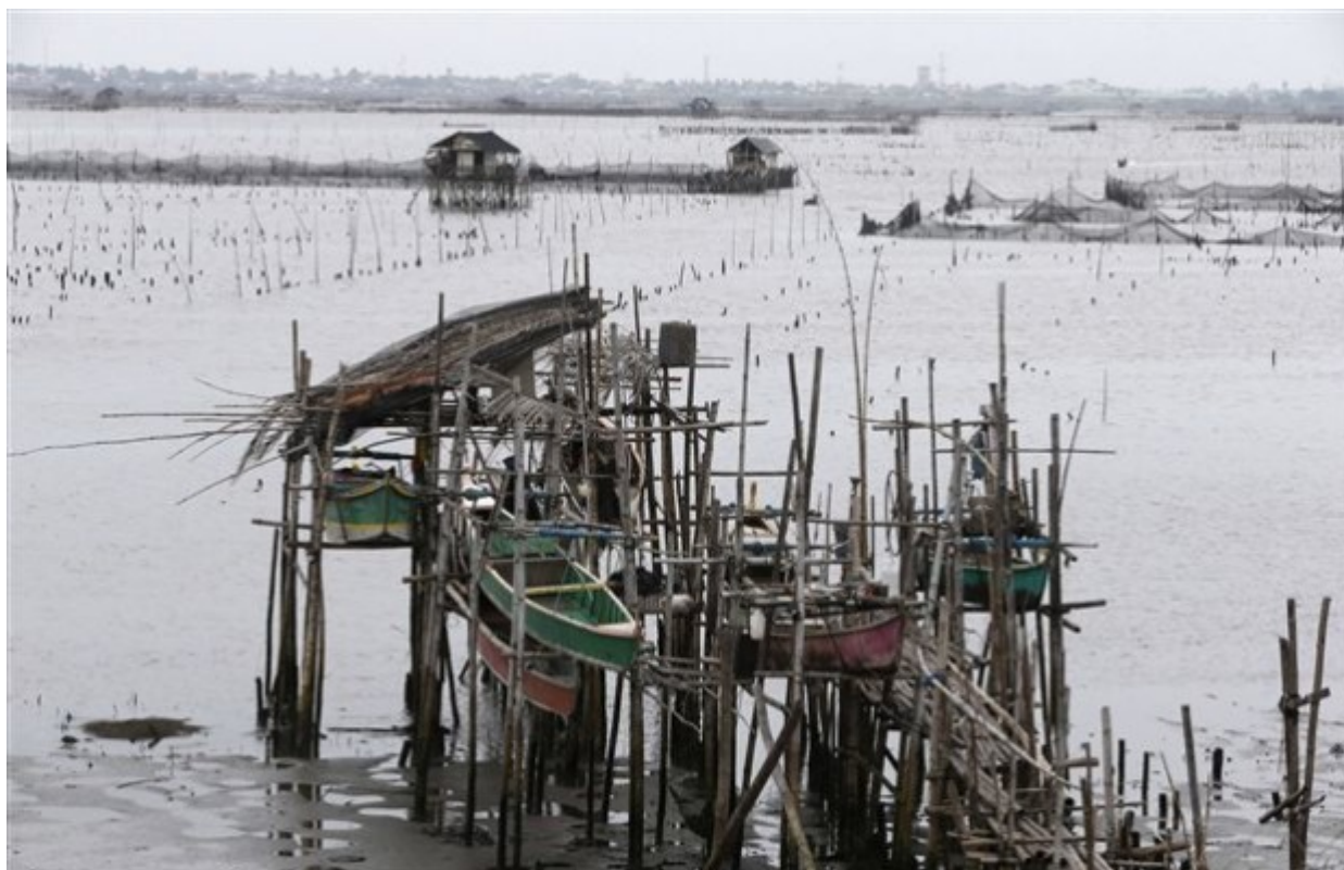
Οι φαράδες λιμανιού κοντά στη Μανίλα, εξασφάλισαν απάγκιο για τις μικρές τους βάρκες εν αναμονή του τυφώνα που θεωρείται ο πιο ισχυρός που πλήττει ξηρά

Ο Χαϊγιάν που στο πέρασμα του συνοδευόταν από ριπές ανέμων με ταχύτητα περίπου 275 χιλιόμετρα την ώρα, προκάλεσε επίσης τεράστια κύματα 5 έως 6 μέτρα ύψους που απέβησαν καταστροφικά.