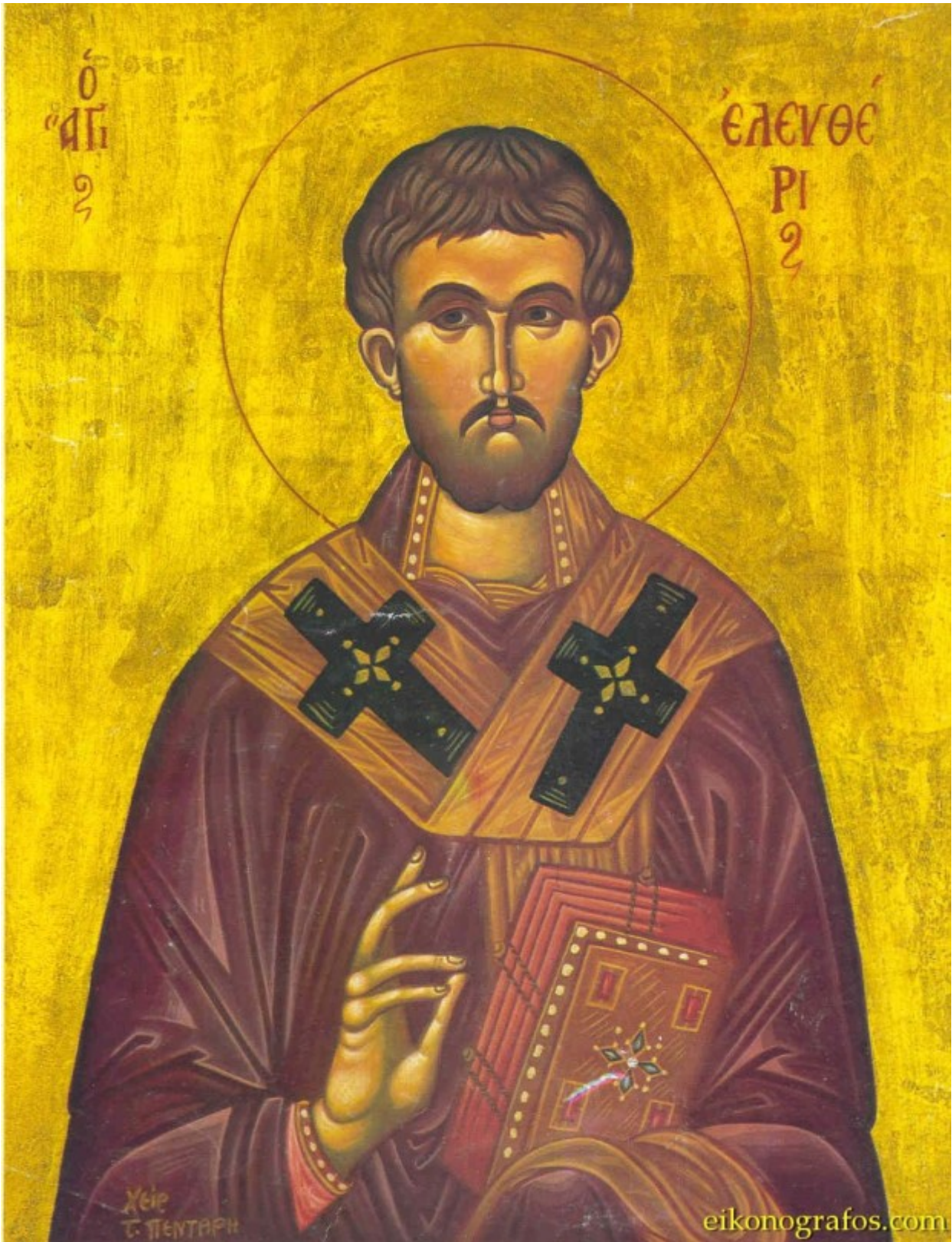
Άγιος Ελευθέριος ο Ιερομάρτυρας