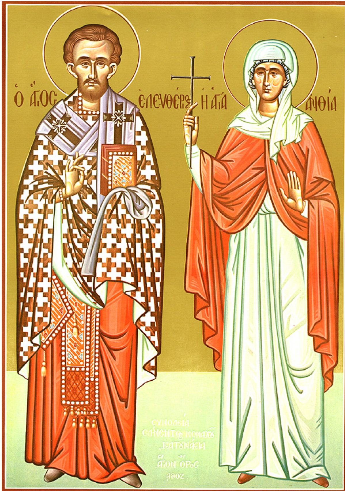
Ο Άγιος Ελευθέριος με την μητέρα του Αγία Ανθία