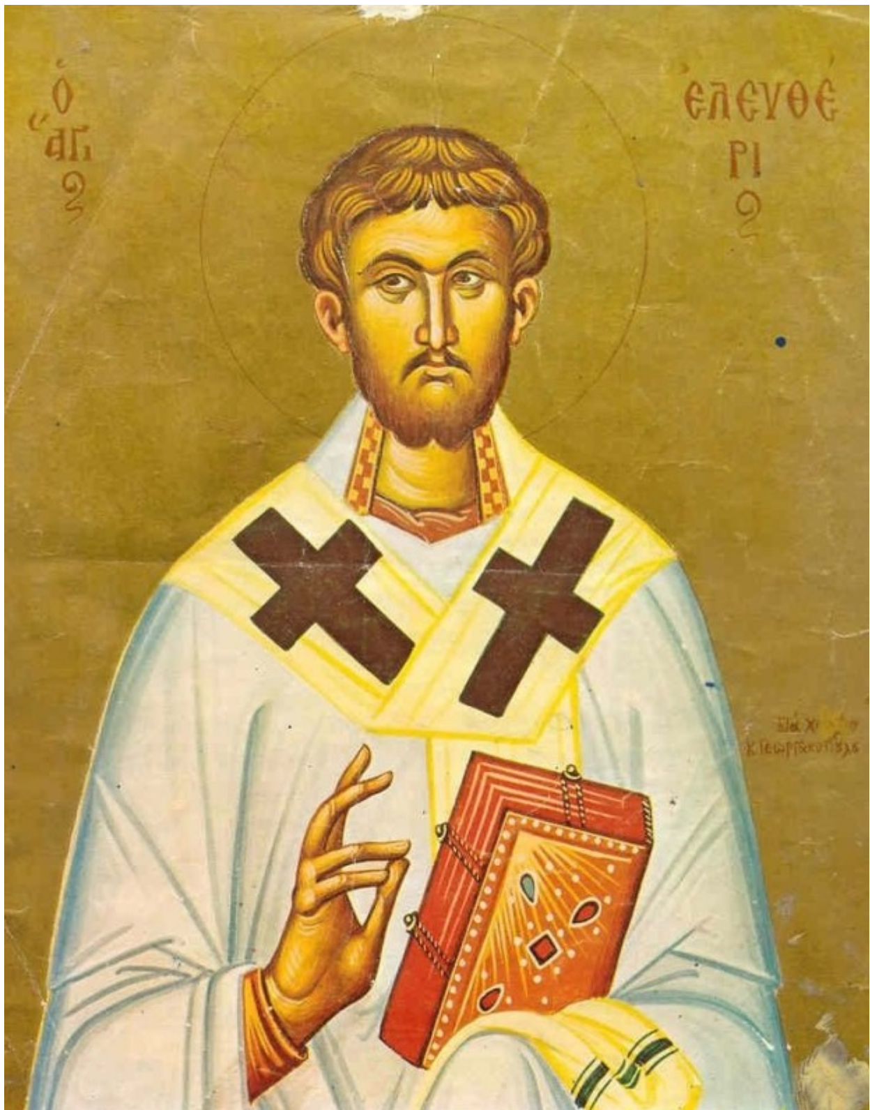
Άγιος Ελευθέριος ο Ιερομάρτυρας