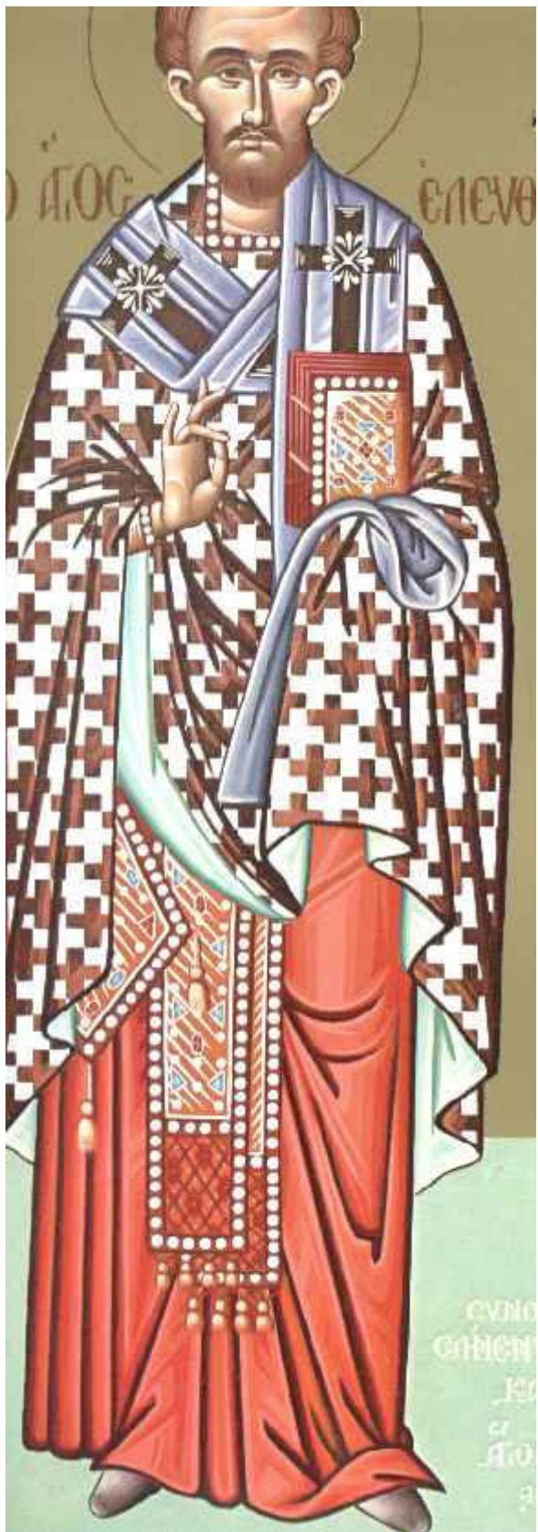
Άγιος Ελευθέριος ο Ιερομάρτυρας