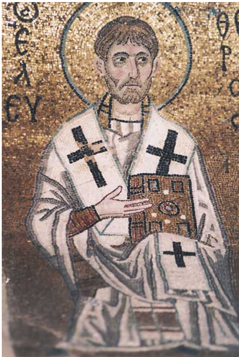
Άγιος Ελευθέριος ο Ιερομάρτυρας