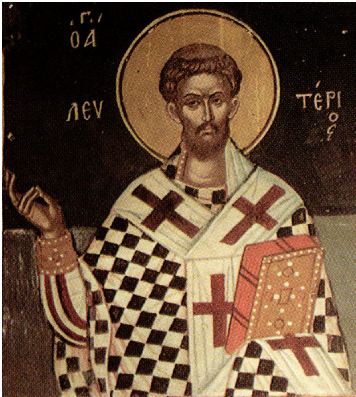
Άγιος Ελευθέριος ο Ιερομάρτυρας