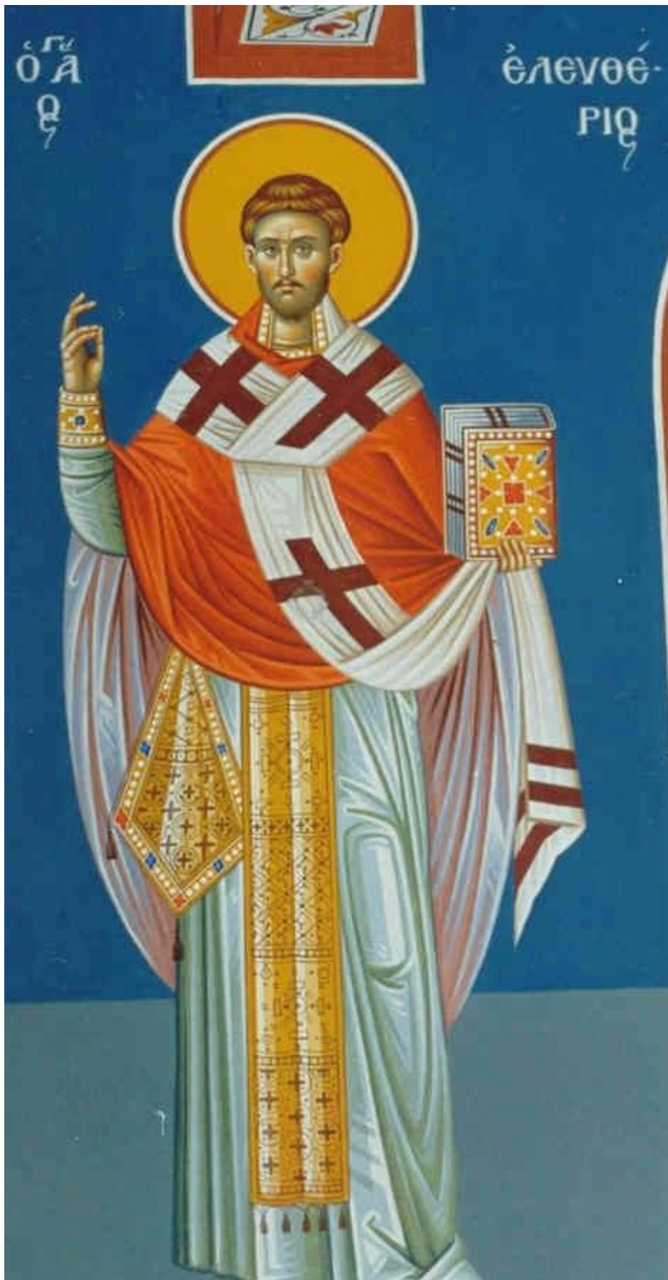
Άγιος Ελευθέριος ο Ιερομάρτυρας