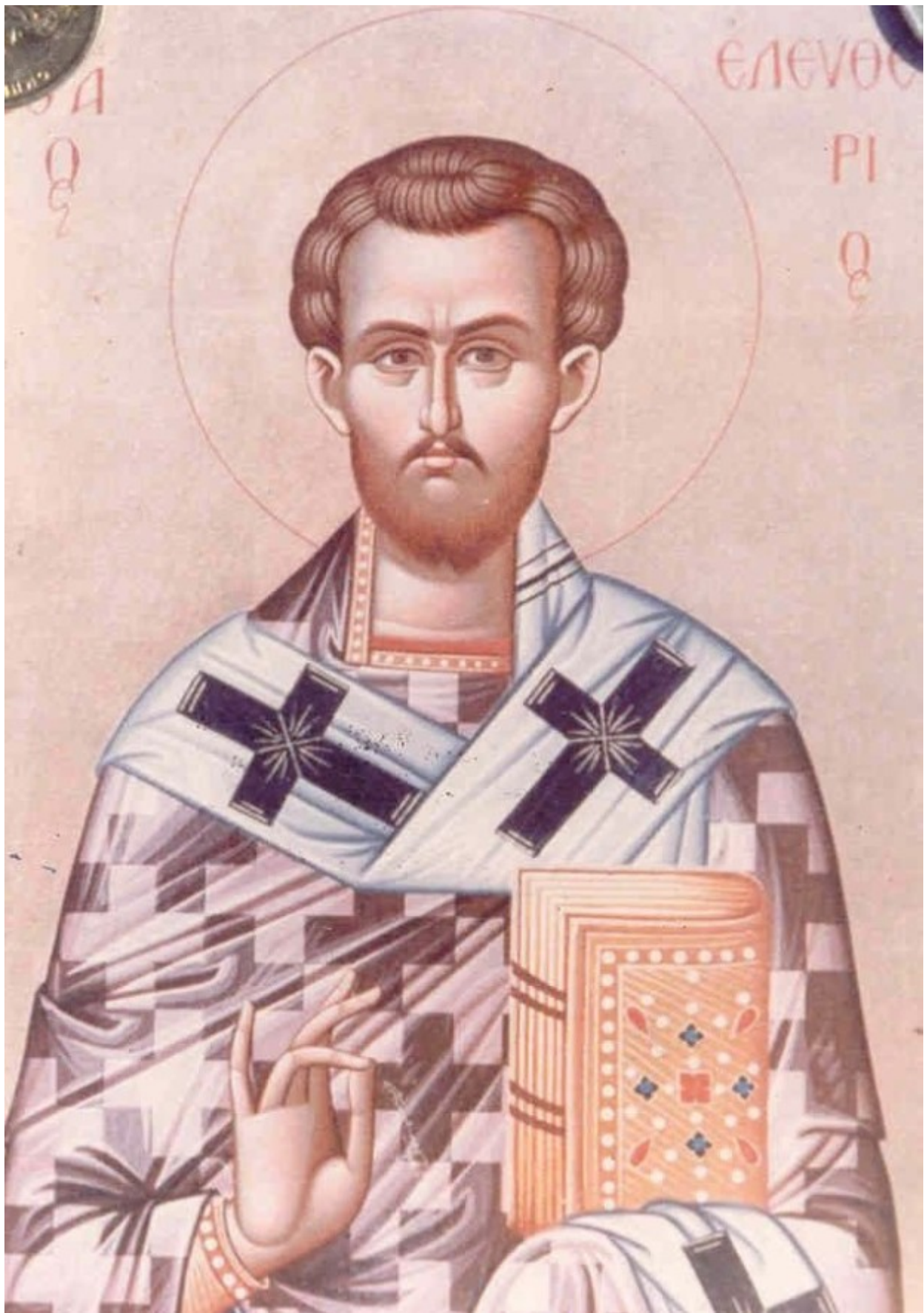
Άγιος Ελευθέριος ο Ιερομάρτυρας