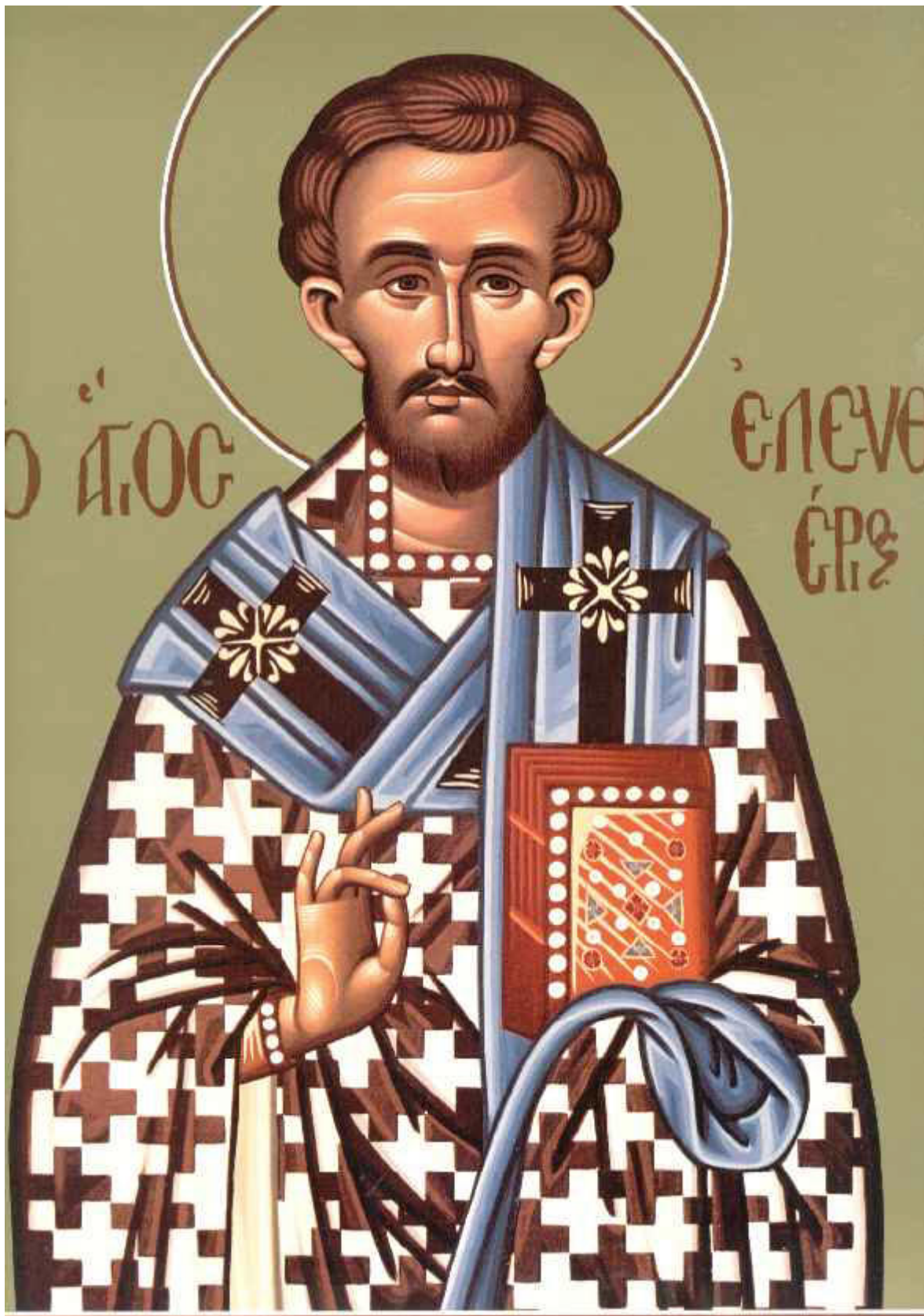
Άγιος Ελευθέριος ο Ιερομάρτυρας