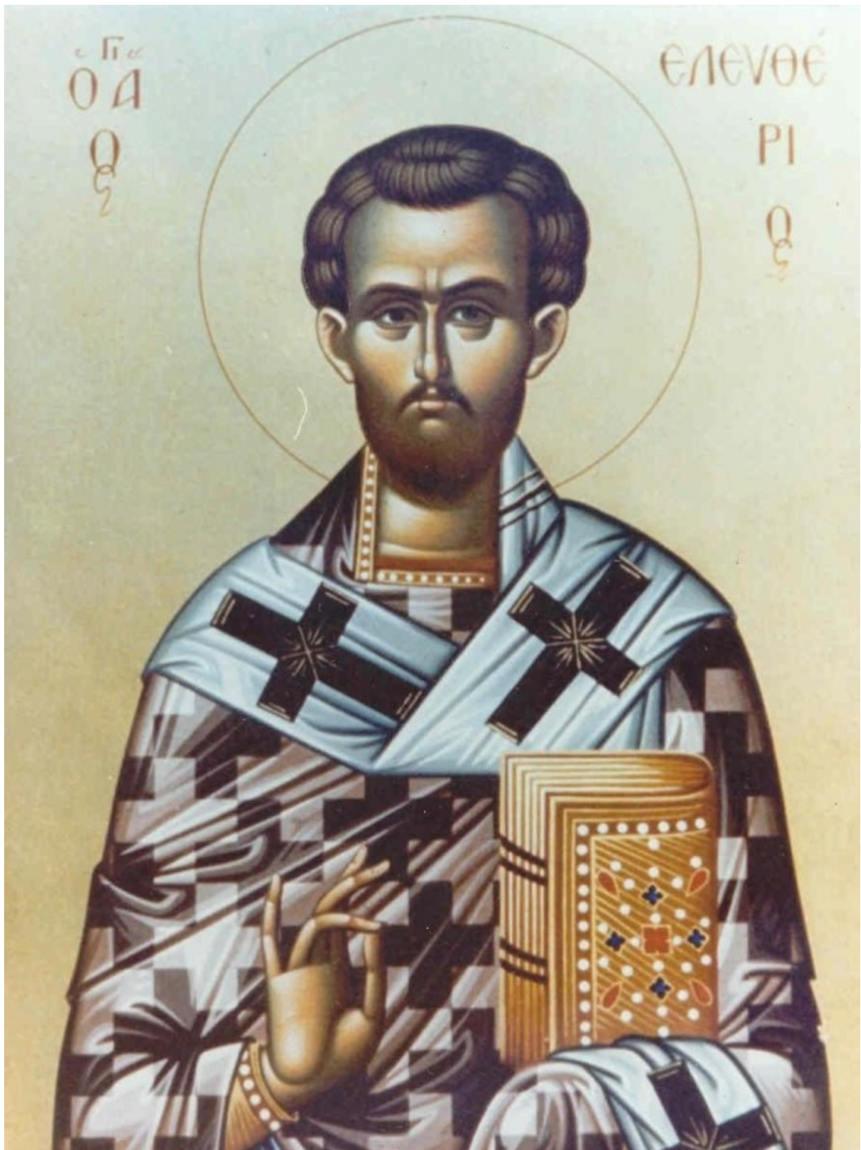
Άγιος Ελευθέριος ο Ιερομάρτυρας