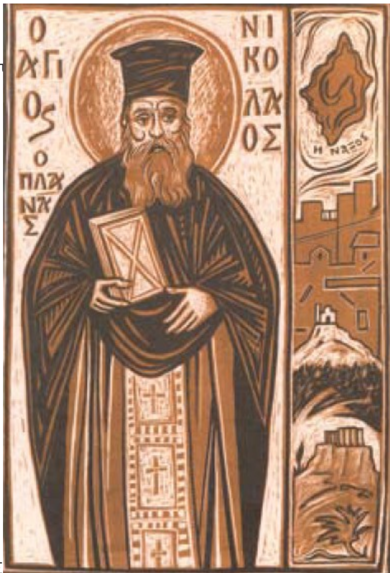
Ο ΑΓΙΟΣ ΝΙΚΟΛΑΟΣ ΠΛΑΝΑΣ

Ο Νικόλαος γεννήθηκε το 1851 στη Νάξο, διδάχτηκε τα πρώτα γράμματα από τον ιερέα παππού του, τον οποίο και συνόδευε στις Λειτουργίες και τους Εσπερινούς, βοηθώντας τον στο Ιερό και το ψαλτήρι.