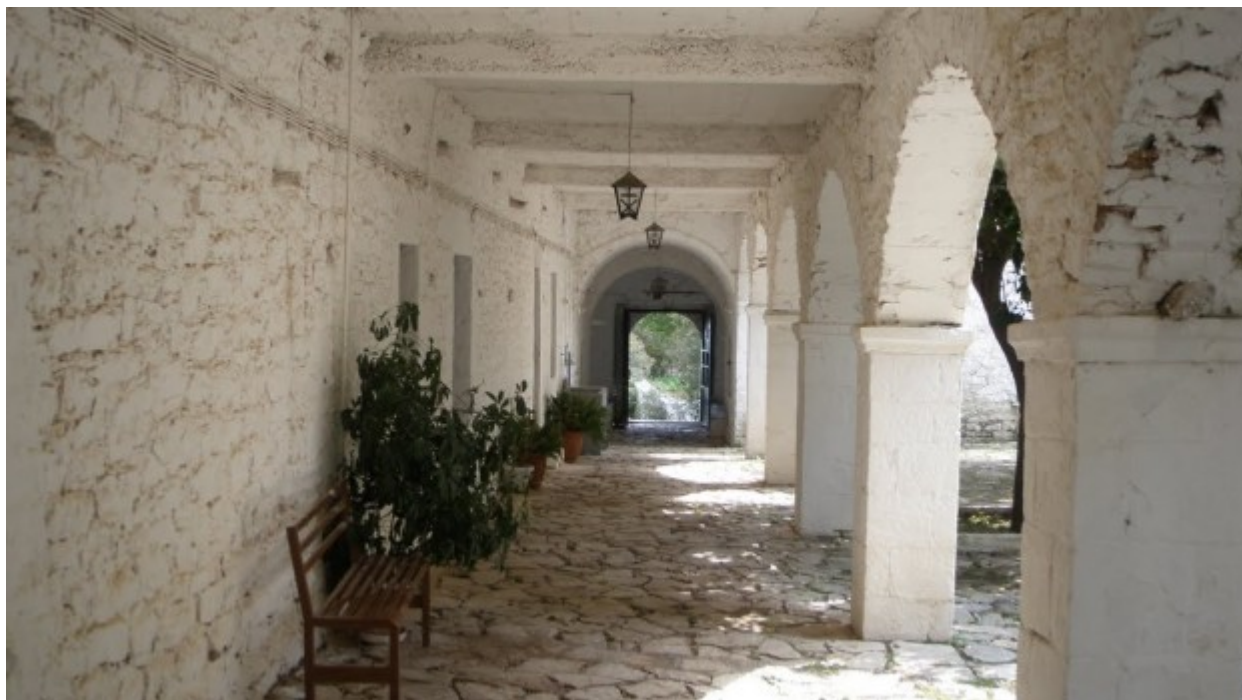
Παναγία του Βουλκάνου