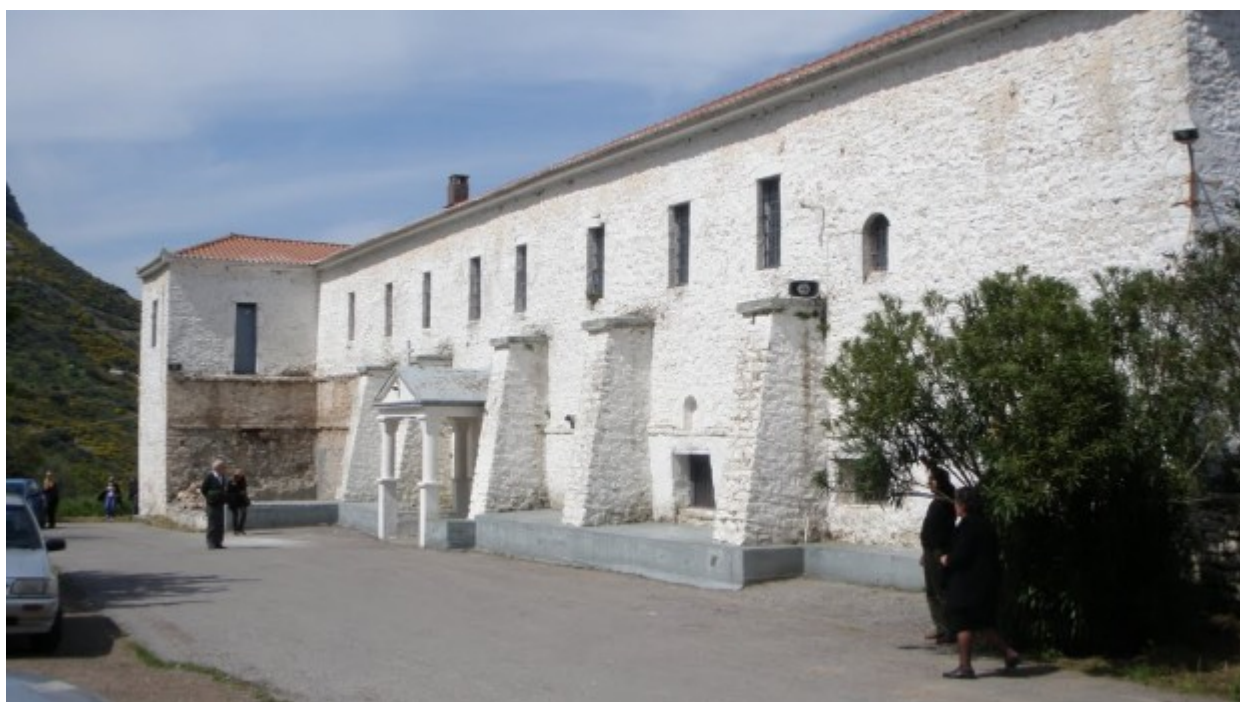
Παναγία του Βουλκάνου