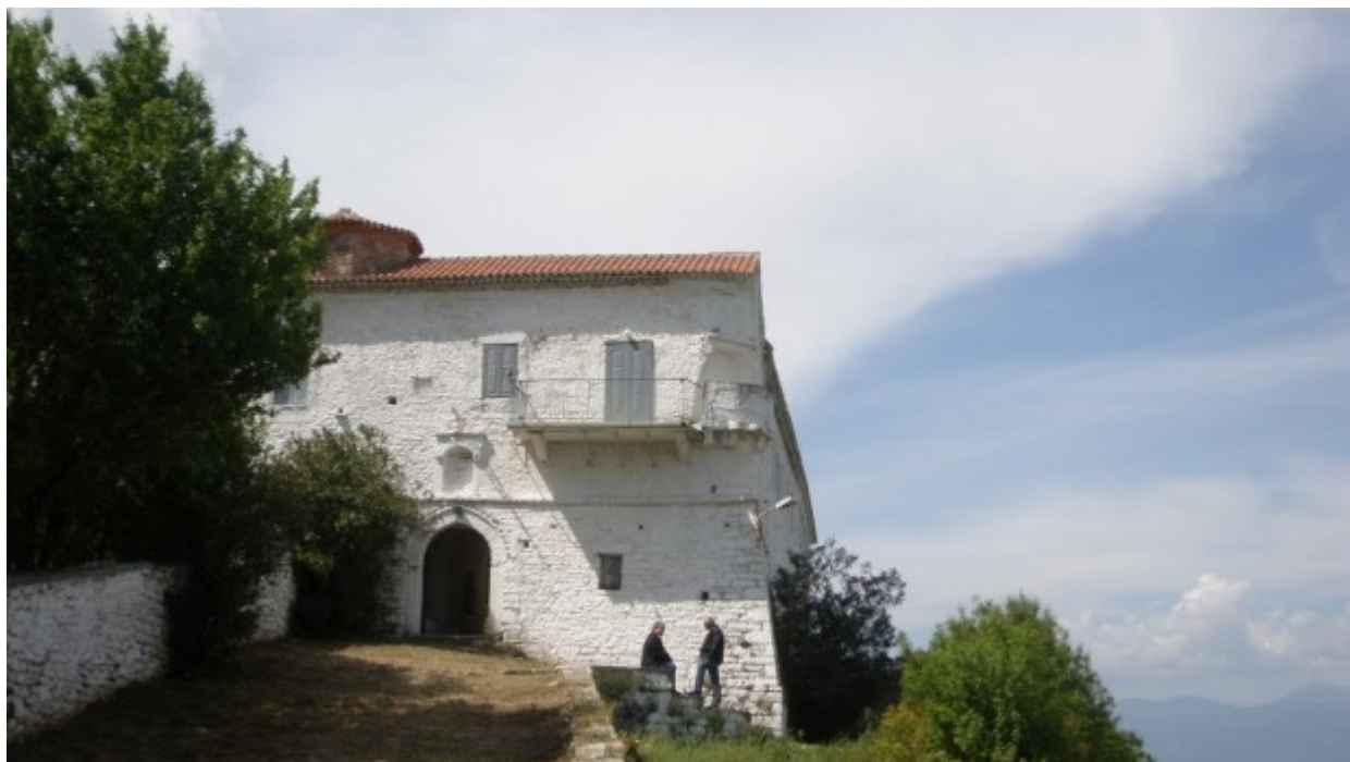
Παναγία του Βουλκάνου