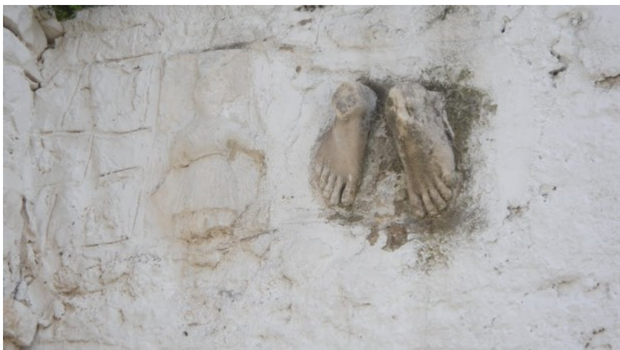
Παναγία του Βουλκάνου