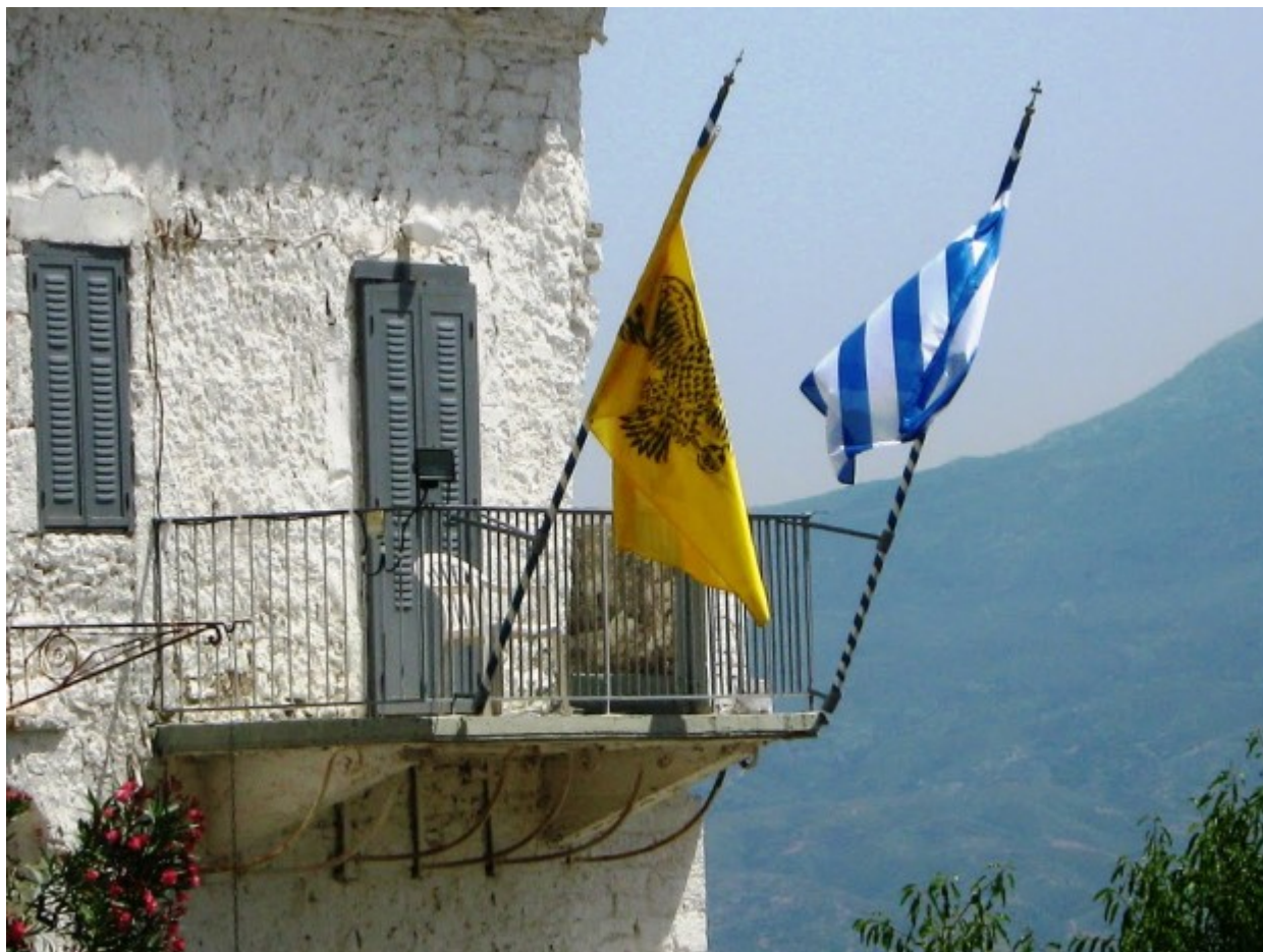
Παναγία του Βουλκάνου

Όσον αφορά στο τυπικό που ακολουθείται στη γιορτή της Γέννησης της Θεοτόκου, αυτό συμπεριλαμβάνει την κάθοδο της εικόνας στην πόλη της Μεσσήνης τη νύκτα της 19ης προς την 20η Σεπτεμβρίου προς ανάμνηση της θαυματουργής επέμβασης της Παναγίας όταν, το 1755, εξαπλώθηκε επιδημία πανούκλας που σκόρπισε το θάνατο στην περιοχή. Η κάθοδος ξεκινά περίπου στις 2 το πρωί από το Βουλκάνο και καταλήγει, μετά από πεζοπορία 20 χλμ, στη «Μαυροματέικη Παναγίτσα», στις 7:30 το πρωί.