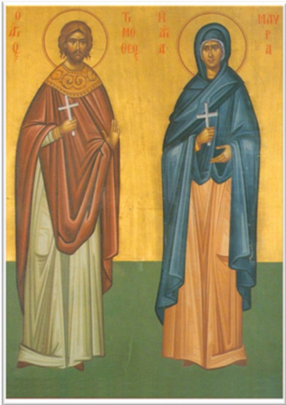
Ἅγιοι Τιμόθεος καὶ Μαύρα