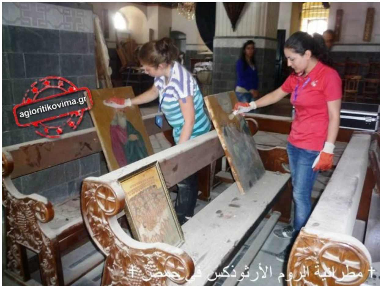
ΤΑ ΤΡΑΥΜΑΤΑ ΤΩΝ ΑΓΙΩΝ ΕΙΚΟΝΩΝ ΘΕΡΑΠΕΥΟΝΤΑΙ ΑΠΟ ΤΟΥΣ ΝΕΟΥΣ ΤΗΣ ΕΚΚΛΗΣΙΑΣ