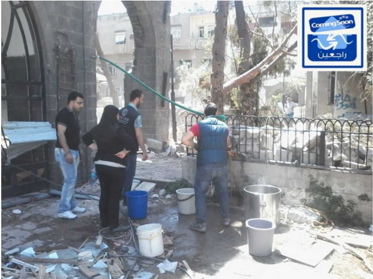
ΤΟ ΧΟΜΣ ΞΑΝΑΒΡΙΣΚΕΙ ΣΙΓΑ ΣΙΓΑ ΤΟΝ ΡΥΘΜΟ ΤΟΥ.