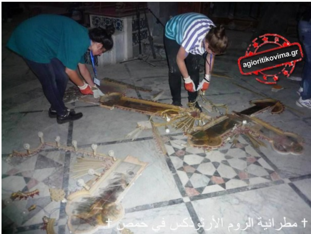
Η ΟΡΘΟΔΟΞΗ ΝΕΟΛΑΙΑ ΔΟΥΛΕΥΕΙ ΠΥΡΕΤΩΔΩΣ ΓΙΑ ΤΗΝ ΑΠΟΚΑΤΑΣΤΑΣΗ ΤΩΝ ΚΑΤΑΣΤΡΟΦΩΝ ΣΤΗΝ ΜΗΤΡΟΠΟΛΗ ΤΩΝ ΑΓΙΩΝ ΤΕΣΣΑΡΑΚΟΝΤΑ