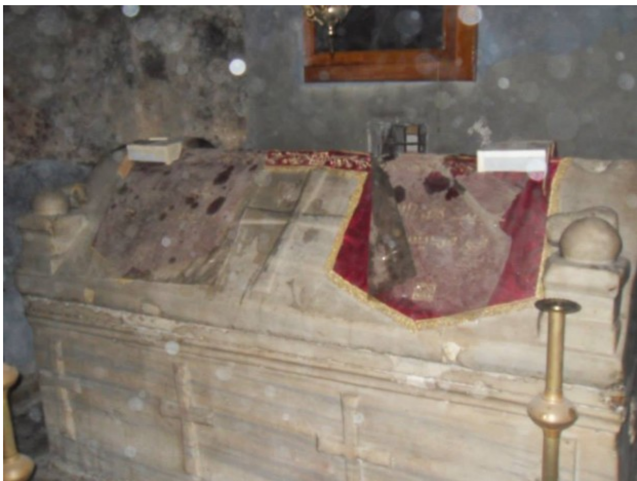
Ο ΠΑΝΑΡΧΑΙΟΣ ΤΑΦΟΣ ΤΟΥ ΑΓΙΟΥ ΙΟΥΛΙΑΝΟΥ, ΕΝΑ ΑΠΟ ΤΑ ΣΗΜΑΝΤΙΚΟΤΕΡΑ ΠΡΟΣΚΥΝΗΜΑΤΑ ΤΗΣ