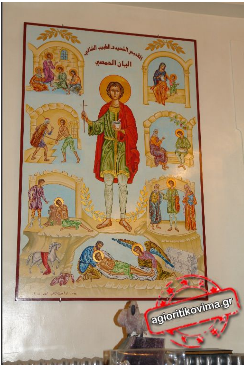
Ο ΑΓΙΟΣ ΜΑΡΤΥΣ ΙΟΥΛΙΑΝΟΣ, ΠΡΟΣΤΑΤΗΣ ΤΟΥ ΧΟΜΣ.