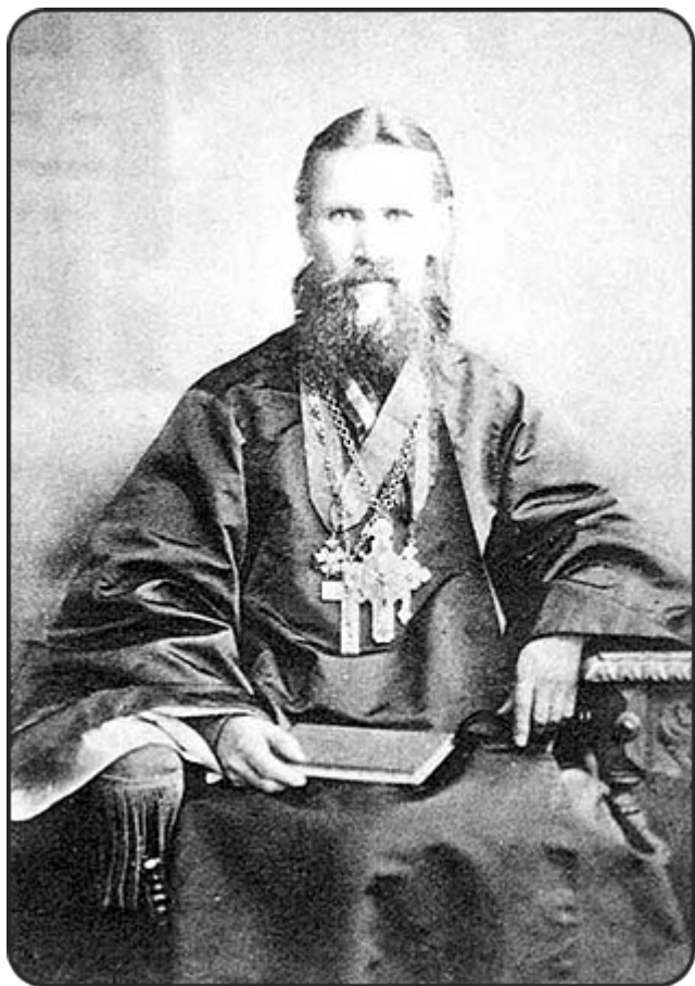
Άγιος Ιωάννης Κροσάνδης