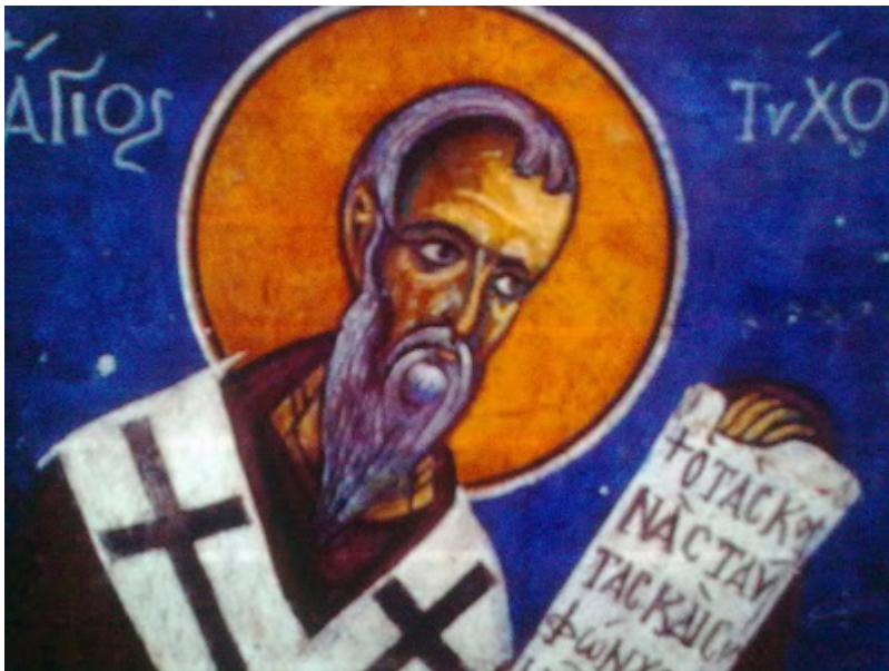
Άγιος Τύχων. Τοιχογραφία του ναού της Παναγίας του Αρακός.

The memory of Saint Tychon is celebrated together with that of Saint Mnemonios on June 16.