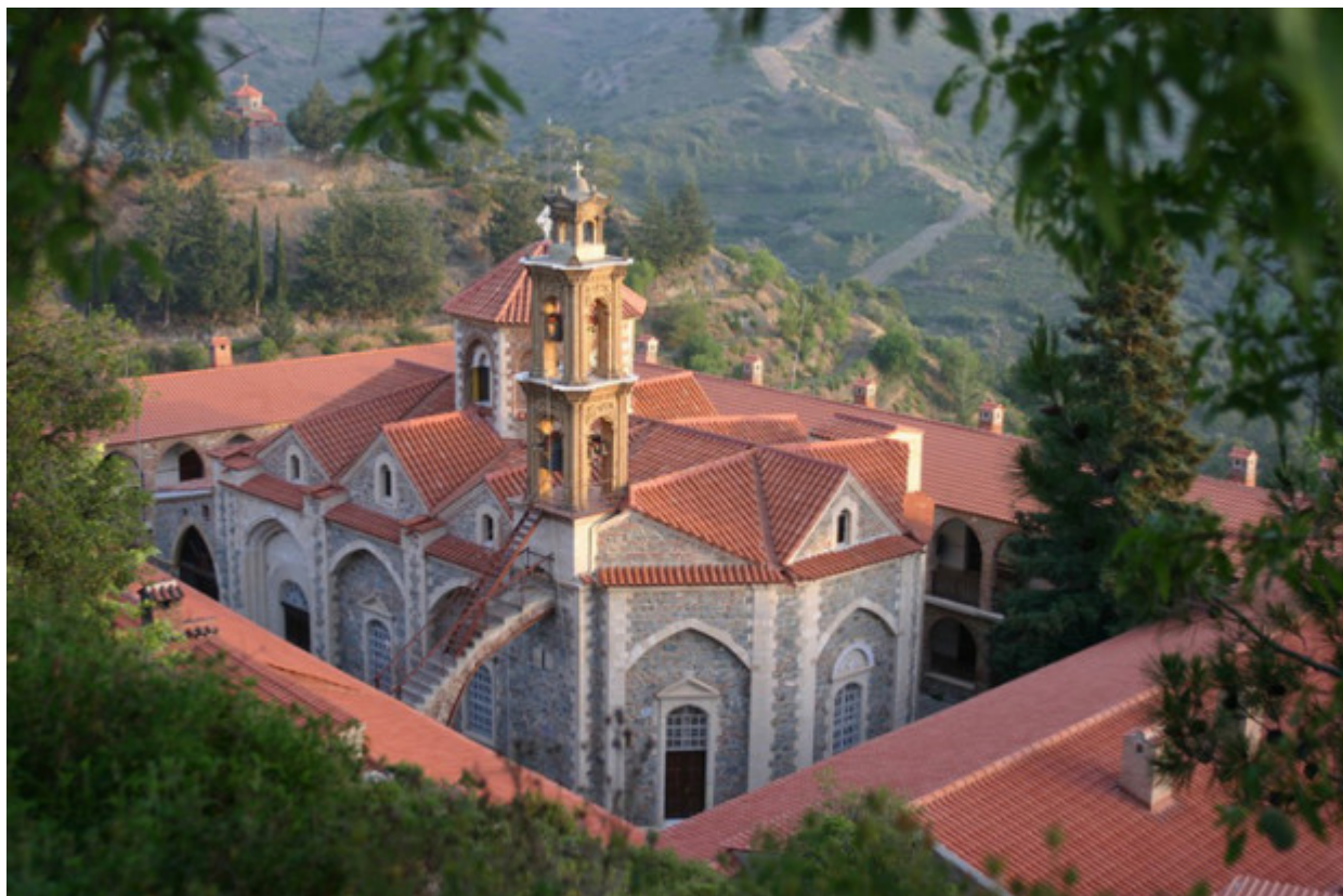
Ιερά Μονή Παναγίας Μαχαιρά