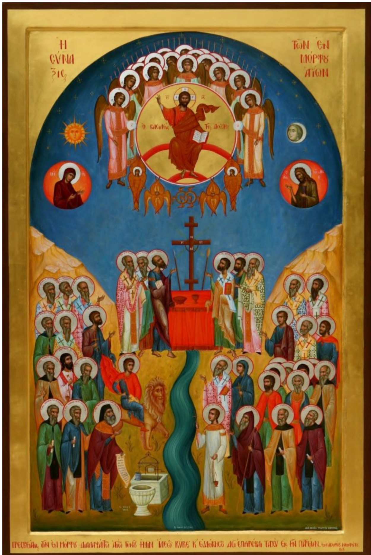
Η σύναξη των εν Μόρφου Αγίων, χειρ Γεωργίου Σταυρινού, 2012, Ιερά Μητρόπολις Μόρφου