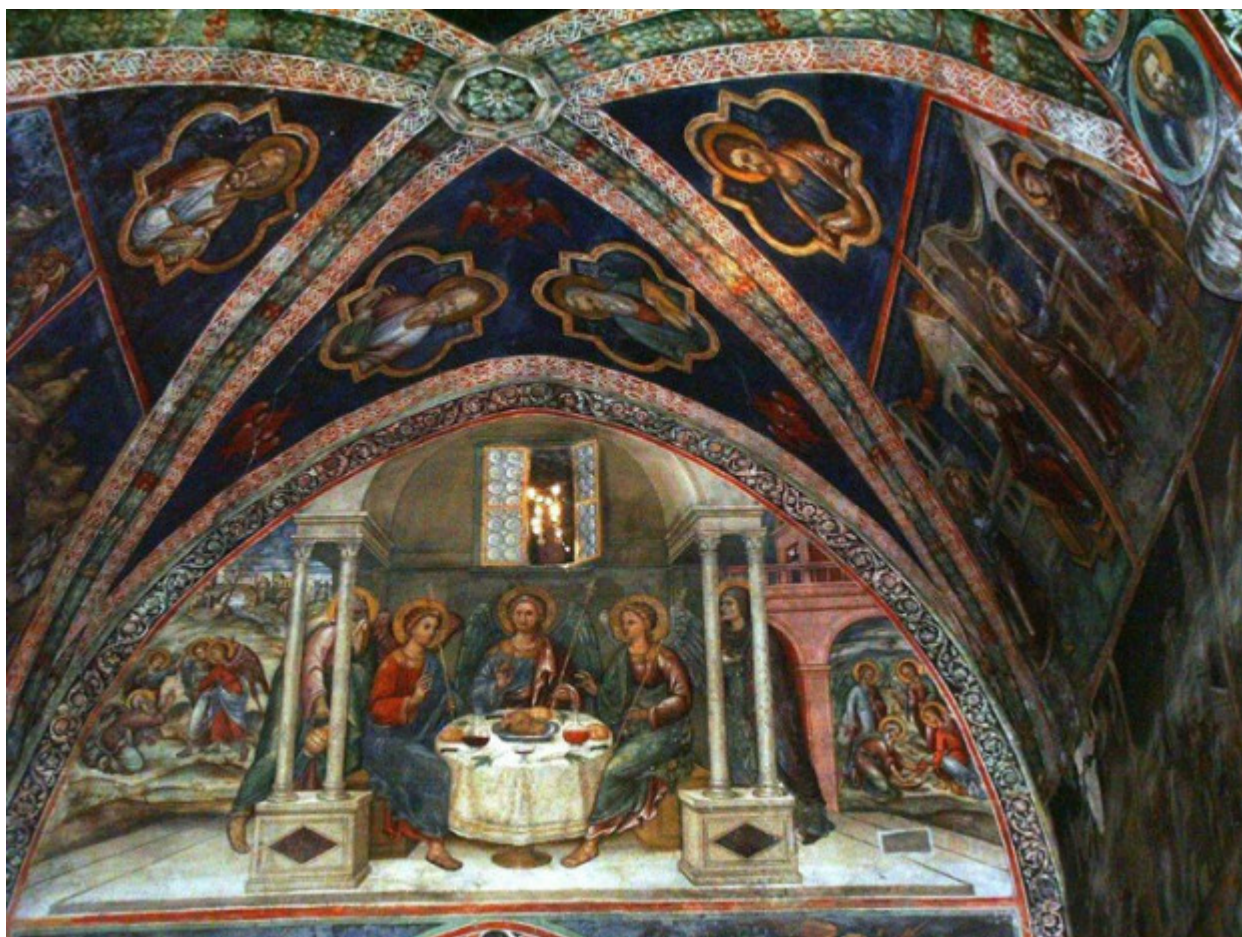
Η φιλοξενία του Αβραάμ, Ιερά Μονή Οσίου Ιωάννου του Λαμπαδιστή, Καλοπαναγιώτης