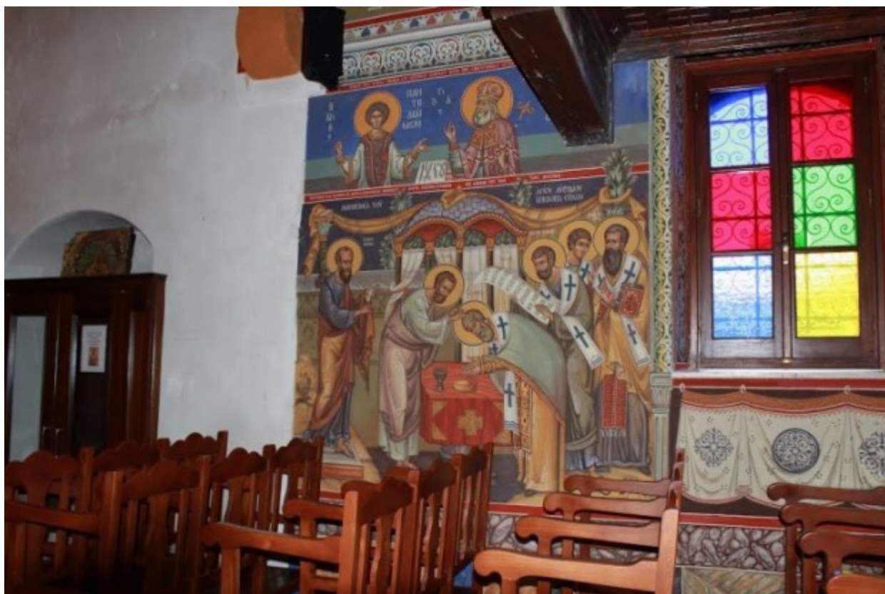
Η χειροτονία του Αγίου Αυξιβίου, Ιερός Ναός Αγίων Κυπριανού και Ιουστίνης, Μένικο