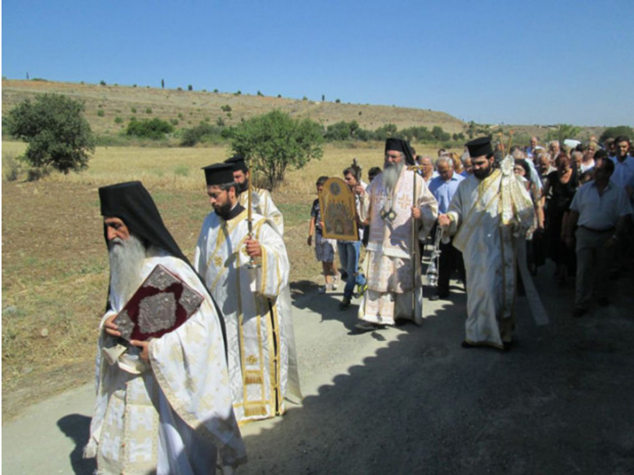
Εορτή Αγίου Πνεύματος, Ιερά Μονή Αγίου Νικολάου παρά την Ορούντα

Ορθοδοξία και Ορθοπραξία / Ορθόδοξη πίστη