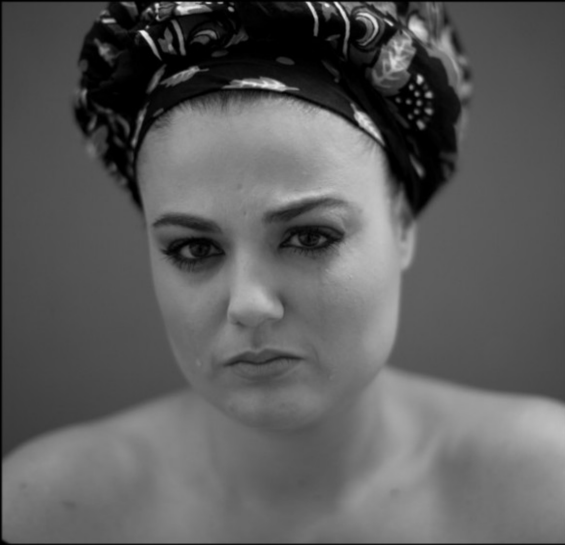
Sadahzinia - singer, writer