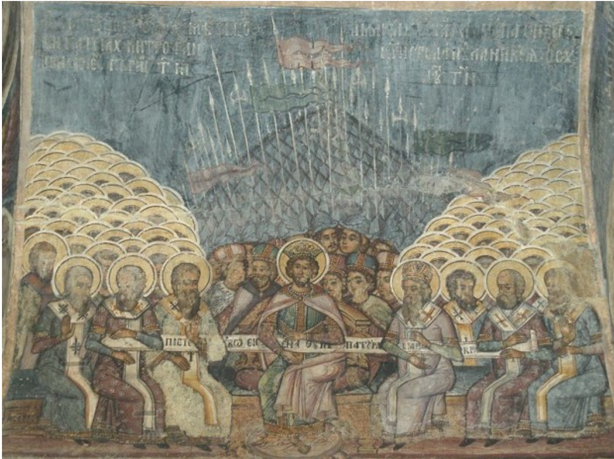
Η Πρώτη Σύνοδος της Νίκαιας, τοιχογραφία του 18ου αιώνα στον Ορθόδοξο Ναό Σταυροπόλεως στο Βουκουρέστι

Οι Οικουμενικοί Πατριάρχες που αποδείχτηκαν άξιοι της μεγάλης τους αποστολής με το ένα χέρι έβαναν την υπογραφή τους