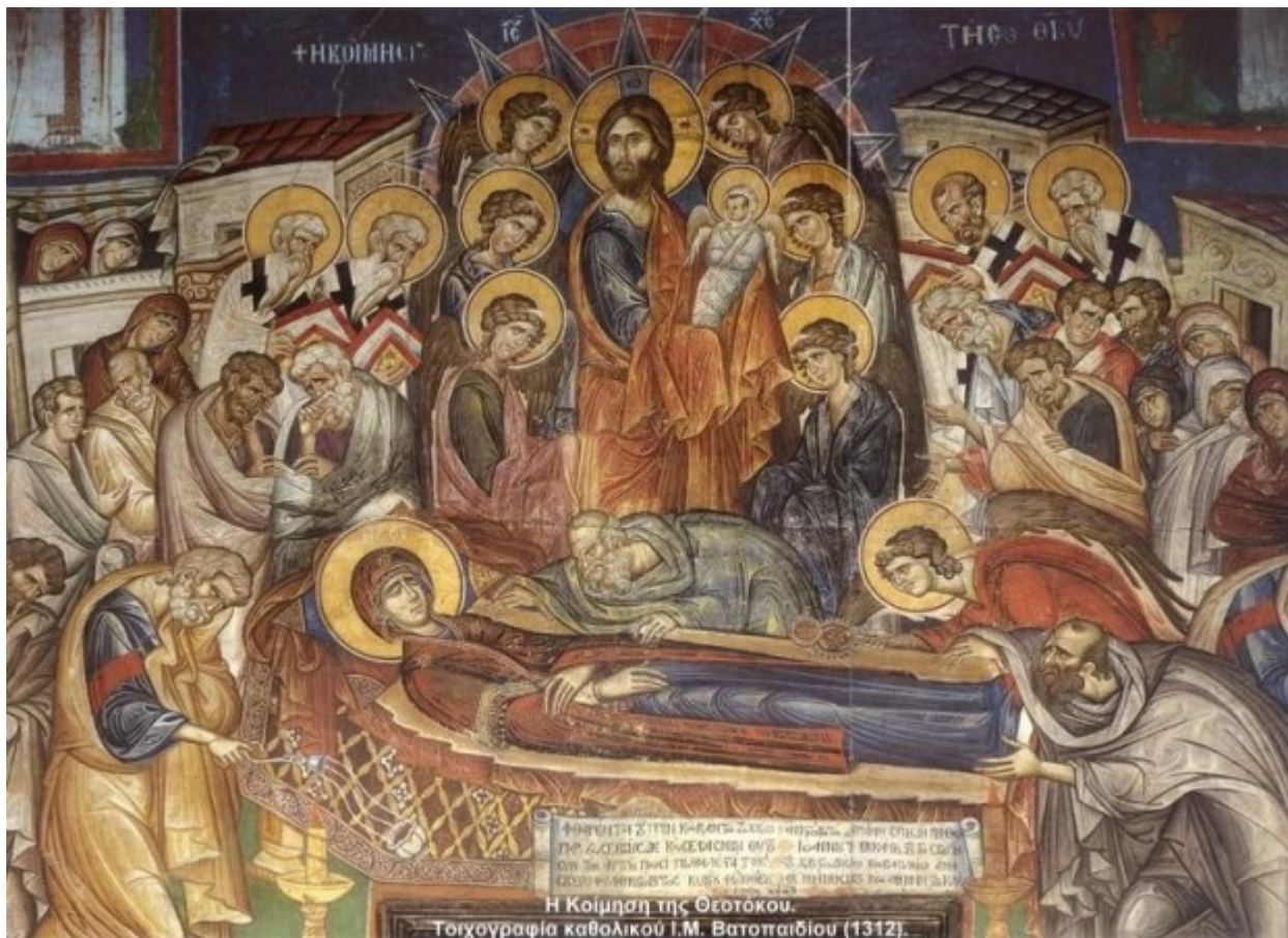
Η τίμια ζώνη στο Καθολικό της Ιεράς Μονής Βατοπαιδίου

Η ανακομιδή της Τιμίας Ζώνης και η μεταφορά της στην Κωνσταντινούπολη, έγινε από τον αυτοκράτορα Αρκάδιο (395-408). Η υποδοχή της στη Βασιλεύουσα ήταν λαμπρότατη. Ο αυτοκράτορας κατέθεσε την Τιμία Ζώνη της Θεοτόκου σε λειψανοθήκη που ονόμασε «αγίαν σορόν». Η κατάθεση έγινε στις 31 Αυγούστου, τελευταία μέρα του εκκλησιαστικού έτους. Στην πόλη του Αγίου Κωνσταντίνου, της οποίας Υπέρμαχος Στρατηγός και Προστάτης ήταν η Θεοτόκος, θα φυλασσόταν πλέον η Αγία Ζώνη της Θεομήτορος.