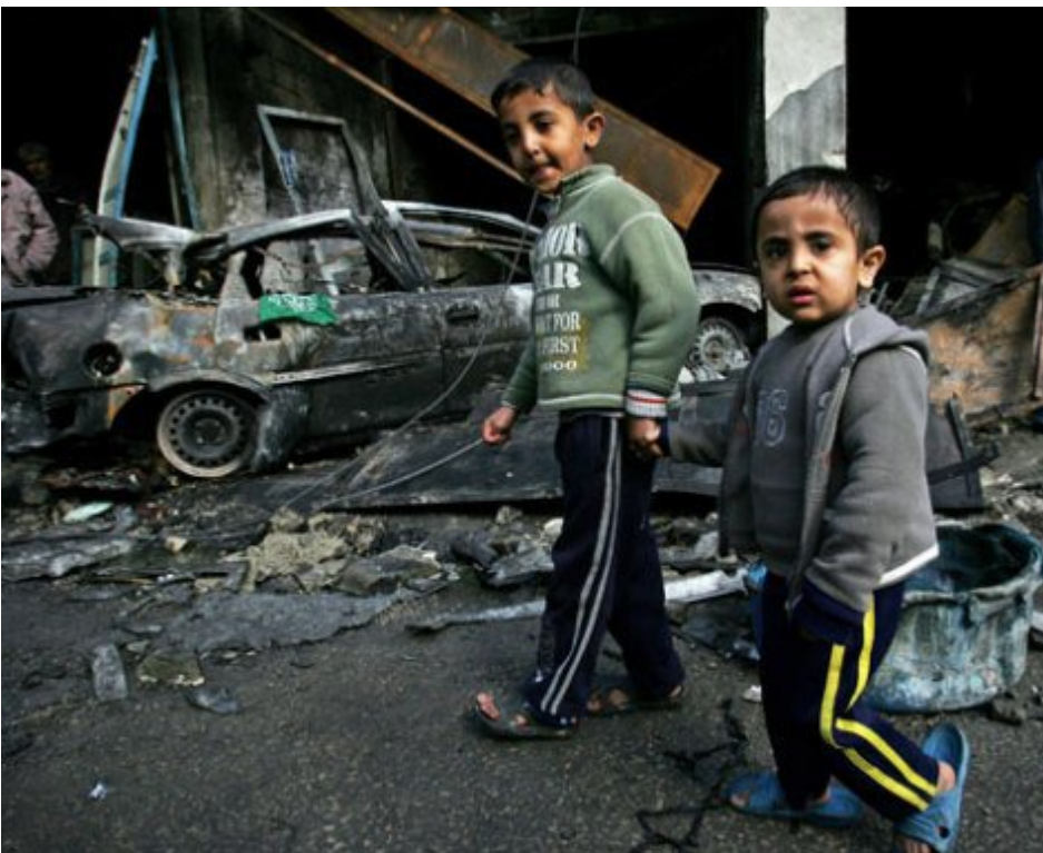
Children in Gaza walking aside a by Israel airattacks demolished mosque