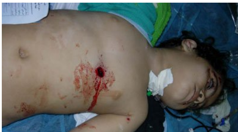
Χτυπημένα απο σφαίρες ελεύθερων σκοπευτών