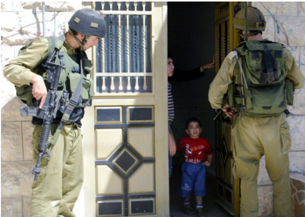
έλεγχος στα σπίτια Παλαιστινίων