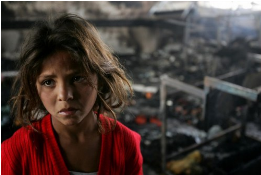
A homeless Palestinian girl stands in a burnt classroom at a United Nations school after it was hit by Israeli shelling on January 17, 2009 in Beit Lahlia