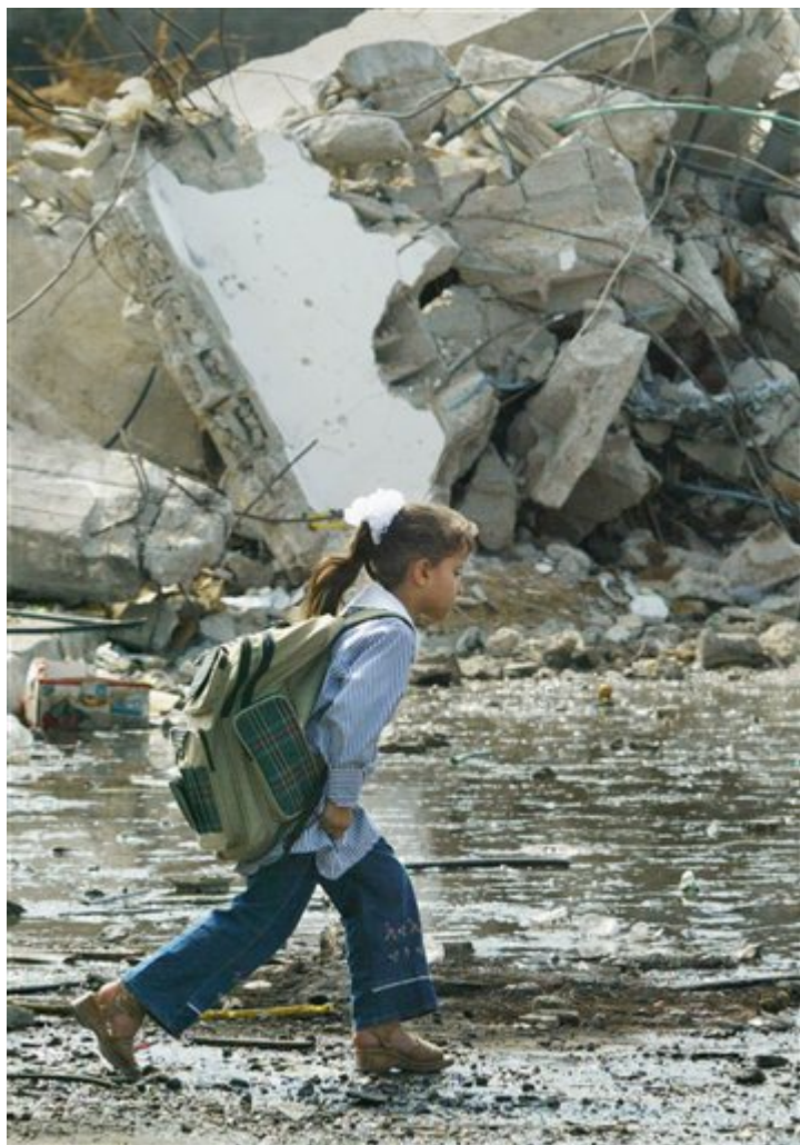
Ενα Παλαιστίνιο κορίτσι περπατά μέσα στα χαλάσματα για να φτάσει στο σχολείο