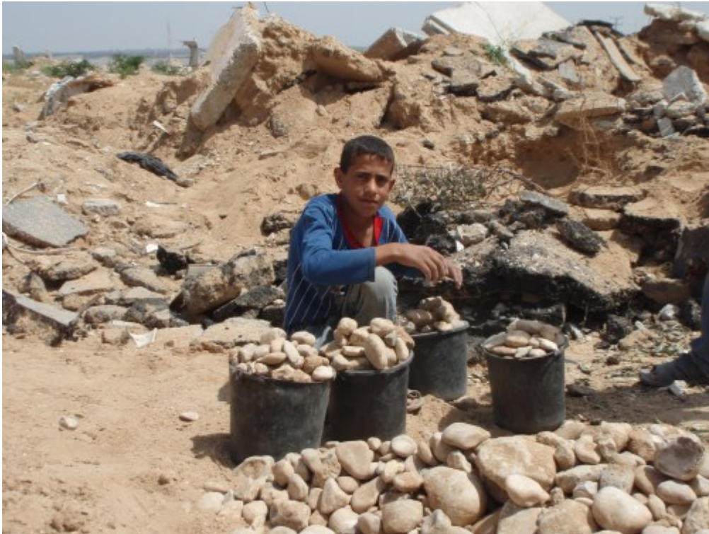
Παιδί μαζεύει μπάζα σε μια απο τις πιο επικίνδυνες περιοχές της Γάζας, όπου Ισραηλινοί ελεύθεροι σκοπευτές συχνά πυροβολούν. Μαζευει μπάζα για να τα πουλήσει ώστε να κερδίσει χρήματα για φαγητό.