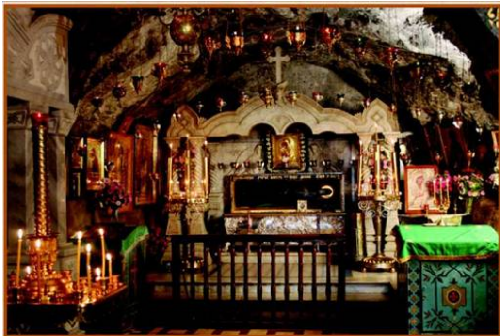
Μοιμι преп. Иова Почаевского, находящиеся в Печерной церкви

αιρέσεις της Ουνίας και των Προτεσταντών. Την ημέρα ασκούσε τον εαυτό του με συνεχές εργόχειρο, κυρίως αγροτικές εργασίες και κτίσιμο ιχθυοφραγμάτων. Τη νύχτα απο-συρόταν σ' ένα σπήλαιο στο οποίο προσευχόταν. Εκεί αξιώθηκε να αντικρίσει το άκτιστο φως. Υπήρξε, παράλληλα, σημαντικός συγγραφέας και απολογητής της Ορθοδοξίας.