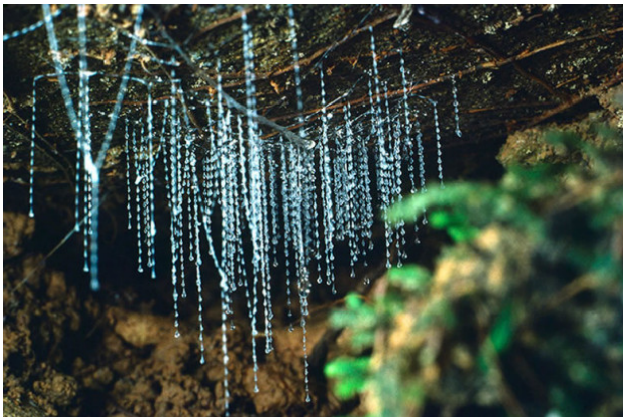
Τα σκουλήκια που φωσφορίζουν