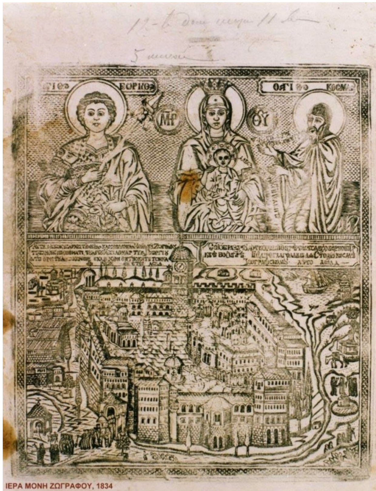
ΙΕΡΑ ΜΟΝΗ ΖΩΓΡΑΦΟΥ, 1834