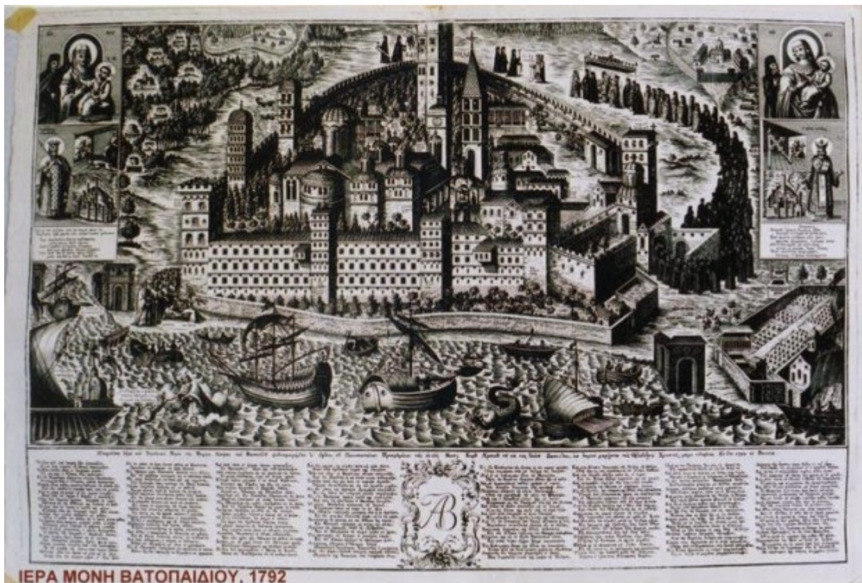
ΙΕΡΑ ΜΟΝΗ ΒΑΤΟΠΑΙΔΙΟΥ, 1792