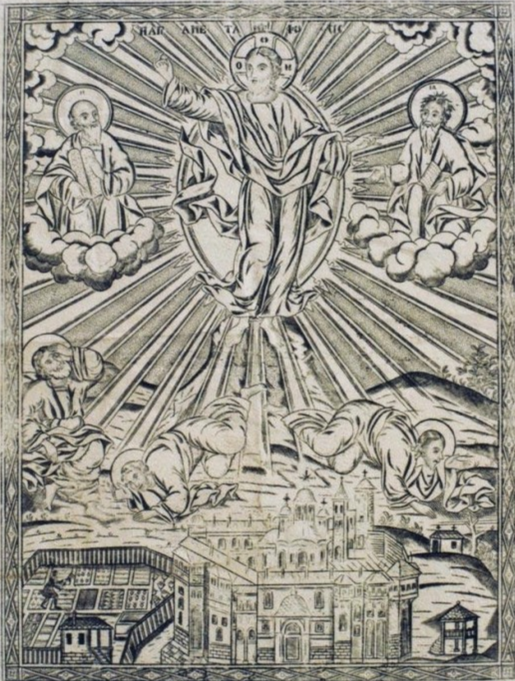
ΜΟΝΑΣΤΗΡΙΟΝ ΤΥΧΤΥΛΗΚΟΥ ΣΗΤΟΥΡΕΙ ΤΧΑΦ ΚΥΡΙΟΝ ΚΑΤΑΤΑΙΝΑΡΕΣ ΣΤΗ Ι Ο Λ Ο ΙΕΡΑ ΜΟΝΗ ΚΟΥΤΛΟΥΜΟΥΣΙΟΥ & Η ΜΕΤΑΜΟΡΦΩΣΗ ΤΟΥ ΣΩΤΗΡΟΣ, 1839