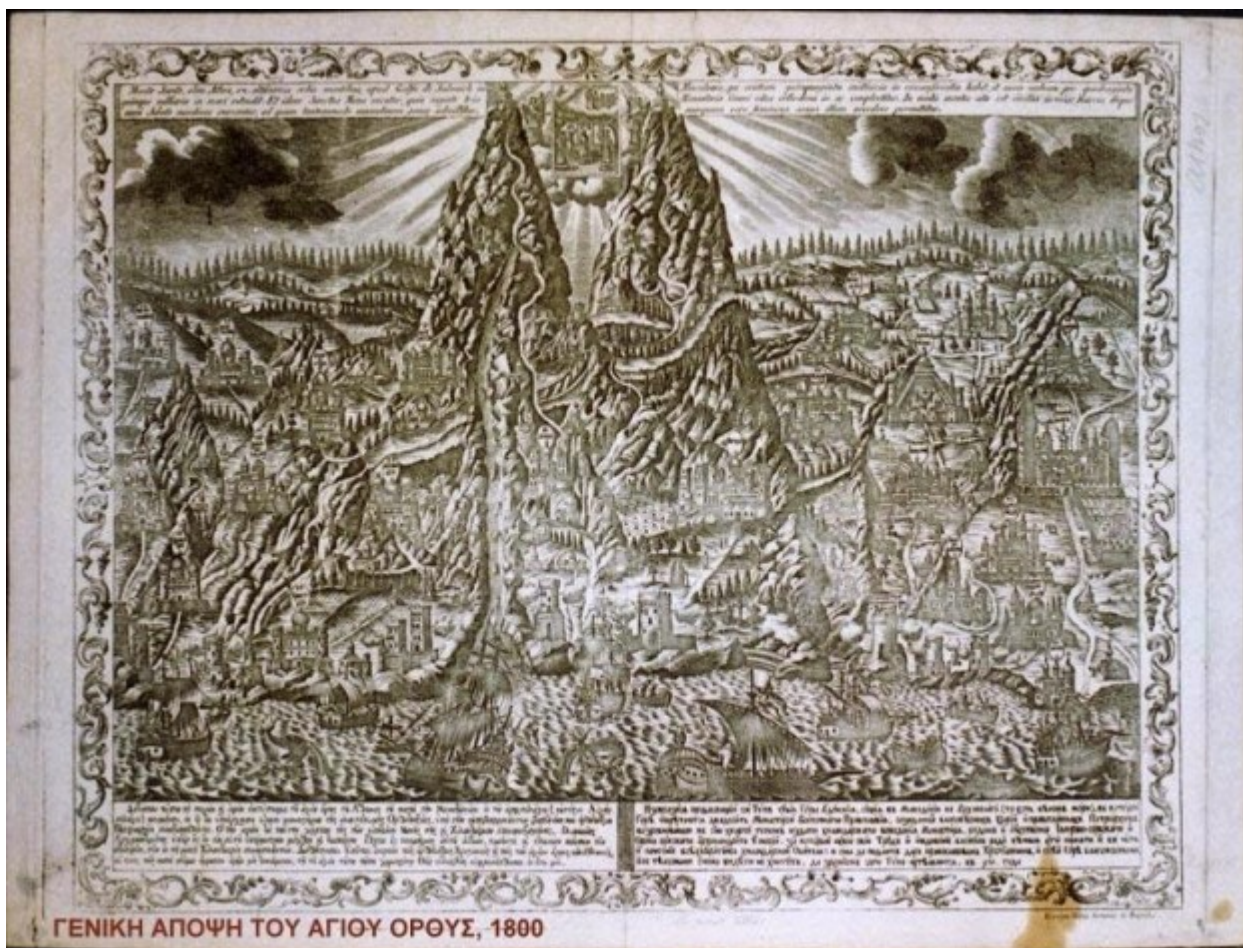
ΓΕΝΙΚΗ ΑΠΟΨΗ ΤΟΥ ΑΓΙΟΥ ΟΡΟΥΣ, 1800