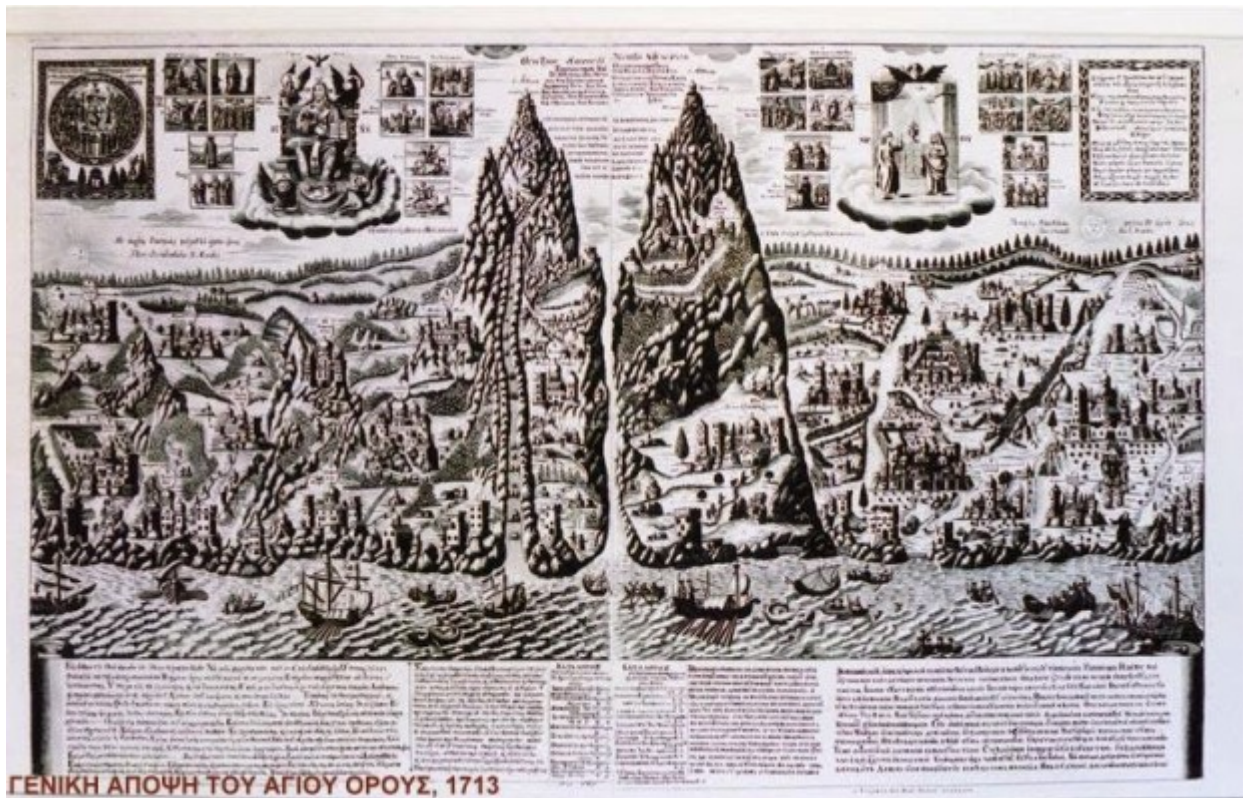
ΓΕΝΙΚΗ ΑΠΟΨΗ ΤΟΥ ΑΓΙΟΥ ΟΡΟΥΣ, 1713