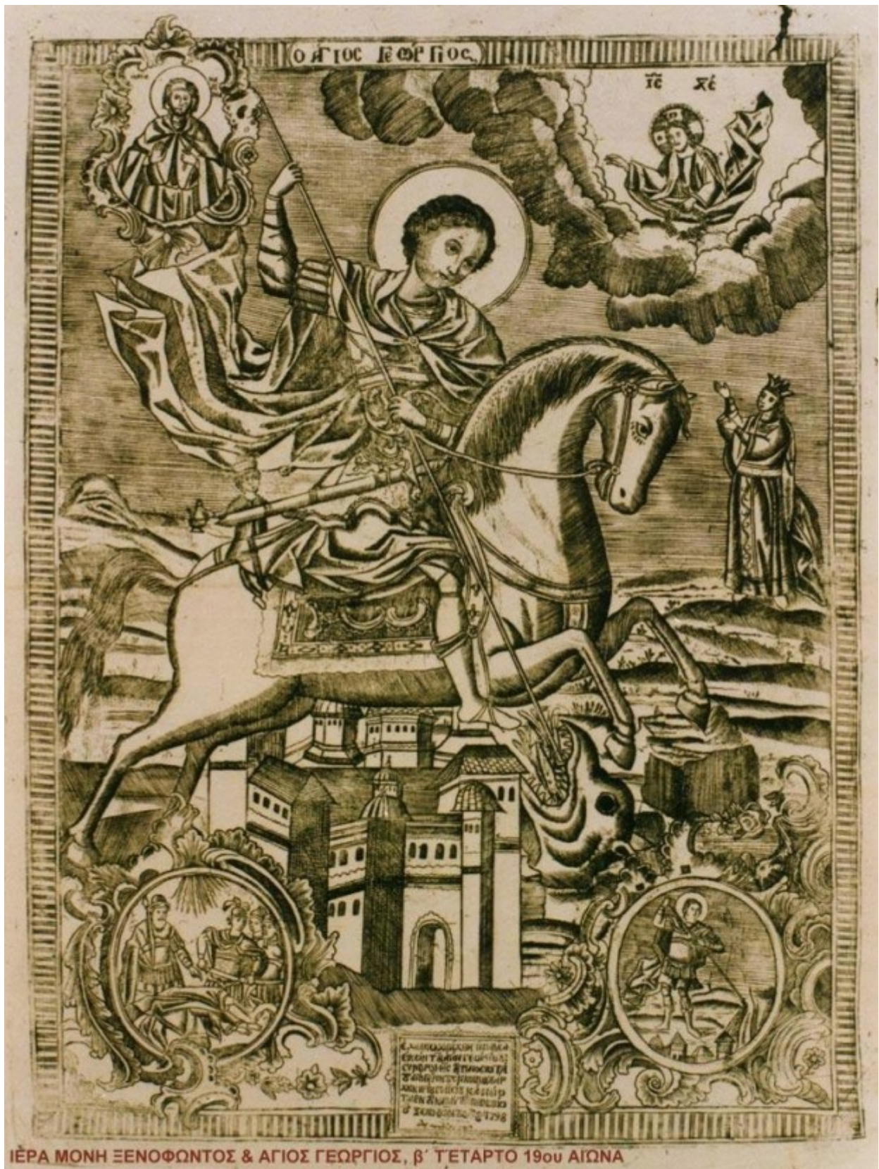
ΙΕΡΑ ΜΟΝΗ ΞΕΝΟΦΩΝΤΟΣ & ΑΓΙΟΣ ΓΕΩΡΓΙΟΣ, Β' ΤΕΤΑΡΤΟ 19ου ΑΙΩΝΑ