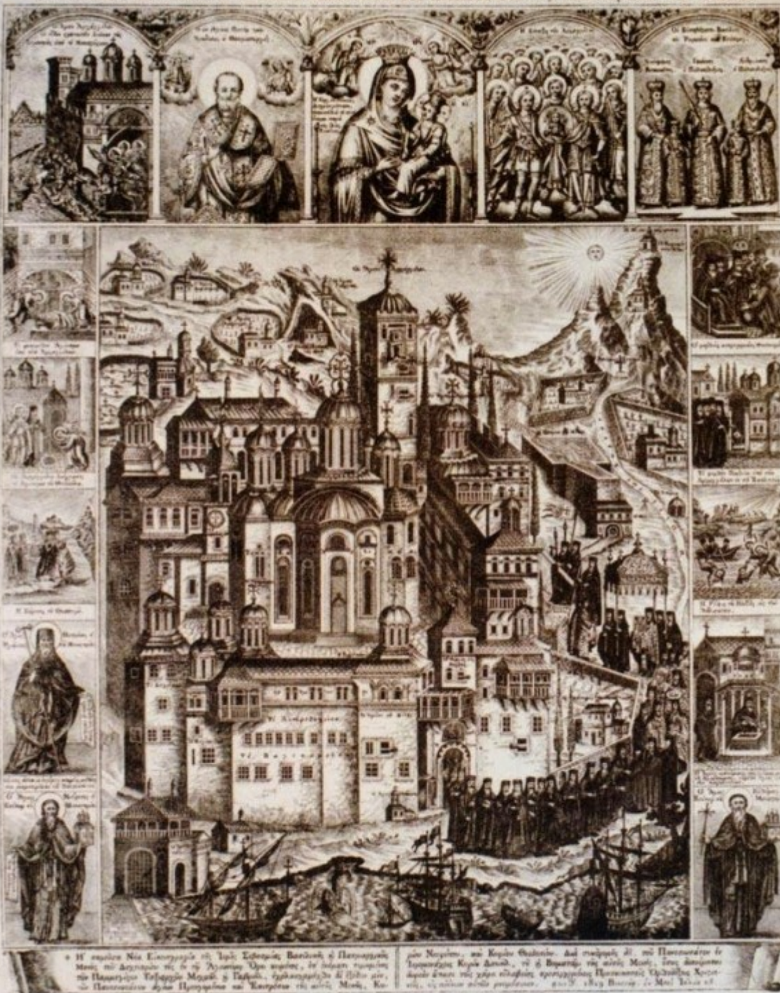
ΙΕΡΑ ΜΟΝΗ ΔΟΧΕΙΑΡΙΟΥ, 1819