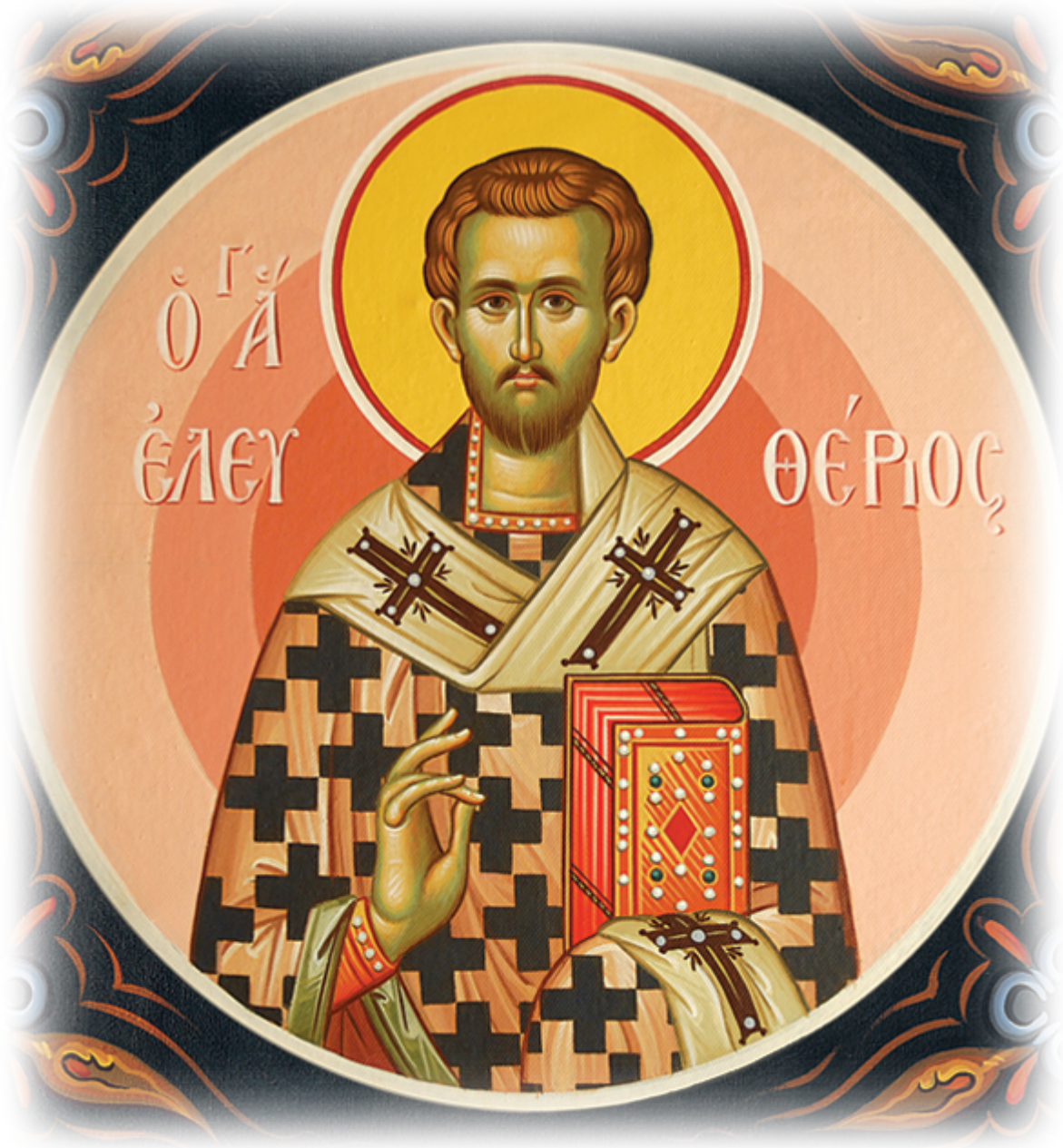
Ἅγιος Ελευθέριος ο Ιερομάρτυρας