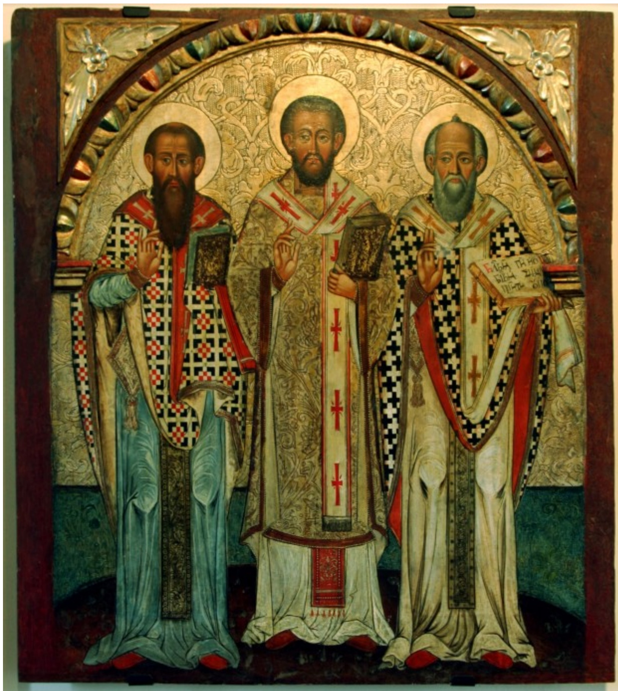
Άγιοι Τρεις Ιεράρχες

Εορτάζει στις 30 Ιανουαρίου εκάστου έτους.