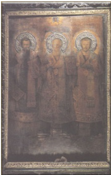
Ἅγιοι Τρεις Ιεράρχες (Ὁ Βασίλειος αριστερά, ὁ Χρυσόστομος δεξιά, στο κέντρο ὁ Γρηγόριος)- Φανάρι, Κωνσταντινούπολη