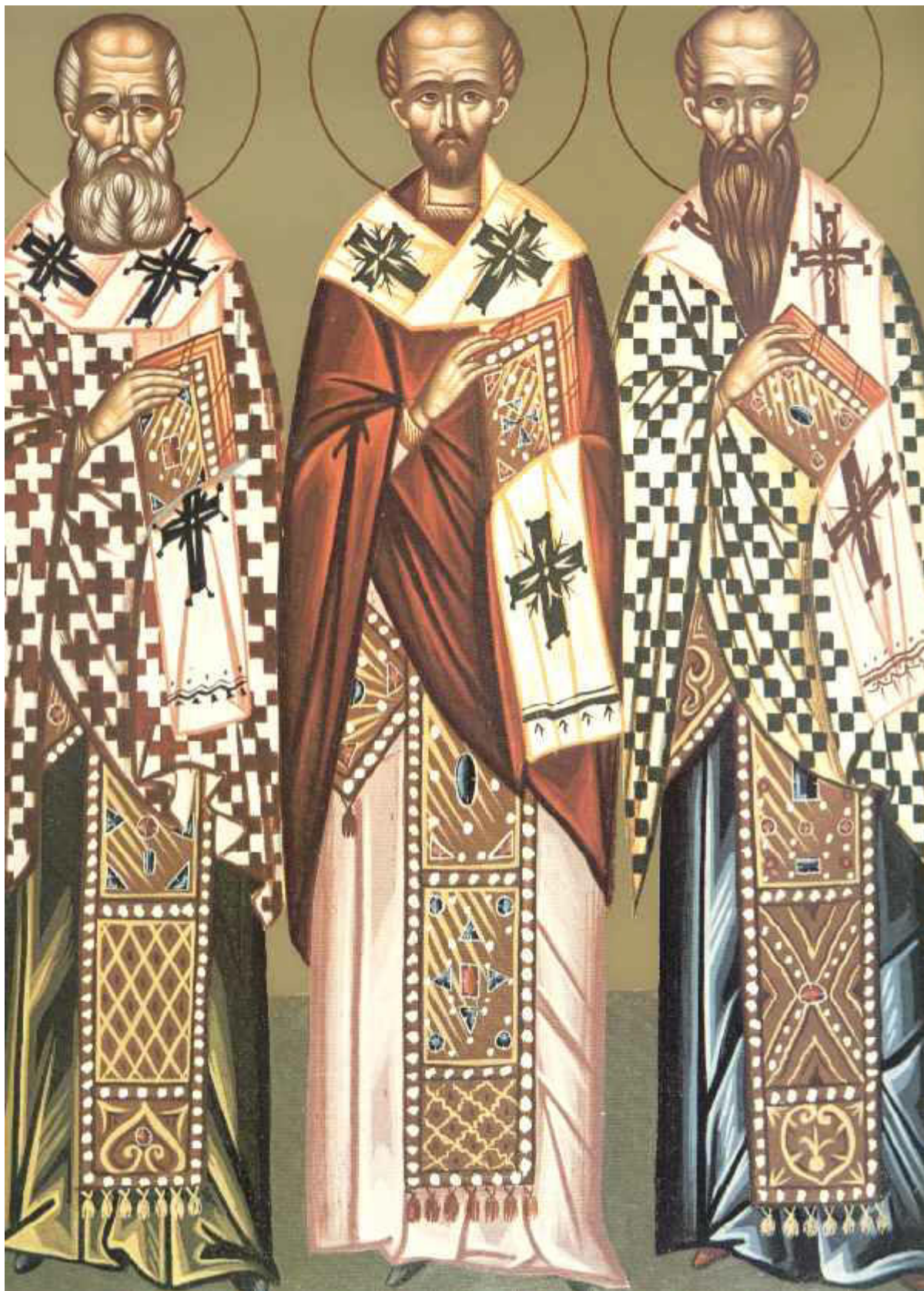
Άγιοι Τρεις Ιεράρχες