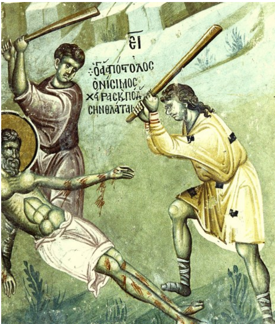
Ἅγιος Ονήσιμος ο Απὸστολος