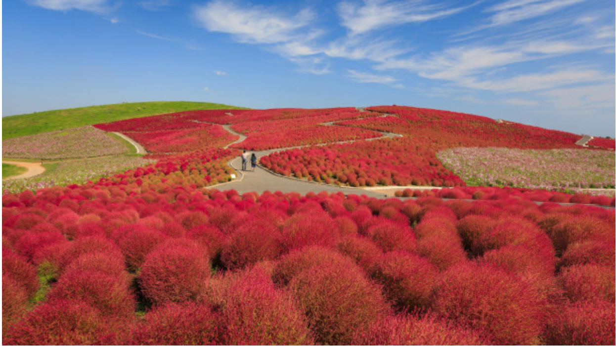
Hitachi Seaside Park, Ιαπωνία

«Πολύ καλό για να είναι αληθινό» θα έλεγαν όσοι έβλεπαν αυτά τα πανέμορφα και «παράξενα» τοπία.