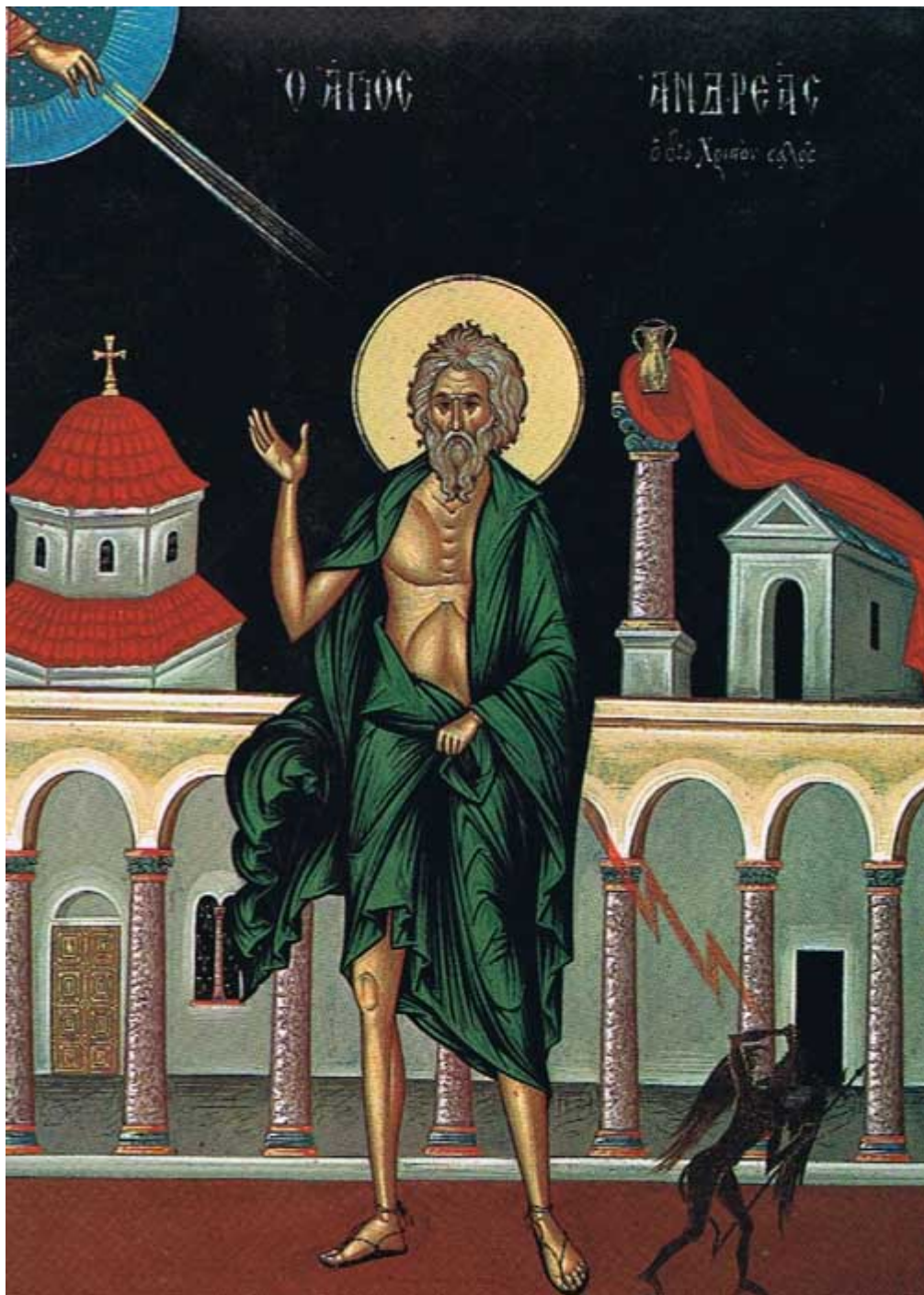
Άγιος Ανδρέας ο διά Χριστόν σάλος