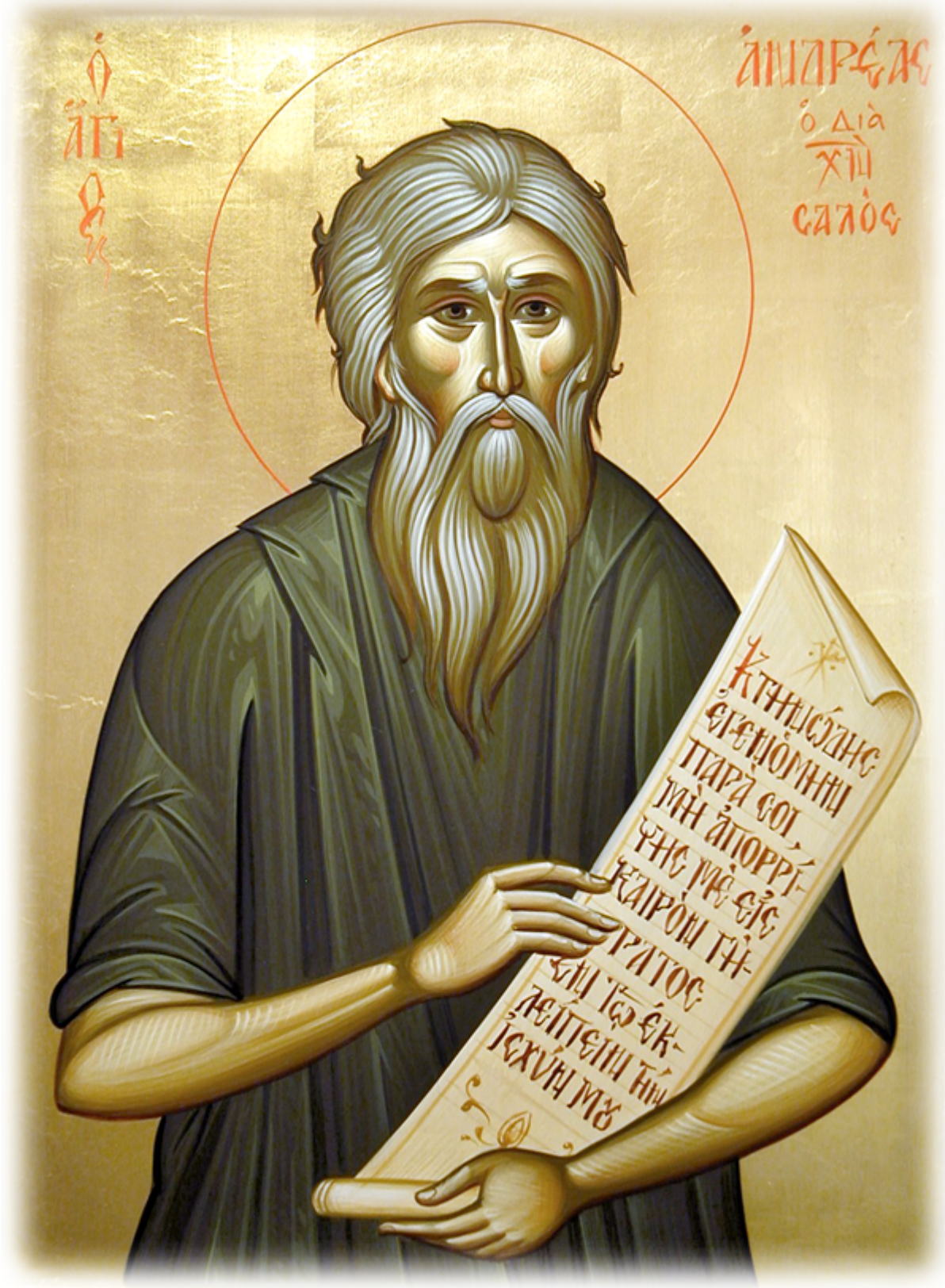
Άγιος Ανδρέας ο διά Χριστόν σαλός