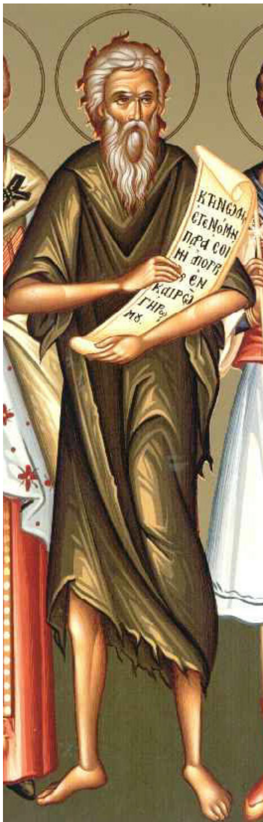
Άγιος Ανδρέας ο διά Χριστόν σαλός