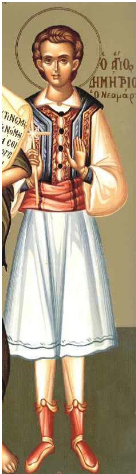
Άγιος Νεομάρτυρας Μήτρος (ή Δημήτριος)