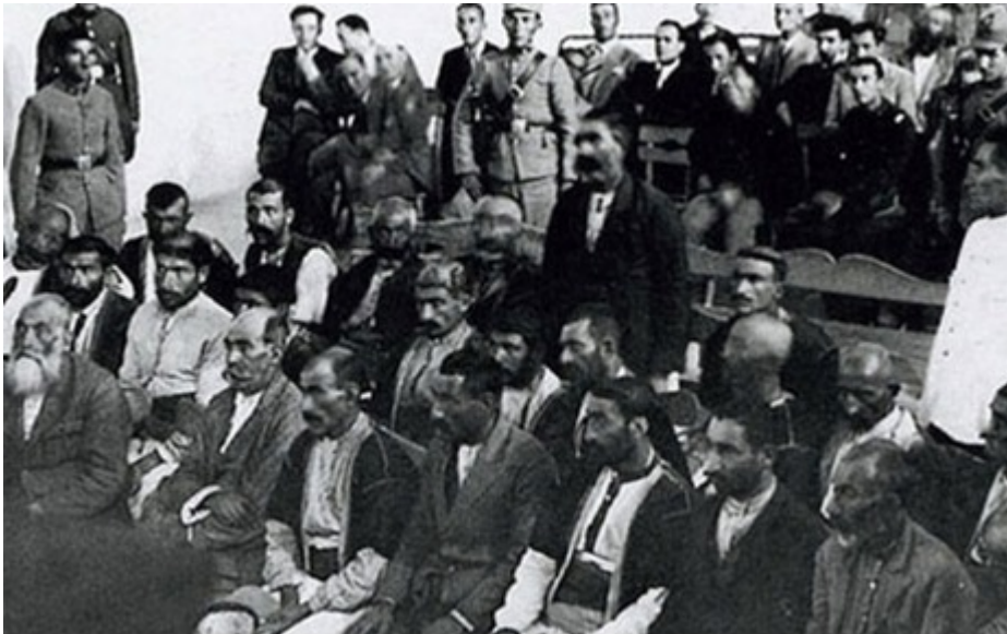
Εικόνα από τα Δικαστήρια Ανεξαρτησίας

του μαρτυρικού Πόντου, με εντολή του Κεμάλ συστήνονται τα περιβόητα Δικαστήρια Ανεξαρτησίας (İstiklâl Mahkemeleri), στα οποία δικάζονται με συνοπτικές διαδικασίες και οδηγούνται στην αγχόνη οι πιο σημαντικοί Έλληνες, η πνευματική και οικονομική ηγεσία των πόλεων και των κοινοτήτων του Πόντου.