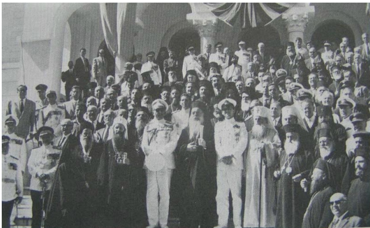
Το έτος 1963 εις τον ΑΘΩ εορτάσθηκε με μεγαλοπρέπεια η χιλιετηρίδα του Αγίου Όρους, χίλια χρόνια από την ίδρυσιν της Μεγίστης Λαύρας. Τότε εγένετο εις Άγιον Όρος η επίσκεψις του Οικουμενικού Πατριάρχου, κ.κ. Αθηναγόρα, του τότε Βασιλέως Παύλου, του διαδόχου Κωνσταντίνου, και η εκ περάτων σύναξις της Οικουμενικής Ορθοδοξίας.

άνθρωπο, από βίωση σε βίωση. Έπλασε από την Επιστήμη μια θεότητα.