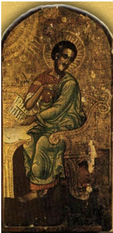
Άγιος Λουκάς ο Ευαγγελιστής – Φανάρι, Κωνσταντινούπολη