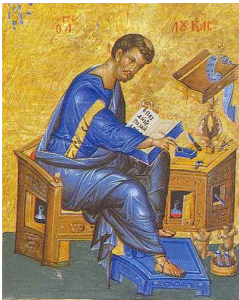
Άγιος Λουκάς ο Ευαγγελιστής

Εορτάζει στις 18 Οκτωβρίου εκάστου έτους.