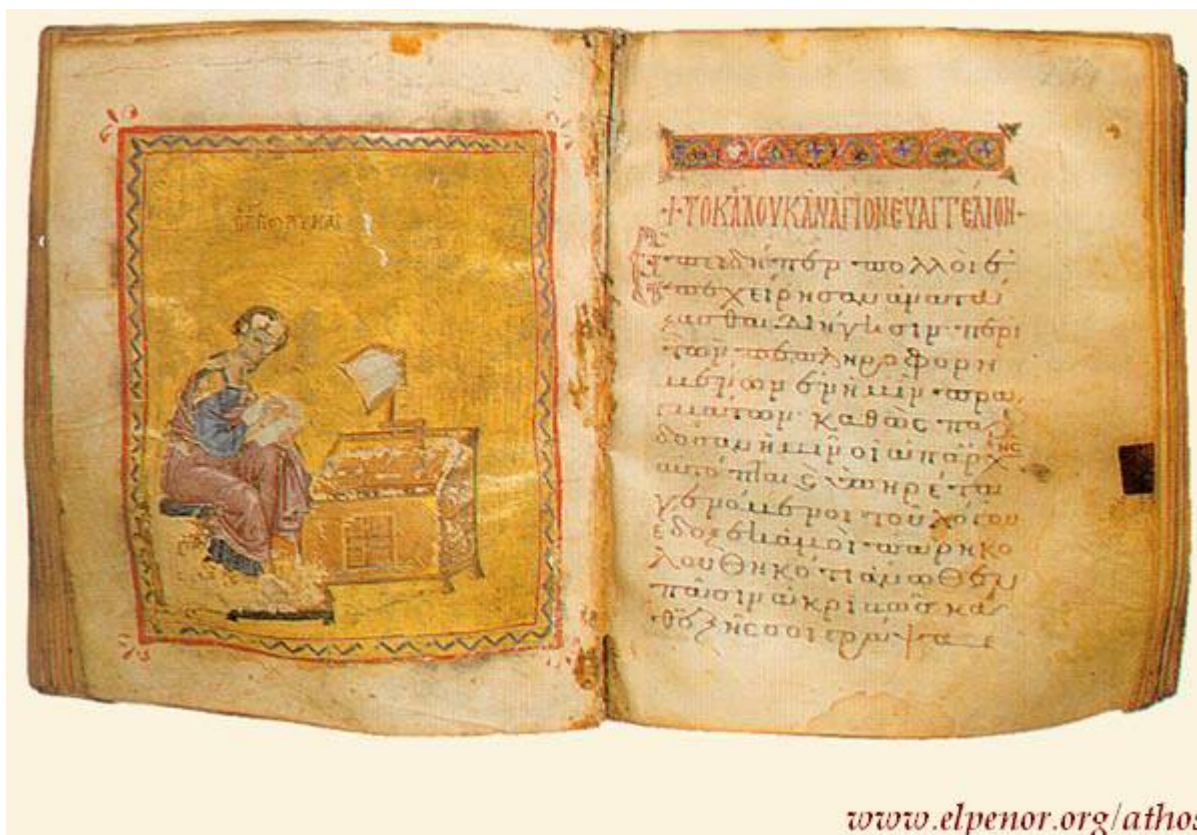
Άγιος Λουκάς ο Ευαγγελιστής (Τετραευάγγελο σε περγαμνή) - 13ος αι. μ.Χ. - Μονή Καρακάλλου, Άγιον Όρος