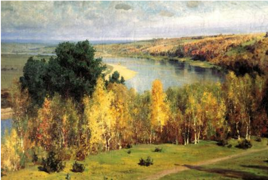
Βασίλι Πολένοφ, «Χρυσό Φθινόπωρο», 1893.

Η «θλιμμένη εποχή» αποτέλεσε ορόσημο στη λογοτεχνική δημιουργικότητα του μεγάλου Ρώσου συγγραφέα.