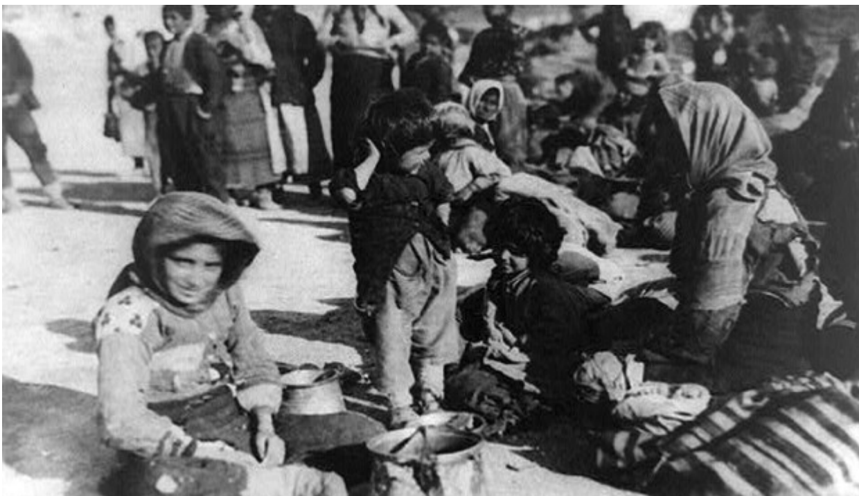
Πρόσφυγες από την Ανατολία στο Χαλέπι της Συρίας.

Πόστερ για τη δωρεά χρημάτων για τους επιζήσαντες από τις γενοκτονίες Αρμενίων, Ελλήνων και Σύρων, μεταξύ 1917-1919.