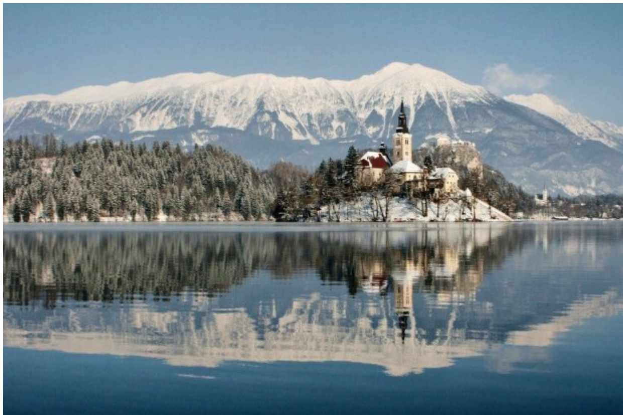
Η χώρα των Μούμιν-Τρολλ, Φινλανδία