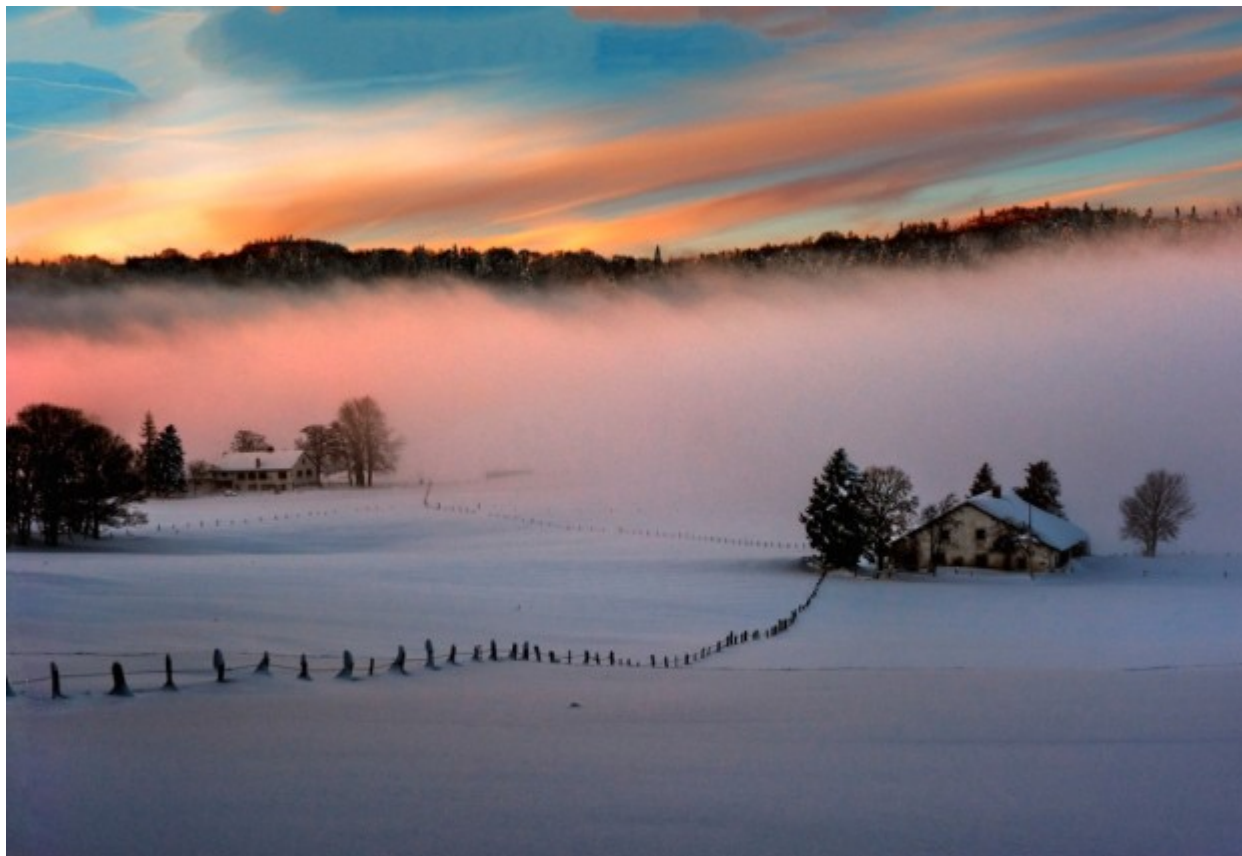
Η λίμνη Πέιτο, Καναδάς