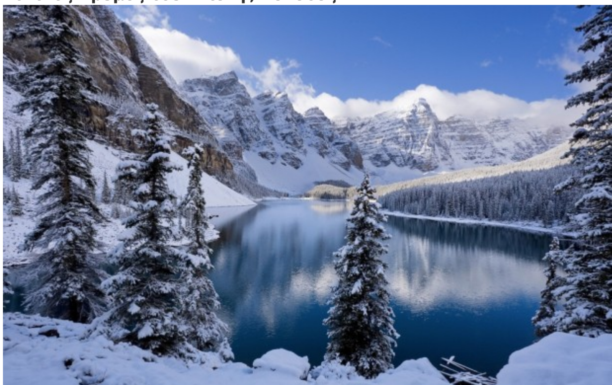
Αρκτικά δάση, Νορβηγία