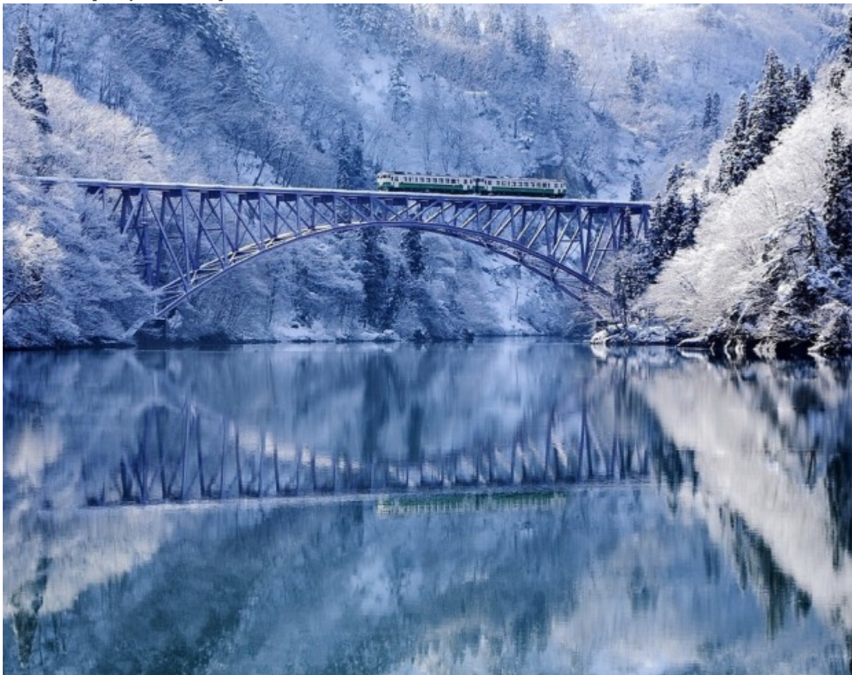
Λα Τουρνέ, Ελβετία