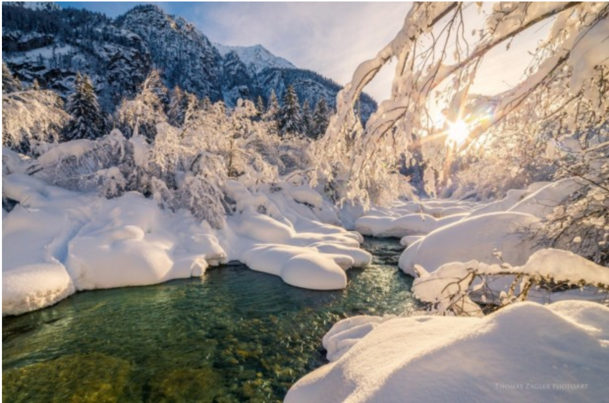
Ο ποταμός Ταντάμι, Ιαπωνία