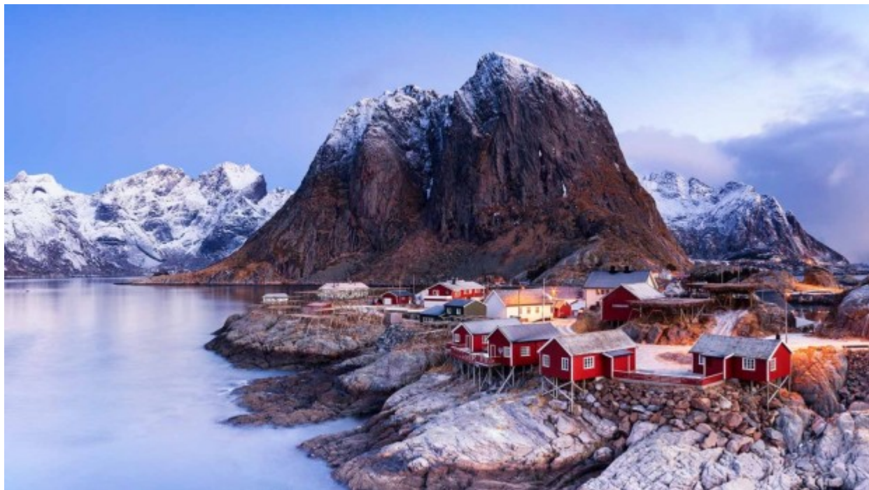
Εθνικό πάρκο Καμπίνα, Ιταλία