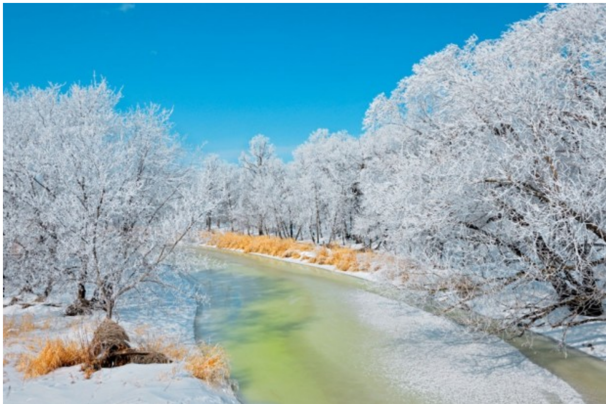
Δολομιτικές Άλπεις, Ιταλία