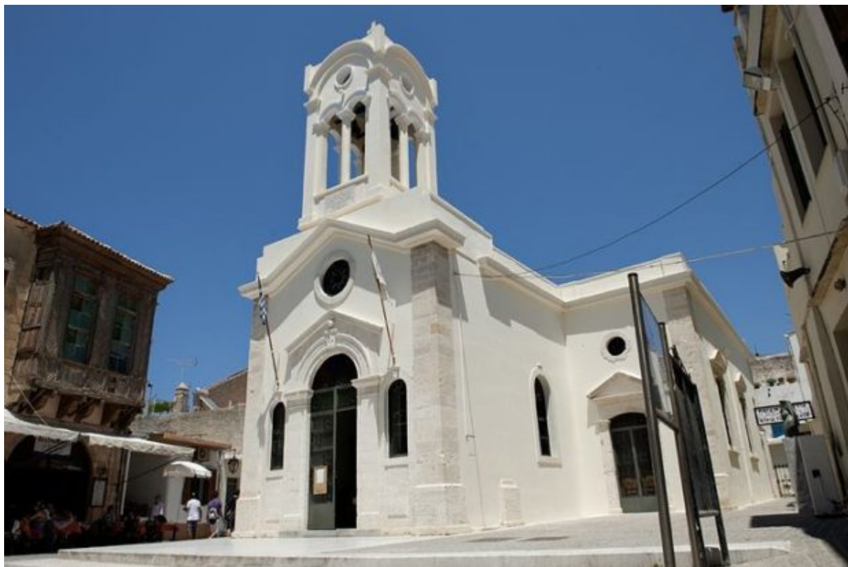
Монастырь Божией Матери Кира