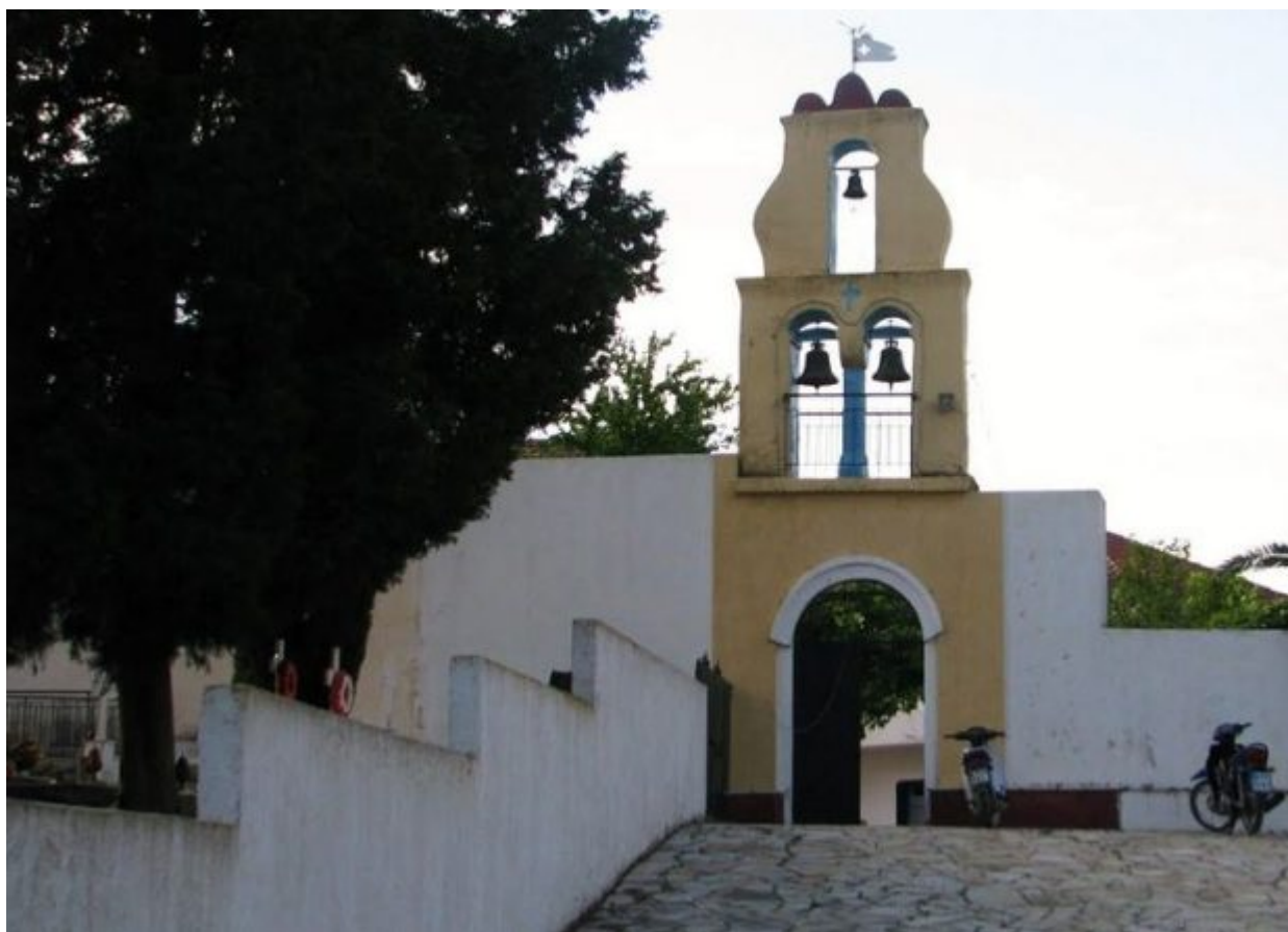
Монастырь Божией Матери Кира