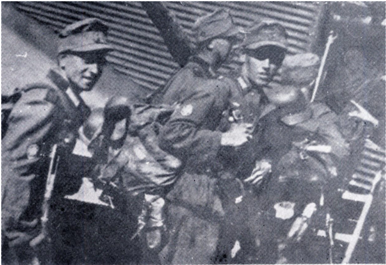
Ἐπιβίβασις Γερμανῶν ἀλεξιπτωτιστῶν διὰ Κρήτην.

αποκάλυπταν την ταυτότητά τους με την συνθηματική λέξη «Major Bock»! (Ταγματάρχης Μποκ). Πόσο όμως έπεσε έξω!