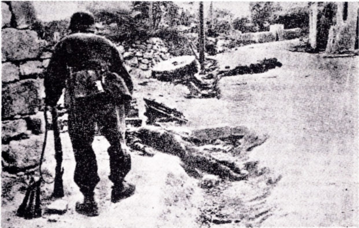
Ἀπὸ τὰς ὁδομαχίας τοῦ Γαλατᾶ.

Ο Φον ντερ Χάιντε συγκέντρωσε και αναδιοργάνωσε τους άντρες του και άρχισε να επιτίθεται στα υψώματα που δέσποζαν της πόλης των Χανίων. Οι λόχοι του αναπτύχθηκαν και ενώ προχωρούσαν αντιμετώπισαν ισχυρή αντίσταση με πυρά πολυβόλων. Η μάχη ξεκίνησε με πυρά και ελιγμούς ανάμεσα από ελαιόδεντρα προς το Μεγάλο Κάστρο.