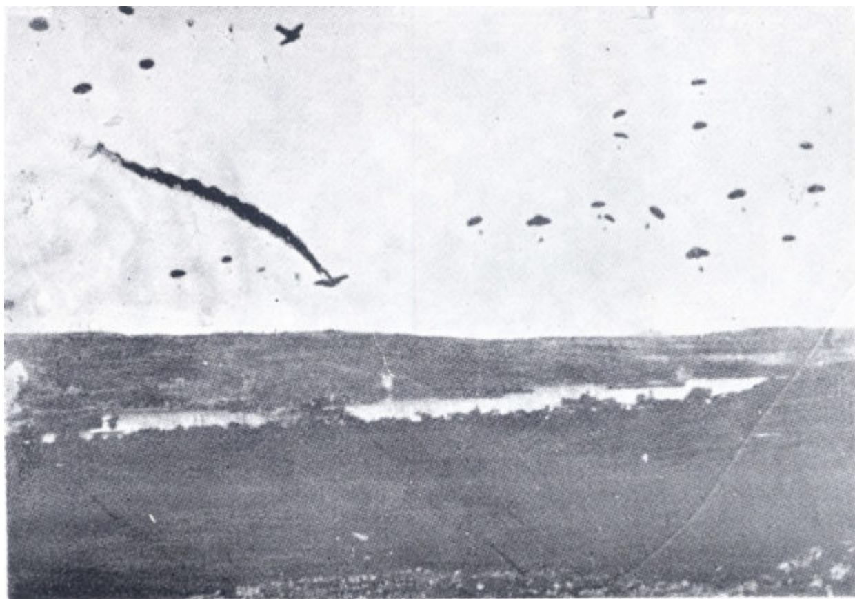
Ρίψις Γερμανῶν ἀλεξιπτωτιστῶν εἰς περιοχὴν Σούδας.

Μαρτυρία ενός Γερμανού Αξιωματικού των Αλεξιπτωτιστών...Εμπρός! Στα αεροπλάνα... Μια σπάνια μαρτυρία !