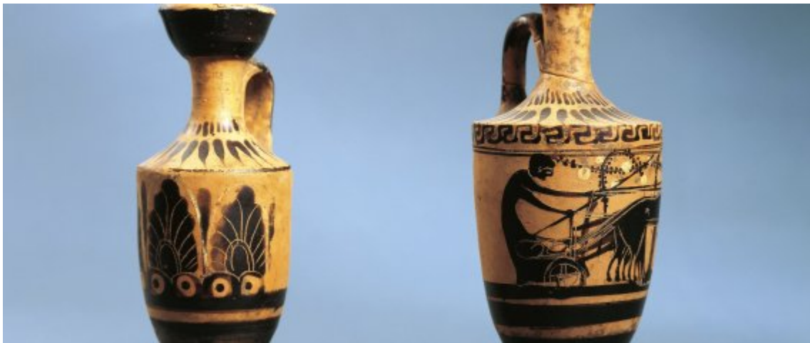
UNSPECIFIED - CIRCA 1987: Italy, Calabria, Black-figure Attic Lekythoi (vases used to store oil) from the grave no.165 .

Αρχαία ελληνικά αντικείμενα που είχαν κλαπεί από την Αθήνα τη δεκαετία του 1970 και είχαν καταλήξει στην παράνομη συλλογή του Σικελού αρχαιοκάπηλου Τζιανφράνκο Μπεκίνα, ήταν μεταξύ των κλασικών έργων τέχνης που διατίθεντο προς πώληση στη φετινή έκθεση Frieze Masters του Λονδίνου στις αρχές του μήνα, σύμφωνα με δημοσίευμα του Guardian.