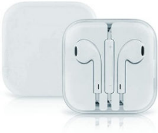
Ελαφριά μπλε απόχρωση