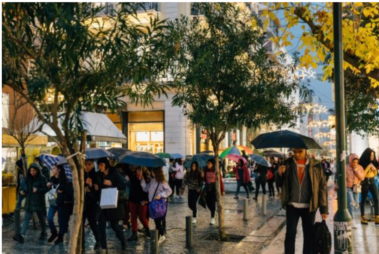
Οι πωλητές των ισοτιούτων αδυνατίσματος της Ερμού φαίνεται να πολλαπλασιάζονται σε σημείο, μάλιστα, που καθίσταται αδύνατη μερικές φορές ακόμη και η διέλευση στον πεζόδρομο.

«Συγχαρητήρια! Μόλις κερδίσατε μια δωρεάν θεραπεία. Η προσφορά είναι μόνο για σήμερα. Μην τη χάσετε!». Η «τυχερή» γυναίκα ανεβαίνει στους επάνω ορόφους των ισοτιούτων αδυνατίσματος της Ερμού. Αυτό που συναντά, όμως, εκεί, είναι εντελώς διαφορετικό.