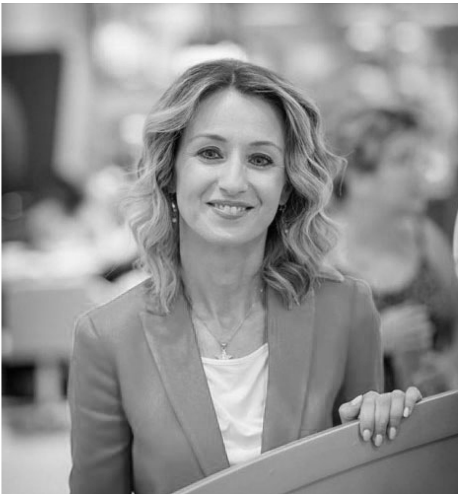
Η Αναπληρώτρια Συνήγορος Καταναλωτή, Αθηνά Κοντογιάννη

Την έξαρση του φαινομένου παρατηρεί, όμως, και ο Συνήγορος του Καταναλωτή, ο οποίος το 2017, ύστερα από σωρεία αναφορών, δημοσιεύει έκθεση στην οποία γνωστοποιεί επίσημα πια τις μεθόδους πρακτικής των ινστιτούτων αισθητικής και καλεί τους καταναλωτές να είναι ιδιαίτερα προσεκτικοί όταν επισκέπτονται τις συγκεκριμένες επιχειρήσεις.