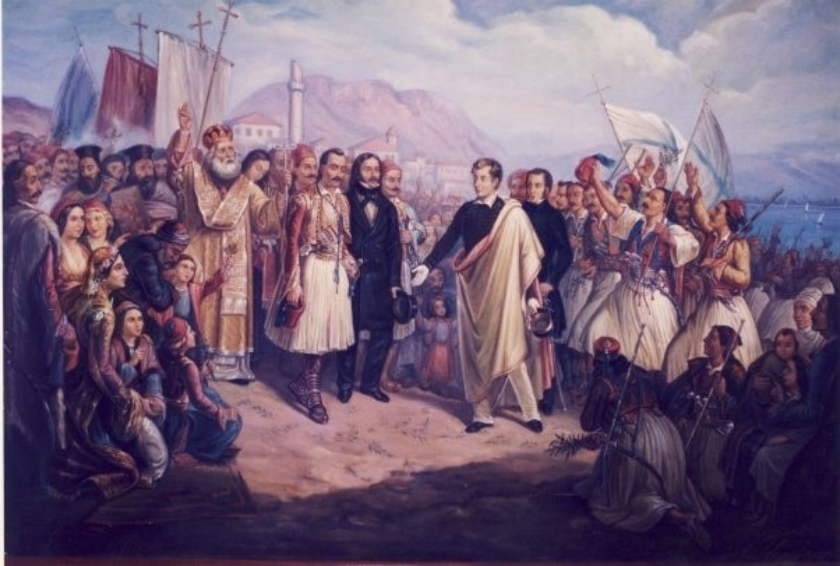
Η άφιξη του Λόρδου Βύρωνα στο Μεσολόγγι.

Χρονικών» Ιωάννη Μάγερ συνεργάζεται σε οργανωτικά θέματα του Αγώνα.