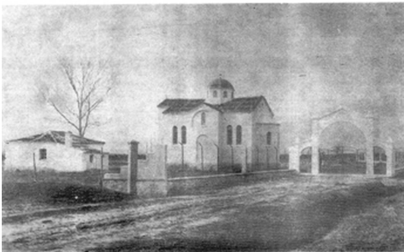
Ἡ Μονὴ κατὰ τὸ 1955

χρονογράφων ήταν το όνομα της ευρύτερης περιοχής. Παναγία ονομάζονταν όλο το πεδινό άνοιγμα όπου κατά την περίοδο της Βυζαντινής Αυτοκρατορίας υπήρξαν και συνέβησαν πάρα πολλά πολεμικά γεγονότα.