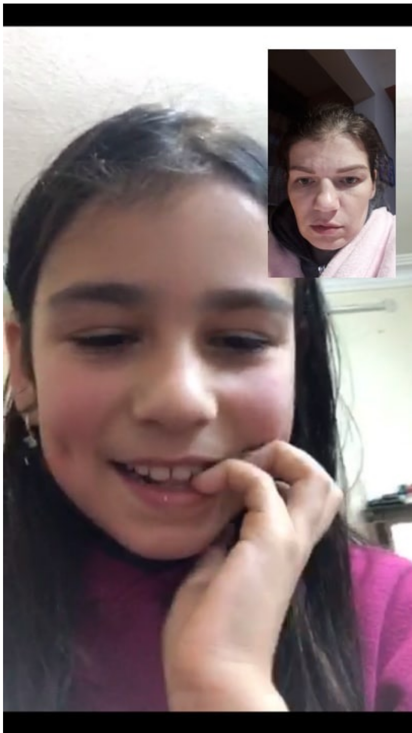
Screenshot από συνομιλία που είχε η Αλεξάνδρα με την Τζασμίν

Και ρωτώ κάθε άνθρωπο και κάθε ηγέτη στον πολιτισμένο κόσμο: Πώς γίνεται να επιτρέπουν ένα παιδί να μεγαλώνει χωρίς τη μητέρα του; Ακόμη χειρότερα, από τη στιγμή που ο Μ. αποφάσισε να μείνει στην Κύπρο, η κόρη μου ζει ουσιαστικά σαν ορφανή, αφού στην Ιορδανία δεν έχει κοντά της ούτε εμένα ούτε τον πατέρα της. Πώς γίνεται τα κράτη να μην έχουν ρυθμίσει τέτοιες καταστάσεις; Πώς γίνεται να επιτρέπουν τέτοια εγκλήματα;».