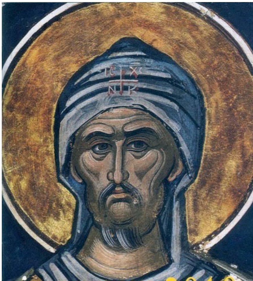
Όσιος Εφραίμ ο Σύρος.

Φρόντιζε να έχεις στο νου σου τη Θεία χάρη, για να μην εμπαιχθείς. Υπηρέτησέ την ως φύλακα, για να μη λυπηθεί και σε εγκαταλείψει. Τίμησέ την ως δάσκαλο των αοράτων πραγμάτων, για να μη σκοντάφτεις εξαιτίας της απουσίας της, σαν να είσαι στο σκοτάδι. Μη θελήσεις ν' αγωνισθείς χωρίς αυτή, για να μην πεθάνεις ντροπιασμένος. Μη βαδίσεις χωρίς αυτή το δρόμο της αρετής· διότι ο Δράκοντας σε επιβουλεύεται.