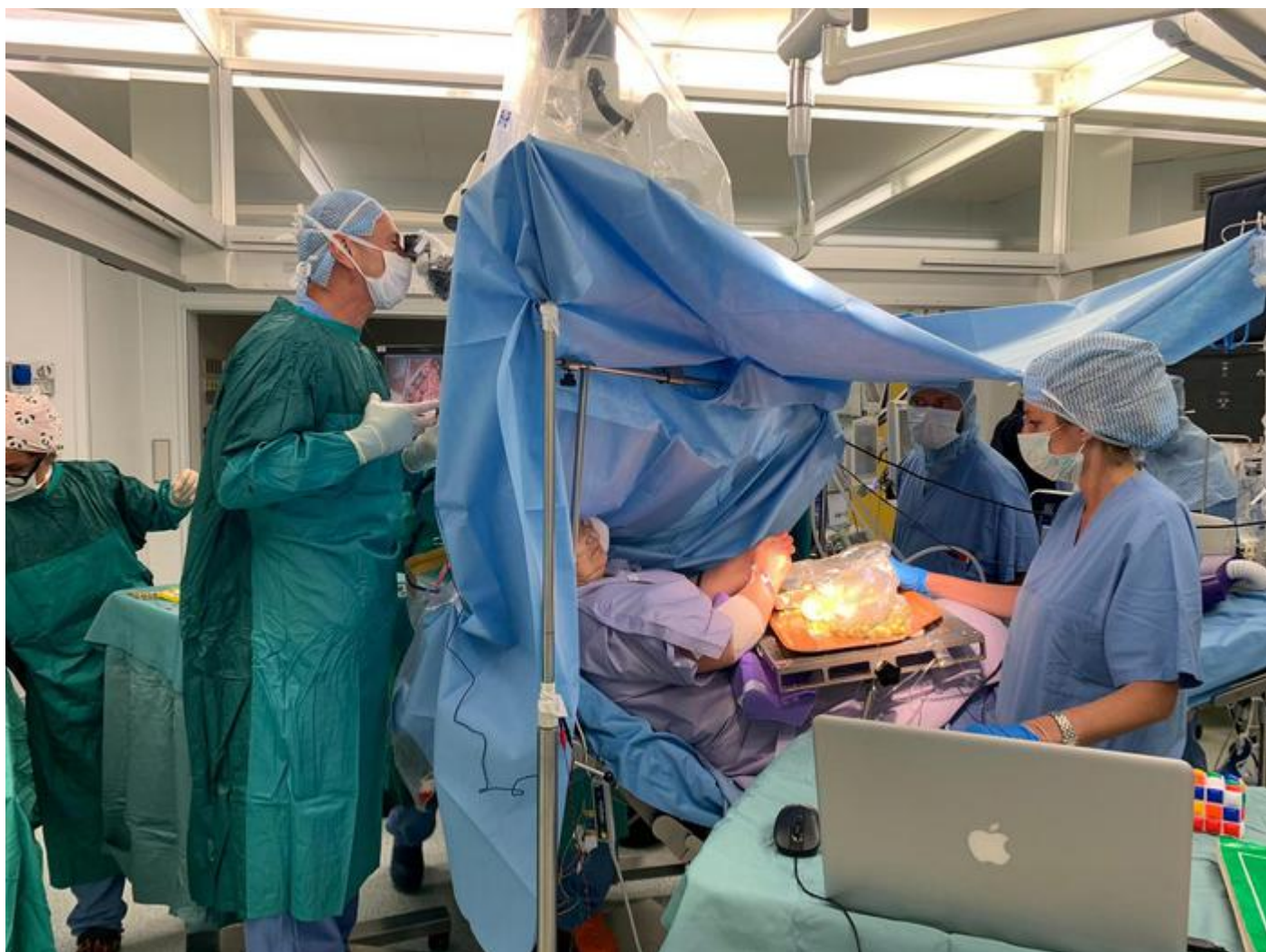
Intervento su cervello da sveglia su donna che prepara olive all'Ascolana agli Ospedali Riuniti Ancona

Το παραπάνω έκανε μία 60χρονη Ιταλίδα, η οποία υπεβλήθη σε χειρουργική επέμβαση για αφαίρεση όγκου από τον εγκέφαλο. Η γυναίκα γέμιζε... ελιές καθ' όλη τη διάρκεια της αφαίρεσης, η οποία σύμφωνα με τον γιατρό «πήγε πολύ καλά».