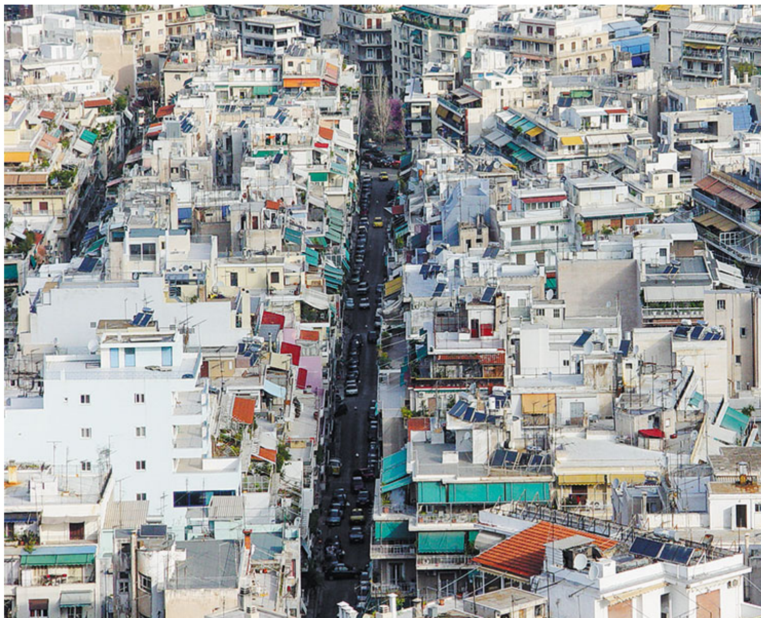
Πυκνός πολεοδομικός ιστός της Αθήνας με κυρίαρχη τη μορφή της μεταπολεμικής πολυκατοικίας

Μια «αμιγώς ελληνική εκδοχή της μοντέρνας πολεοδομικής ανάπτυξης» στην Ελλάδα, η πολυκατοικία, γίνεται αντικείμενο μελέτης διεθνώς αλλά και αποτελεί το δέλεαρ για μια δημόσια συζήτηση. Αφορμή είναι το βιβλίο του Richard Woditsch, Γερμανού αρχιτέκτονα και καθηγητή της Θεωρίας της Αρχιτεκτονικής και του Ντιζάιν στο Ινστιτούτο Τεχνολογίας της Νυρεμβέργης, με θέμα την αθηναϊκή πολυκατοικία. Το βιβλίο κυκλοφόρησε στα αγγλικά το 2019 με τίτλο «The Public Private House - Modern Athens and its polykatoikia» και είναι η αφορμή για την εκδήλωση που διοργανώνει το Ινστιτούτο Γκαίτε Αθηνών την Τρίτη 22 Σεπτεμβρίου (20.00-22.00) στο αίθριο του ανακαινισμένου κτιρίου, με όλες τις οδηγίες τήρησης της δημόσιας ασφάλειας και υγείας.