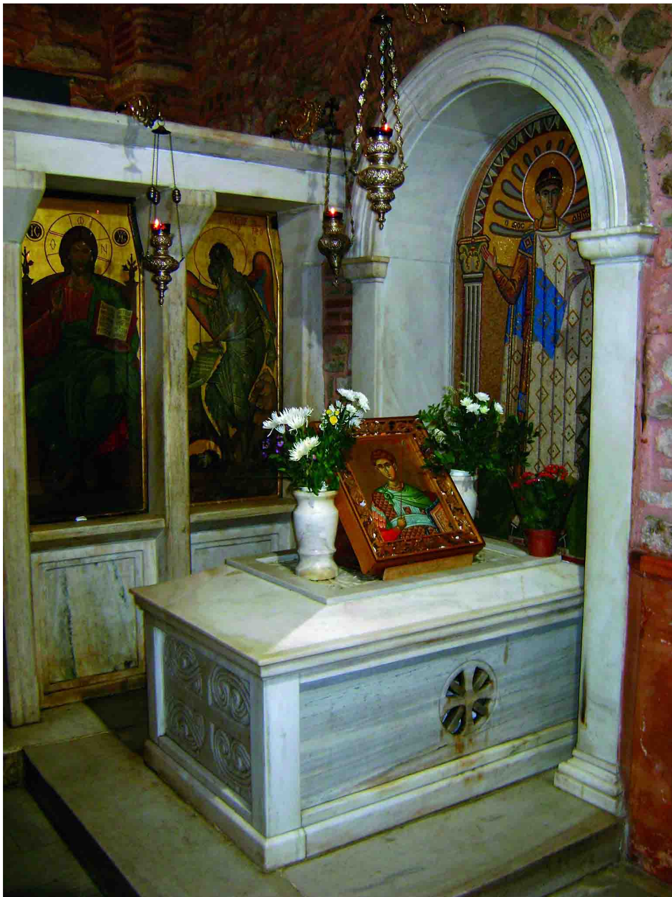
Κατά τη διάρκεια της Τουρκοκρατίας ο χώρος ήταν υπό τον έλεγχο των Τούρκων